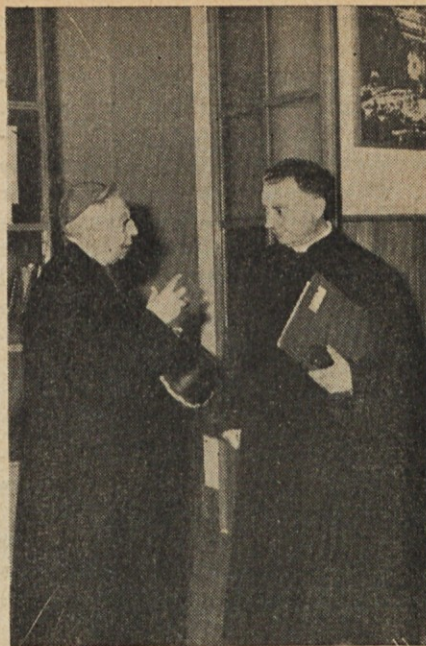
Kardinal Lercaro, predsednik liturgične komisije s tajnikom

Nova benediktinska opatija v Beuronu (1863) je v začetku kar nekam posnemala Solesmes. Tu sta delovala v