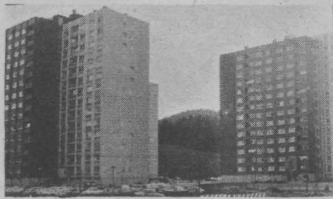
Mrak lega na zemljo