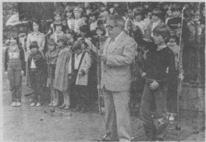
Slavnostni govornik na skupni proslavi štirih KS je bil narodni heroj Stane Bobnar