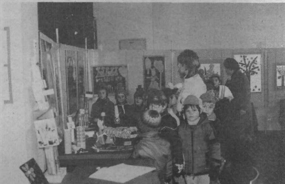
»Veliko stvari lahko čaka, vendar ne otrok. Otroku ne moremo reči – »jutri«. Njegov čas je »danes«. V letu otroka so pod tem geslom v domu družbenih organizacij Stadion pripravili izredno privlačno razstavo ročnih izdelkov in risb cicibanov iz bežigradskih vrtec. Za razstavo je veliko zanimanje, iz dneva v dan si jo prihajajo ogledovat mladi iz vrtec in bežigradskih šol, pa tudi številni občani, ki prihajajo na razne sestanke v družbeni dom.