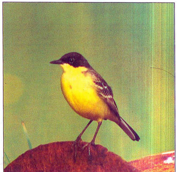
Slika 2: Motacilla flava feldegg , Ljubljansko barje