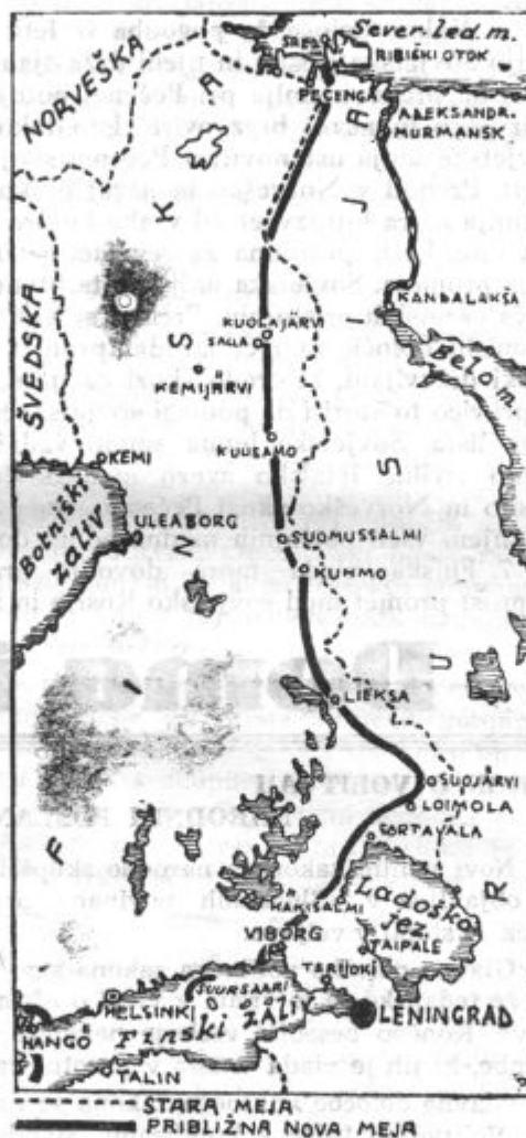
Približna nova rusko-finska meja

Švicarsko časopisje javlja, da se vrše med Nemčijo in Vatikanom pogajanja za sklenitev novega konkordata. Vatikan si prizadeva, da bi dosegel svobodo bogočastja tako v Nemčiji kakor tudi na Poljskem in Češko-moravskem protektoratu.