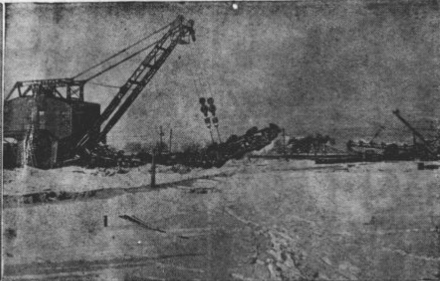
Levo: Ostanki nemške oklopne križarke »Admiral Graf von Spee« Ladja deloma štrli iz vode. Te razbitine je Nemčija sedaj prodala južnoameriškim zbiralcem starega železa — Desno: Z orjaškimi grebali kopljeje Nemci na zapadnem bojišču pasti za tanke in jarke za vojake.