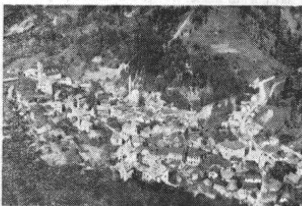
Čajniče s Cicelj planino, ki jo pokrivajo lepi gozdovi.