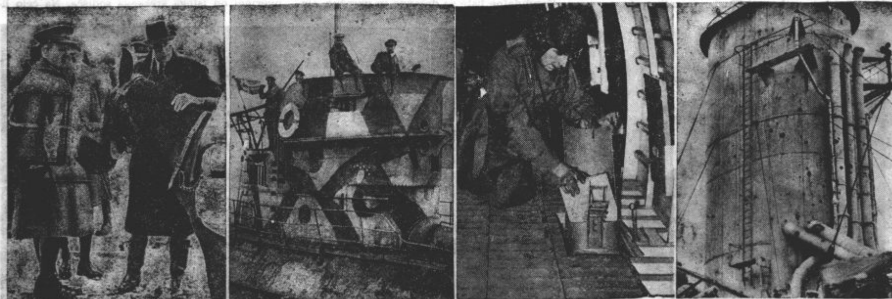
Z leve na desno: Angleški vojni minister Oliver Stanley in genera Gort na za padnem bojišču. — Nemška podmornica doma — Angleški vojni pilot spušen med poletom nad nemškimi ozemljem letake — Takole je izgledal dimnik na angleški križarki »Exeter« neposredno po bitki pri La Plati