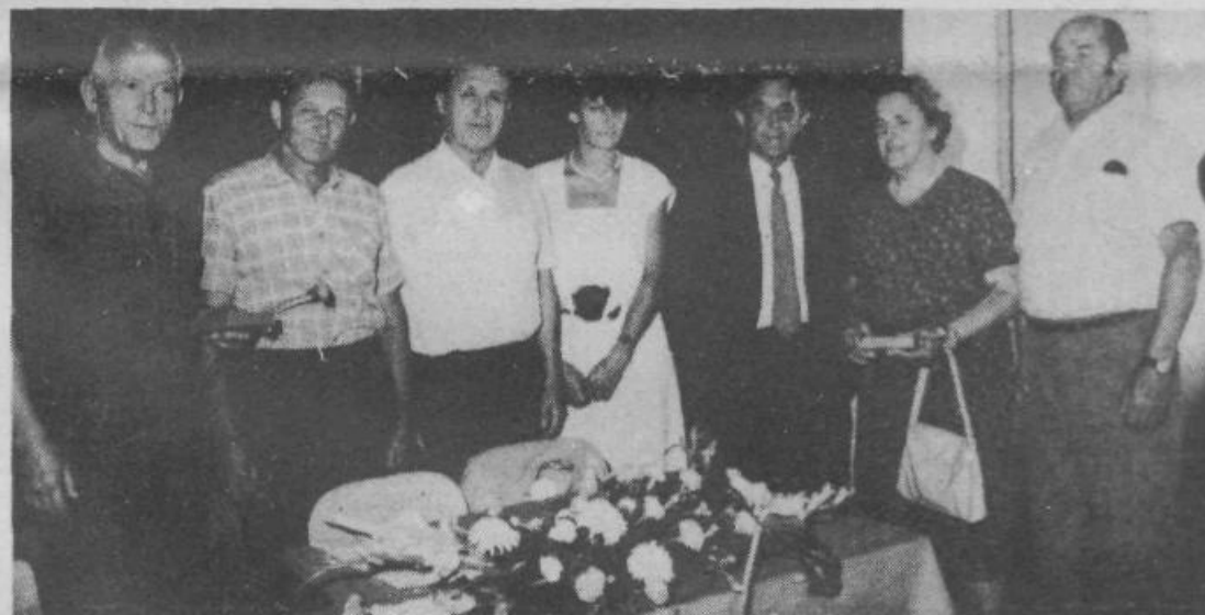
Dobitniki letošnjih plaket OO ZZB NOV Grosuplje

ranje družbenopolitične in družbeno-ekonomske razmere pa opozarjajo in sicer, da se spet zavemo in pokažemo, da smo dostojni potomci svojih prednikov in izbojujemo bitko za stabilizacijo našega gospodarstva in udržitve samoupravnih socialističnih odnosov v naši družbi. Tisti, katerih očetje so vgradili svoja življenja v temelje današnje samoupravne, federativne, socialistične in nevrščene Jugoslavije, še posebej cenimo in se zavedamo revolucionarnih pridobitev NOB, zato hočemo dograjevati našo družbo na ustavnih temeljih in smo se pripravili odločno in brezkompromisno spopasti z vsemi težavami in nakopičenimi protislovji s katerimi se soočamo v tem družbenem trenutku.