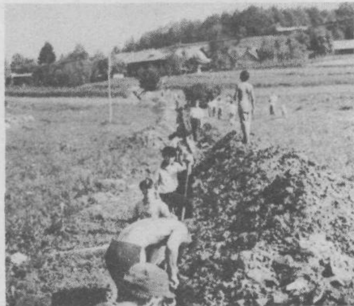
Brigadirji ZMDA »Suha krajina« delajo na Muljavi

Skupščina občine Grosuplje, samoupravne interesne skupnosti in uredništvo Naše skupnosti