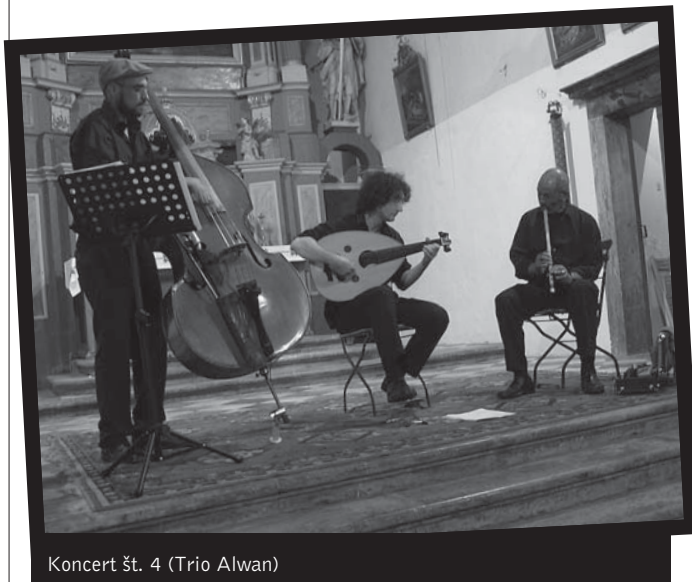
Koncert št. 4 (Trio Alwan)

Ney je podolžna bambusova flavta, sestavljena iz devetih segmentov trsa, darabuka je boben vazaste oblike z eno opno,