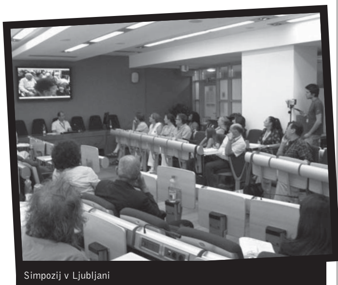
Simpozij v Ljubljani