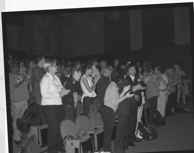
Udeleženci svetovne konference po predstavitvi Slovenije

Menim, da gre za izjemen dogodek za Slovenijo in Slovence, primerljiv z doseženo zlato kolajno na kateremkoli svetovnem prizorišču. Pot do takega zaupanja je tlakovana z leti dokazovanja v znanstveni areni. Največ bo pridobilo slovensko akademsko okolje, v katerega bo v prihodnje prihajalo še več spodbud, svežih idej, gostujočih predavateljev in glasbenikov. Nosilcem novih dolžnosti želim, da bi bili deležni razumevanja in podpore v domačem okolju.