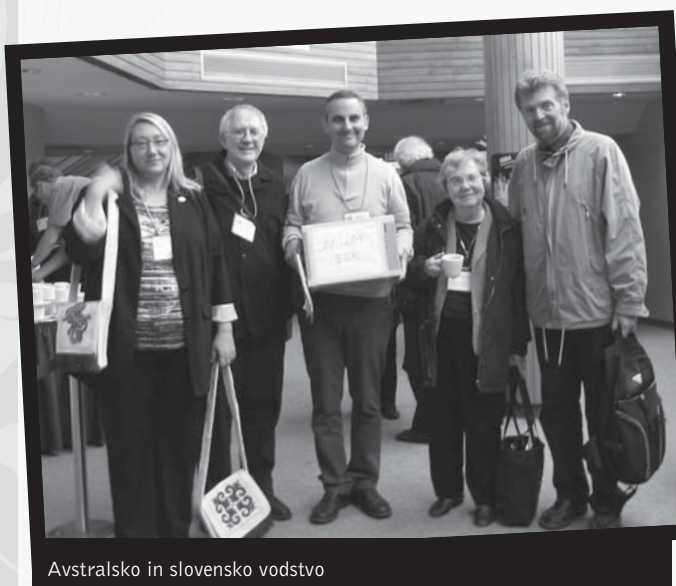
Avstralsko in slovensko vodstvo

Na simpoziju sem uživala v zelo številnih in raznovrstnih prispevkih. Posebno pozornost so, glede na moje lastne znanstvene in izvajalske interese, pritegnili referati o akustični ekologiji, o spremembah obrednih tradicij, o hibridnosti, o glasbi v odnosu do ustvarjanja in reševanja konfliktov ter o medkulturnih perspektivah pevskega izražanja.