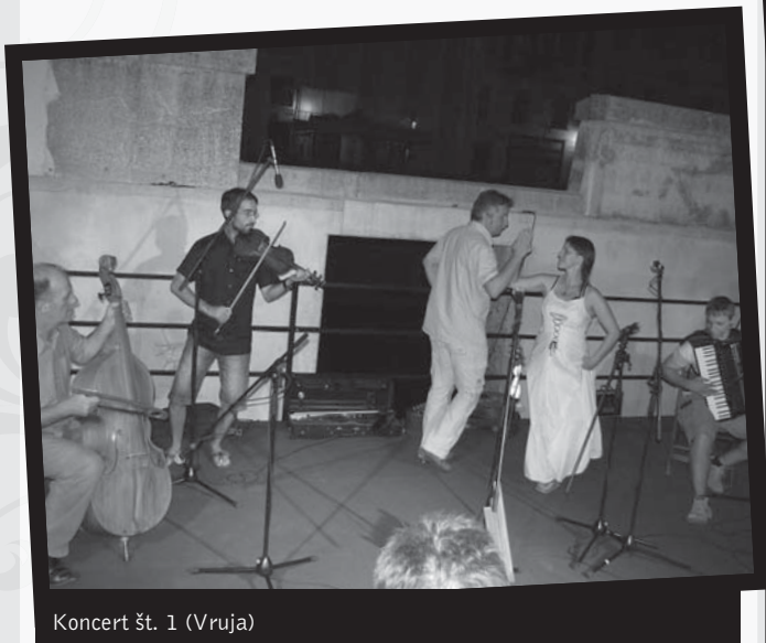
Koncert št. 1 (Vruja)

Pouk glasbenim pedagogom: prizadevajte si za navzočnost slovenske tradicijske glasbe ne kot muzejskega eksponata temveč v vsakdanjem življenju. Kulturno in etnomuzikološko društvo Folk Slovenija vam pri tem lahko pomaga.