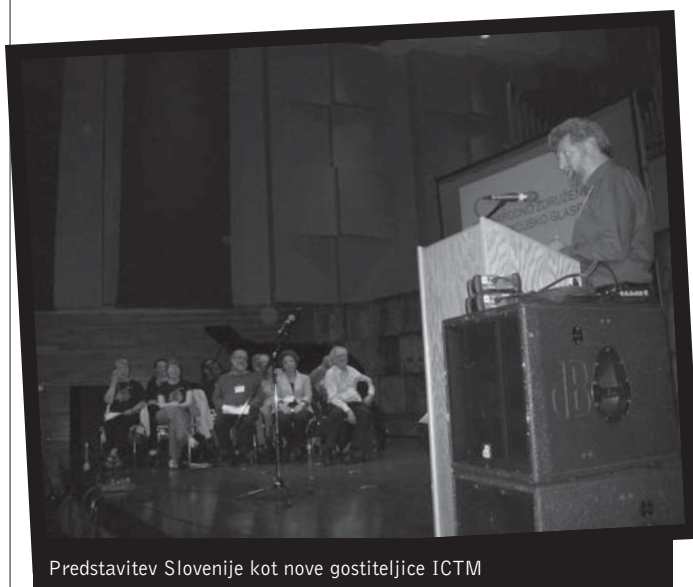
Predstavitve Slovenije kot nove gostiteljice ICTM

Svetovna konferenca v Kanadi vsekakor sodi med velike po obsegu in vrhunske glede na organizacijske razsežnosti. Med več kot tisoč udeleženci, tako znanstveniki kot tudi nastopajočimi glasbeniki na spremljajočem festivalu z naslovom Soundshift , je bilo možno zaznati posameznike in skupine z vsega sveta. Člani upravnega odbora so na rednem sestanku pred konferenco dokončno potrdili kandidaturu Slovenije za novo gostiteljico sekretariata. Fotografije 3-5 zgovorno pričajo o primopredaji dolžnosti pred zborom članov na zaključni ceremoniji.