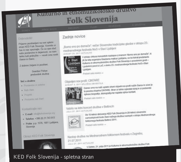
KED Folk Slovenija - spletna stran

Tako si je zagotovilo prepoznavnost v celotnem slovenskem kulturnem prostoru in ustrezno odmevnost v medijih in v strokovni javnosti. Povezuje kvalitetne predstavnike različnih generacij in si skozi kreativne projekte prizadeva biti zgled dobre