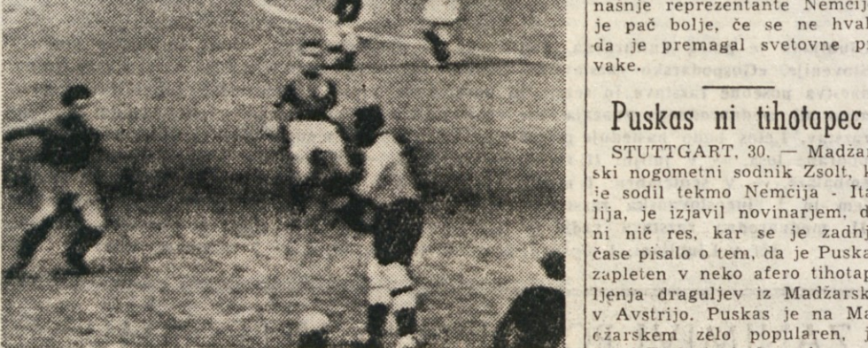
Z večerajšnje tekme v Stuttgartu.