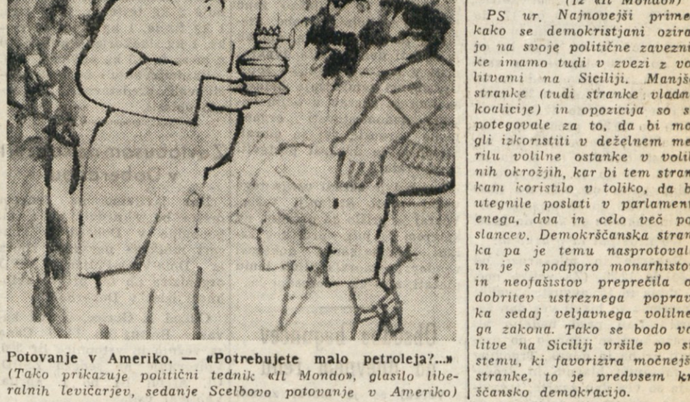
Potovanje v Ameriko. — «Potrebujete malo petroleja?...» (Tako prikazuje politični tehnik «Il Mondo», glasilo liberalnih levicarijev, sedanje Seelbovo potovanje v Ameriko)

Toda, kakor smo že rekli, stvari dozorevajo, kljub vsem rokam in vsem bojaznim. Večno se ne da živeti v nevarni zgradbi smrtnih boleznih ni mogoče ozdraviti z uspavalnimi sredstvi in aspirini. Ostanje vprašanje, do kdaj bo laična sredina prenašala tak položaj, do kdaj se bo Saragat zadovoljeval le v lepih besedah, liberalni ministri s predstavljanjem v vladi stranke, ki so jo industrijski kupili kot trop dirkalnih konj, ki jo vodijo ljudje, katerim ona — industrija — ne zaupa in ne sprejemajo njihovo politično usmerjenosti. Iskreno: De Gasperi jevedla petletja in volilnega izvida, ki ga je zaključil, bi moral prepričati vse, da se s takim ravnanjem doseže le izguba zaupanja. Ponovitev bi bila neodpuščljiva; nihče se ne sme slede glade rezultatov glede prizivnega poskusa.