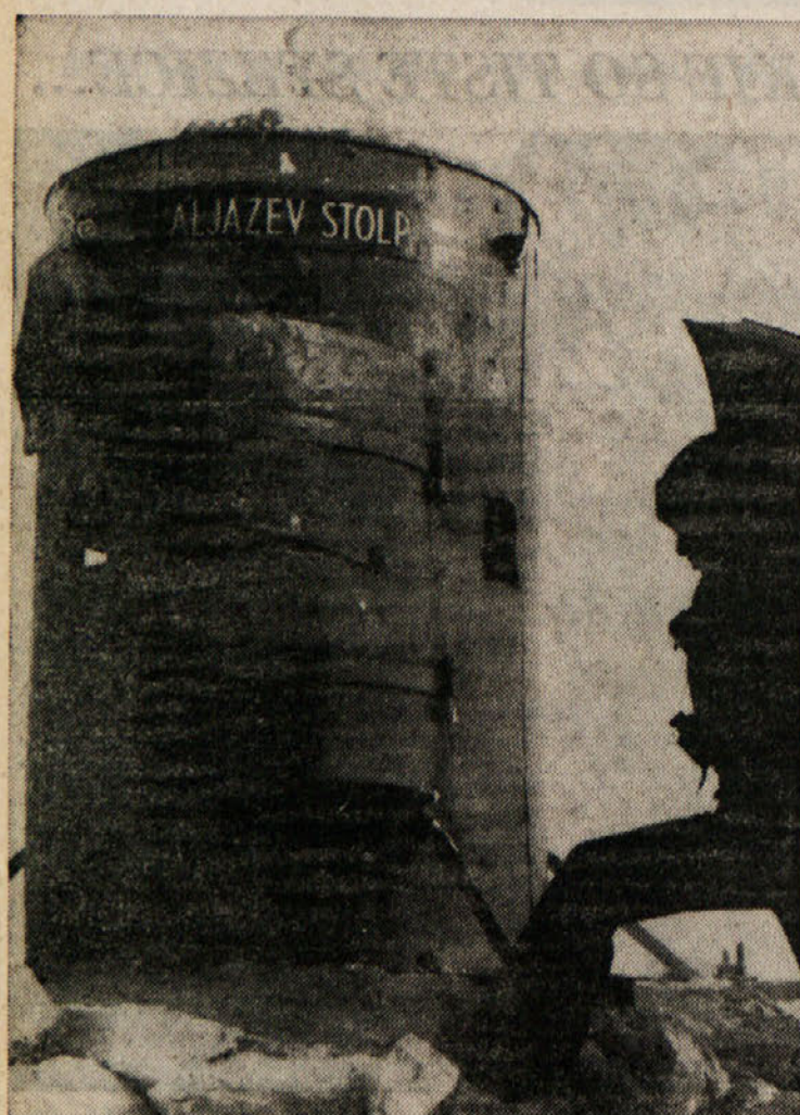
Letos obišče Triglav neverjetno veliko ljudi. Marsikoga ne ustavi niti deževno vreme. Sicer pa se v gorah vreme kaj hitro spreminja in tedaj pride pod Aljaževim stolpom prav tudi preprost dežnik.