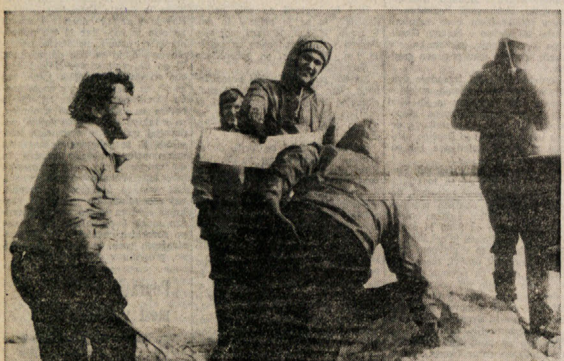
«Planinski krsti je letos vsakdanji dogodek. Posebno ob velikem jubileju, ob dvestoletnici prvega vzpona, pridejo na Triglav tudi mnogi Slovenci, ki se doslej še niso veliko vzpeli na gore.

Da bi ne bilo dvomov, so «štirje srčni možje» vklesali v skalo svoje začetnice. Od tedaj so odpri veliko «smeri» - Triglav ni le zemljepisni pojem, je veliko več