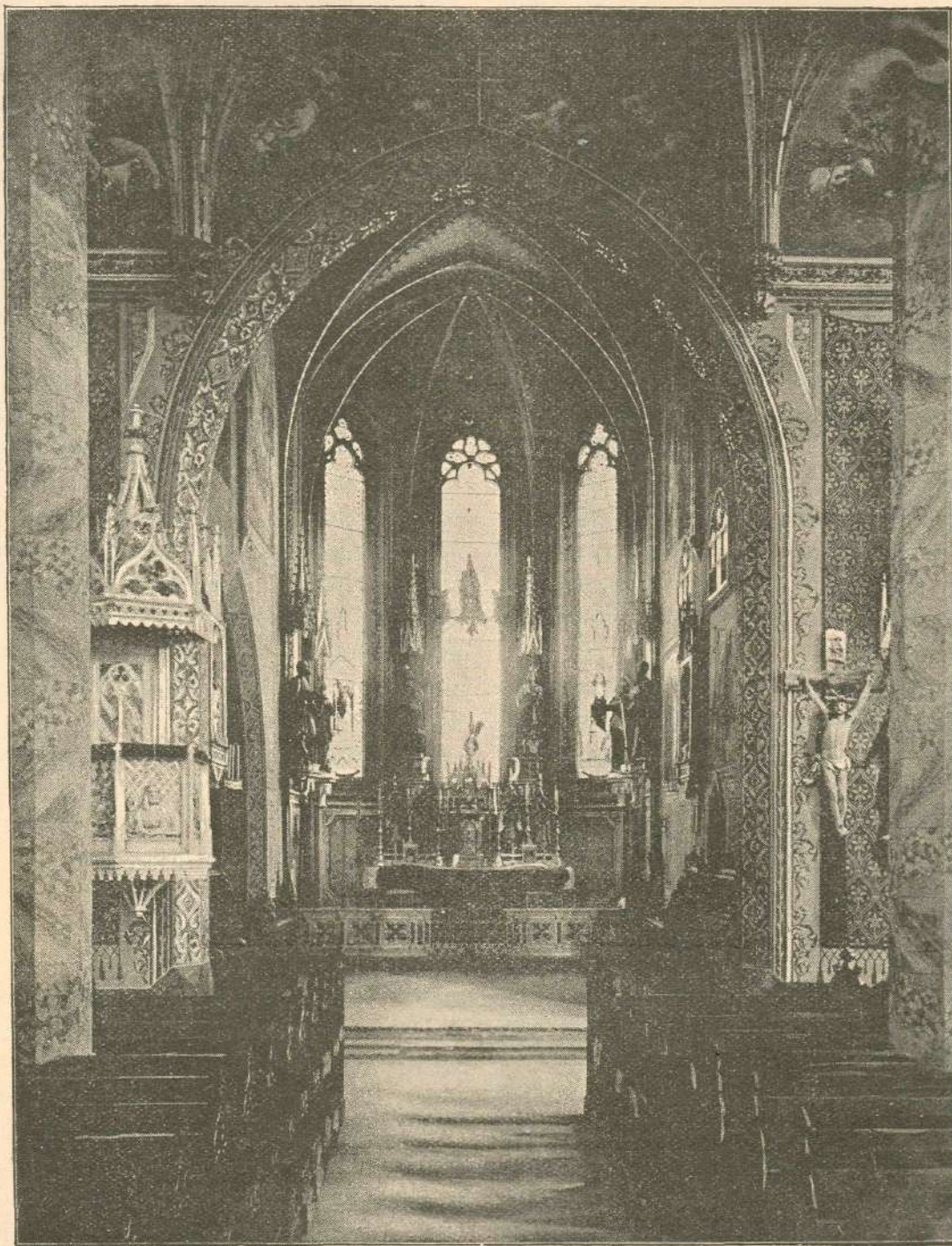
Notranjščina župne cerkve v Kranju.

Zidali so stolp iz rezanega lahkega kamena, katerega so dobivali ob savskih,