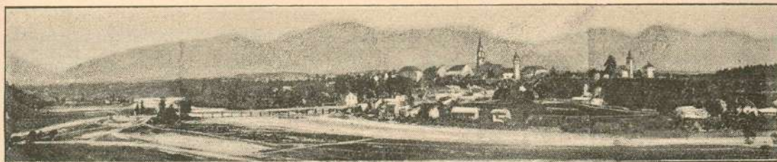
Pogled na Kranj pred železnico (pred l. 1871.).