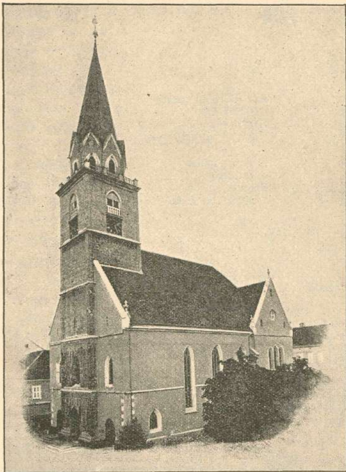
Župna cerkev v Kranju.

Mesec vinotok leta 1892. ostane kranjskim meščanom trajno v spominu. Rožnivenško nedeljo istega leta se je posvetila na novo prenovljena cerkev svetega rožnega venca v mestu. Dne 9. vinotoka lanskega leta pa je obhajal Kranj 400 letnico župne mestne cerkve. Istega dne jo je — vso prenovljeno — zopet posvetil prevzv. gosp. knezoškof ljubljanski in v njej delil zakrament sv. birme.