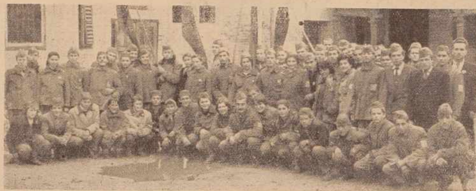
Minulo nedeljo se je vrnila z avtomobilske ceste Paračič-Niš po 20-dnevnem bivanju in delu na trasi tudi trikrat udarna pomurska brigada

Medtem ko v vseh občinah in okrajih vlagajo zadnja leta dober del sredstev za razvoj turizma in gostinstva, je v ljubljanski občini predvidenih za to razmeroma malo sredstev. Doselej je bila v občini edina prilačnejša turistična postojanka v Jeruzalemu, ki je letos pridobila številne izletnike in turiste domala iz vse Slovenije, precej pa jih je prišlo tudi iz sosednje Avstrije. Letos je imelo postojanko v najemu gostinsko podjetje »Jeruzalem«. Podjetje je tekom leta investiralo precej sredstev za ureditev prostorov ter dopolnitev osnovnih sredstev in inventarja. Spričo pomanjkanja potrebnih finančnih sredstev za prevzem postojanke je namestnik podjetja postojanko opustiti. Ker so se za prevzem obrata že začeli zanimati v sosednjih okrajih, se je občinski ljudski odbor v Ljutomeru odločil, da bo skušal gostinskemu podjetju »Jeruzalem« zagotoviti potrebna investicijska sredstva za prevzem obrata od Vinogradniškega gospodarstva Jeruzalem-Ormož. Za to bo potrebnih okrog 20 milijonov dinarjev investicij.