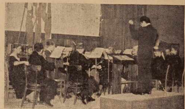
Orkester soboške »Svobode« na svečani akademiji v čast Dneva republike