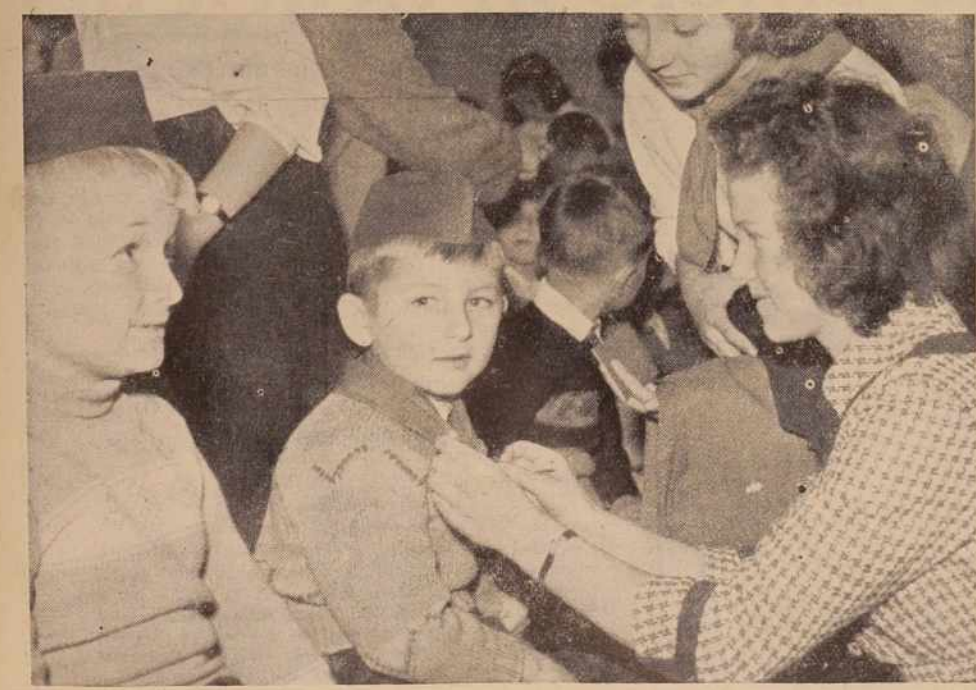
S sprejema cicibanov v pionirsko organizacijo v M. Soboti