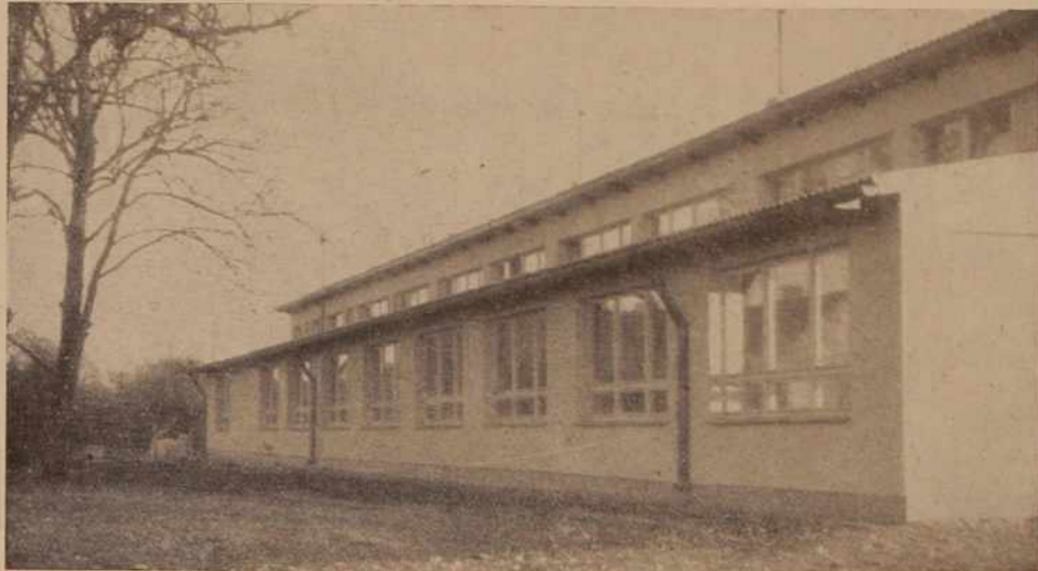
Posnetek šole v Bakovcih

Minuli petek je kot tretjo premiero te sezone v Ljutomeru gledališče »August Cesarec« iz Varaždina uprizorilo delo Avgusta Cesarca »Siromakova izpoved«. Več razlogov je, da lahko označimo tudi to gostovanje kot prijeten dogodek v gledališkem življenju Pomurja. Predvsem je potrebno poudariti, da je bil dramski večer nevsakdanja, dostojna proslavitev rojstnega dneva naše republike. O tem dogodku je pred nastopom