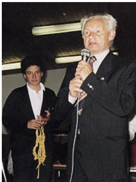
Spomin na leto 1989 - gost tekmovanja je bil legendarni Jaka Čop

Tekmovanje Mladina in gore je ekipno tekmovanje, ki zahteva duh 4-članske ekipe,