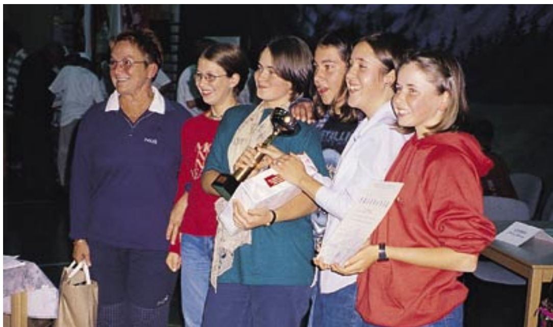
Uspelo nam je! (člani MO PD Ljubljana Matica v Braslovčah, 2000)

tisto znanje, ki bo vsakemu planincu venomer koristilo. V njem so skrita znanja o zgodovini, organizaciji, varstvu narave, živalskem in rastlinskem svetu, orientaciji, prvi pomoči, prehrani, gibanju v gorah, nevarnostih, vremenoslovju in tudi o gorski reševalni službi. Tematski del pa je raznovrsten. Sodelujoči so tako spoznavali Pohorje, Haloze, Trnovski gozd, Kras, hribovje osrednje Slovenije in Savinjske doline ter gore Kamniško-Savinjskih Alp. Svoje mesto je našla tudi narava s temami o Triglavskem narodnem parku in spoznavanju in varstvu narave. Nikdar ni bila pozabljena zgodovina, tako slovenskega gorništvaja kot tudi alpinizma in Gorske reševalne službe ter Turistovskega kluba Skala. V Trzinu pa so se mladi tekmovalci potili tudi ob spoznavanju gorniške literature.