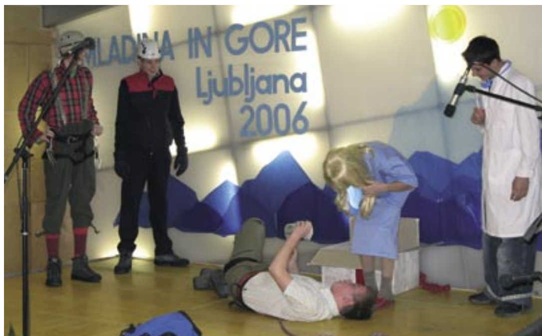
Utrinek iz uvodne predstavitve