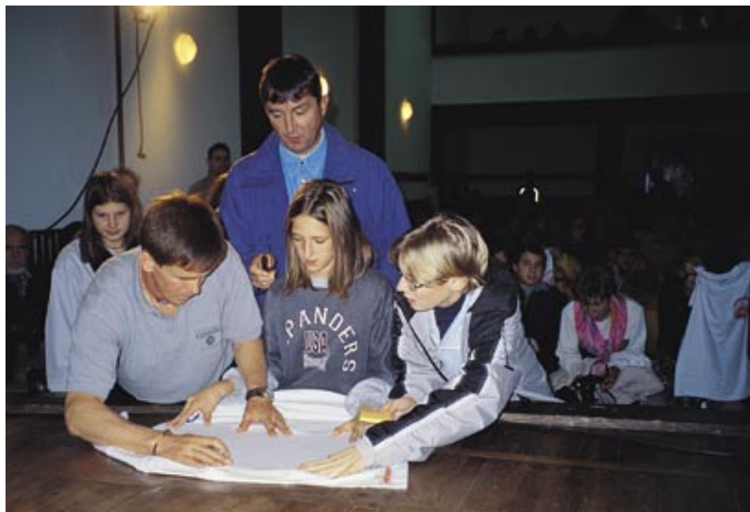
Mlade planince znani gosti vedno zelo pritegnejo (Davo Karničar v Braslovčah)