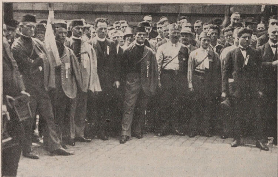
Slovenski Orli v Kölnu.

3. Tekme so bile glavni del prireditve in so imele zelo obširen obseg. Za lahko atletiko je bilo priglašanih 1150, za plavanje 374 in za stafetno plavanje 66, za deseterboj 81, za dvanajsterboj 210, za peterboj 47 in za deveterboj 213 tekmovalcev. Inozemci so smeli tekmovati samo v dvanajsterboju in v lahki atletiki, tekmovalnih vrst je bilo 23, inozemske tri. Poleg tega so bile še tekme v »igrah na trati«, t. j. v nogometu in raznih drugih igrah z žogo. Kljub ogromni udeležbi tekmovalcev so se tekme izvršile brezhibno po sporedu. Priznati moramo, da so Nemci mojstri v organizaciji tekem. Nobene resne pritožbe ni bilo slišati. Sodniki so bili deloma člani DJK, po večini pa so bili vzeti iz bolj nevtralne telovadne organizacije »Deutsche Turnerschaft« (nemško telovadništvo). Razmerje med obema organizacijama je strpljivo in tovariško. Ko gre za skupne cilje, druga drugo podpirata. Včasih pač pride krajevno kje ali tudi v njihovih glasilih do kakega spora ali prerekanja. Globjega nasprotstva pa ni.