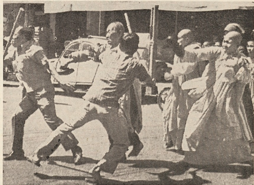
Skupina budističnih nun je v ponedeljek izvedla sedečo stavko, s tem da so se vsedle na najprometnejši cesti Saigona. Nune so hotele s tem pokazati nezadovoljstvo nad politiko saigonske vlade in Američanov, češ da se ne držijo pogodbe, ki je bila sklenjena glede Vietnama v Parizu. Pri demonstraciji so bile štiri nune težje ranjene.