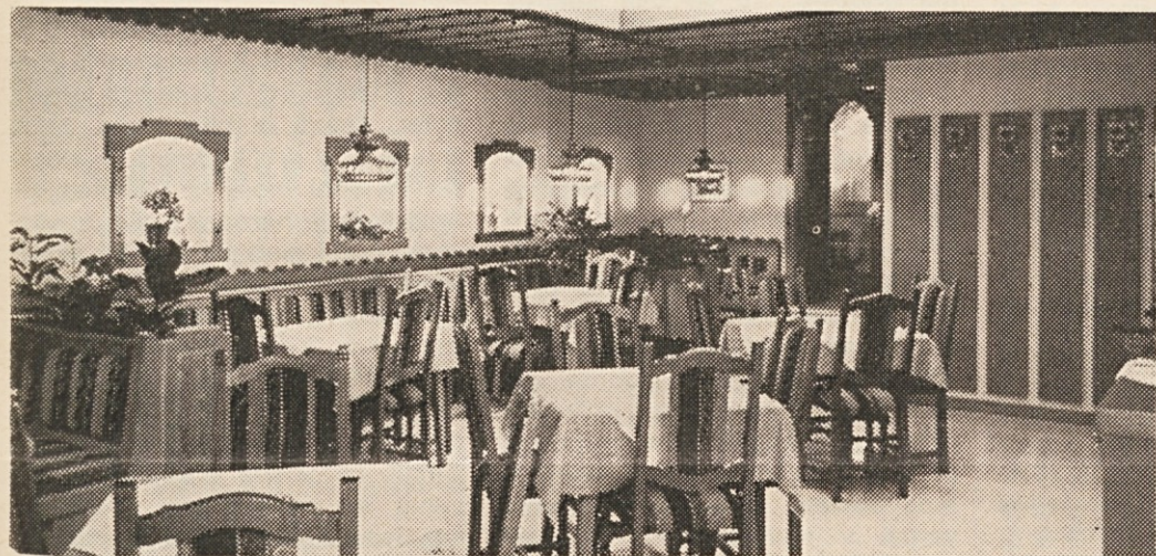
Strokovno dovršenost, čut za lepoto in umetnost združuje gostinska oprema, ki jo je izdelalo znano mizarsko podjetje Wuntschek. Posebej znano je z umetniškimi čutom izdelano in izrezljano pohištvo iz pod roke mojstra, ki si je svoje bogate izkušnje zbral celo v Ameriki.