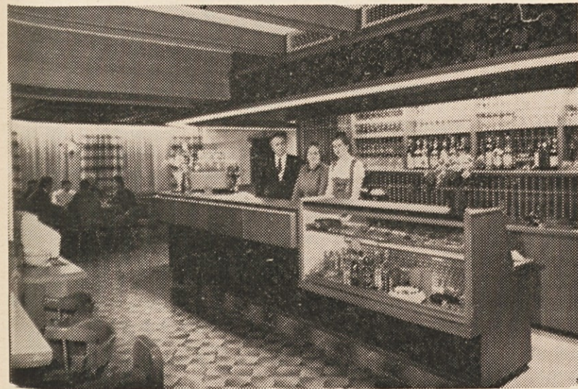
Gostinjska soba dokazuje dovršenost mizarskih del, tako teke kot edinstvena lepa izdelava lesenega stropa, vse to je strokovno izdelalo mizarsko podjetje Hermann Kuschej v Pliberku.