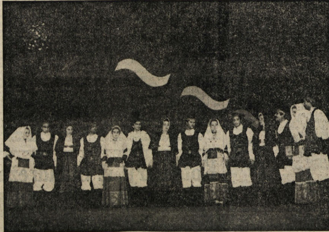
Skupina «Campidano» s Sardinije