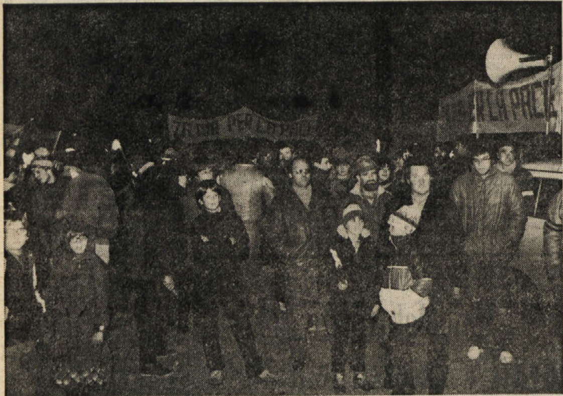
Z množične manifestacije za mir in razorožitev na Krasu