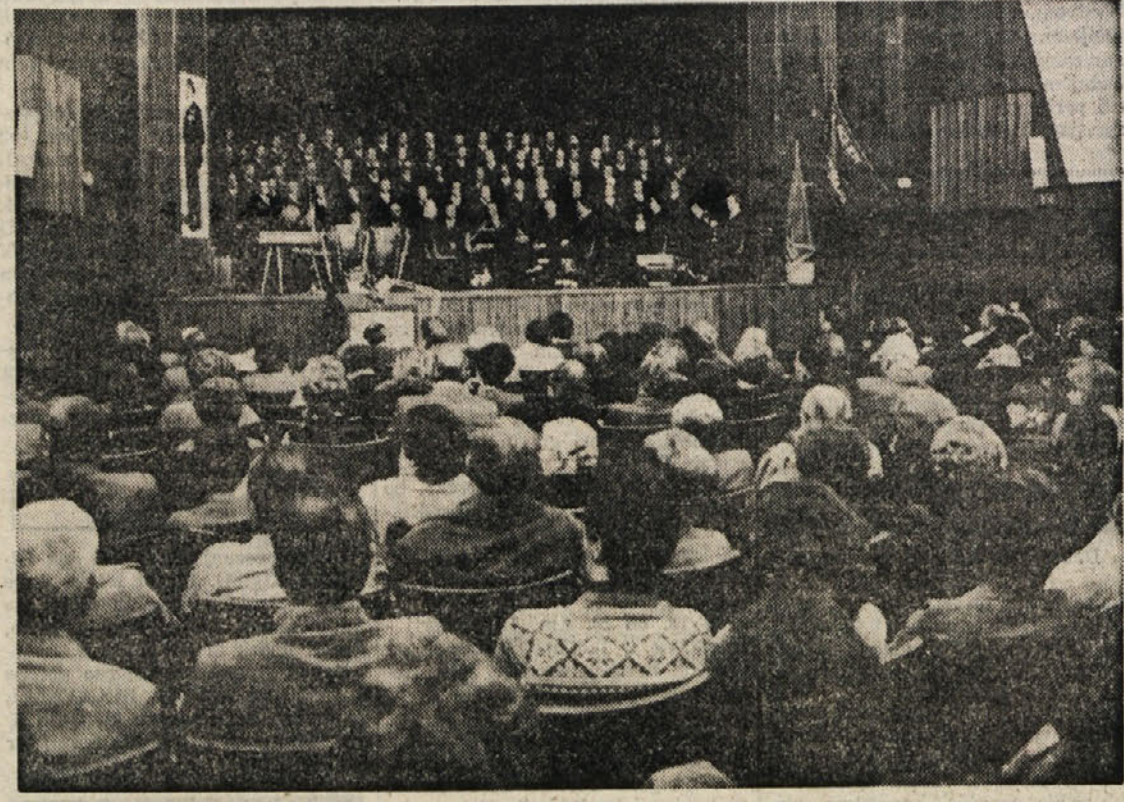
Proslava oktobrske revolucije v gledališču «F. Prešernu», ki jo je priredila sekcija KPI dolinske občine