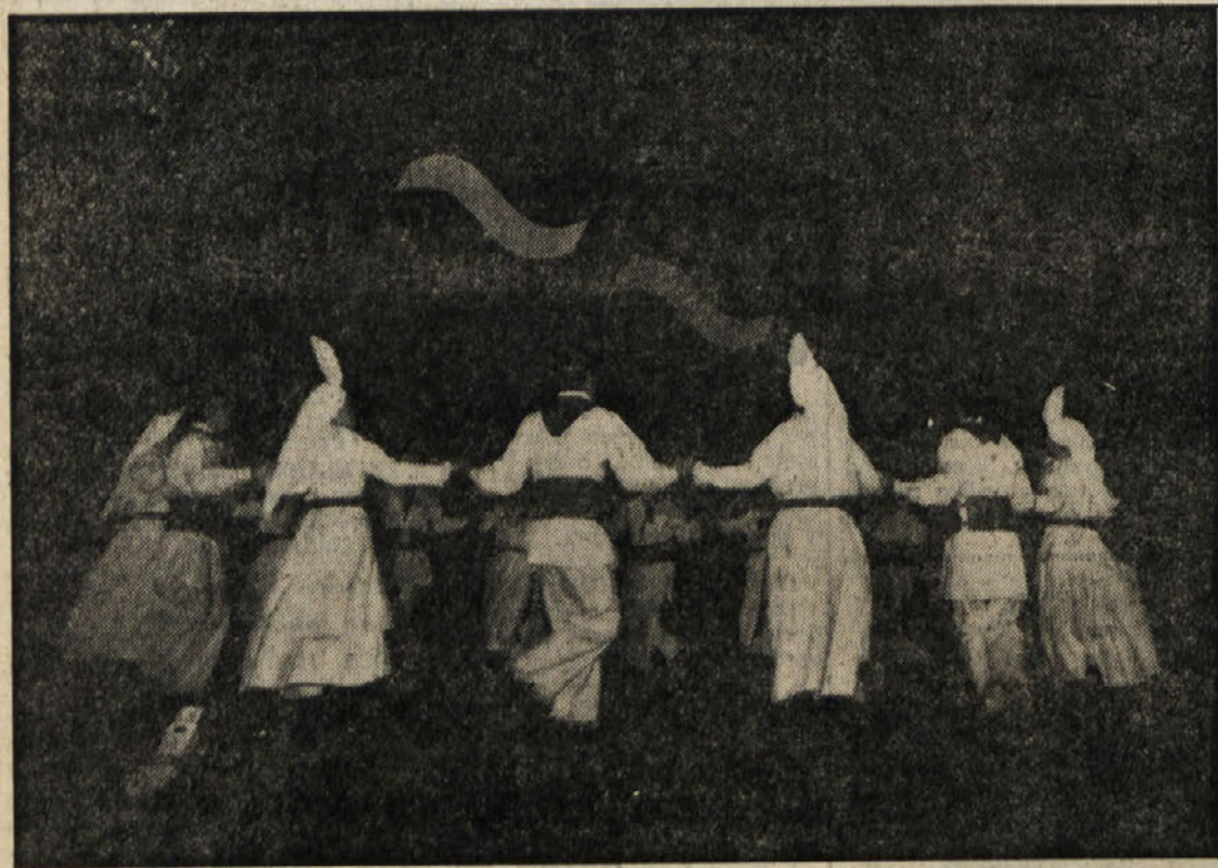
Skupina «Zeleni Jurij» iz Črnomlja