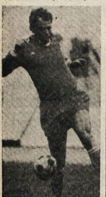
Brez Bettege Juventus izgubil