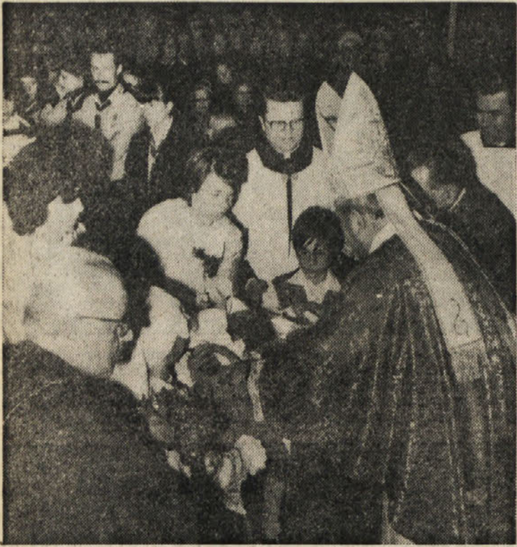
Po devetdesetih letih je bila prvič slovenska maša pri Sv. Justu, ki jo je daroval tržaški škof Lovrenc Belloni