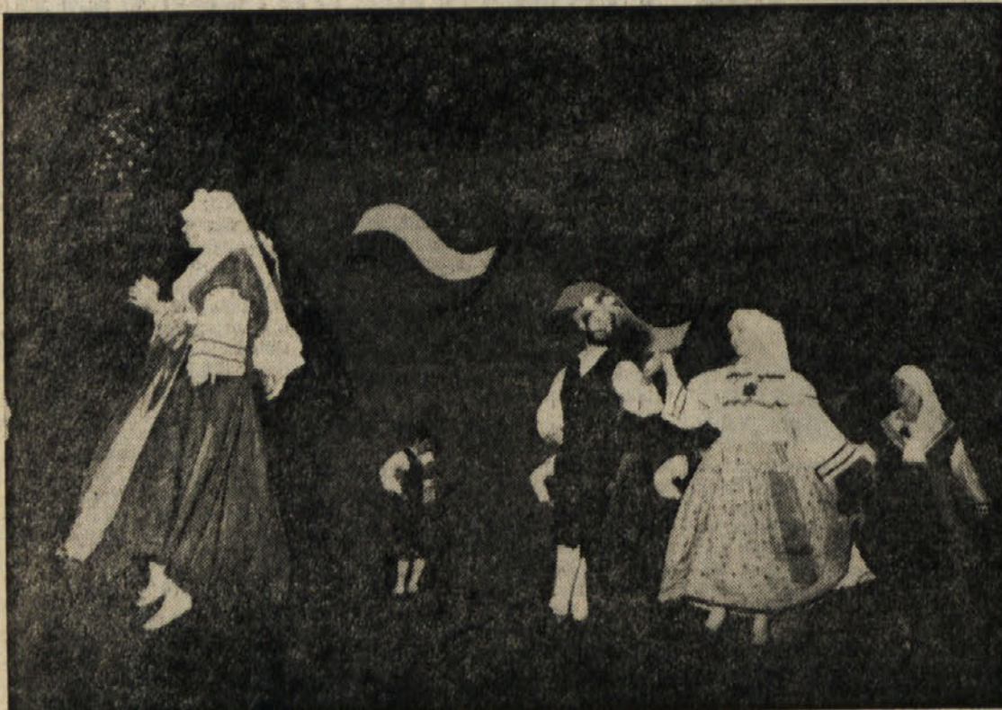
TFS «Stu ledi» iz Trsta