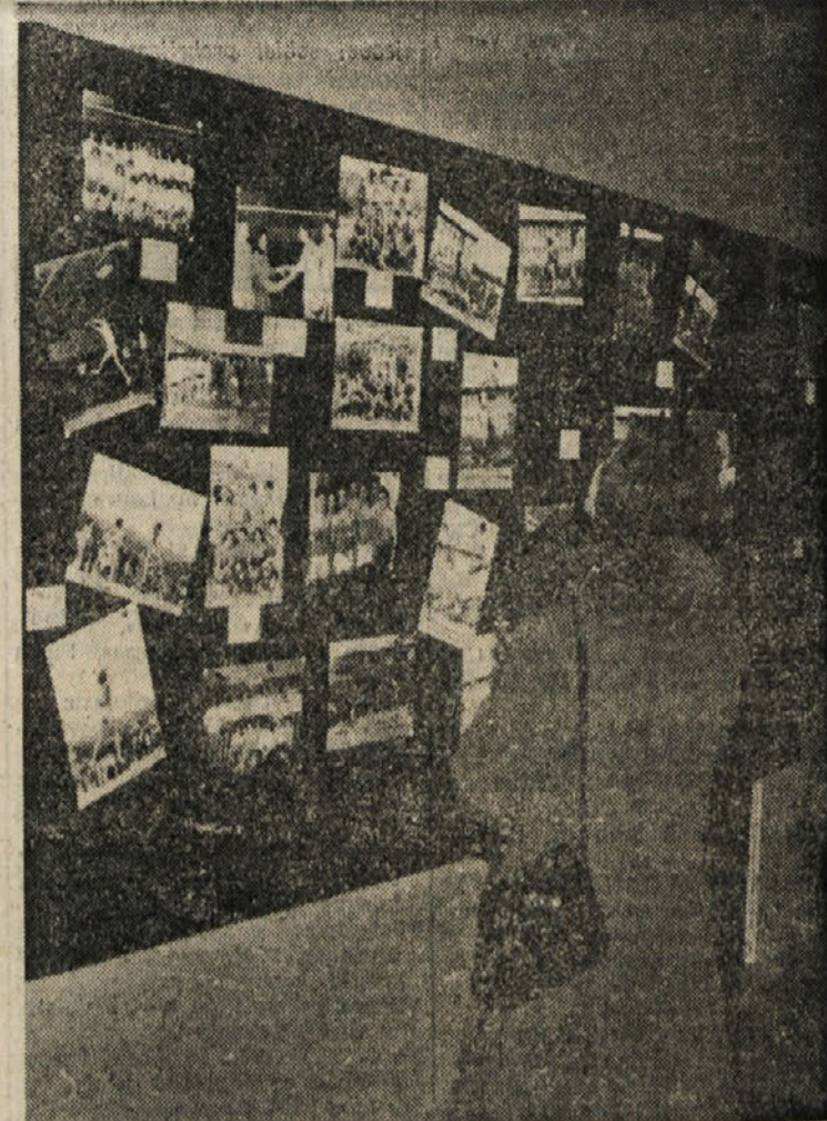
Razstava fotografij na stadionu «1. maja» ob 20-letnici odbojcarske sekcije SZ Bor