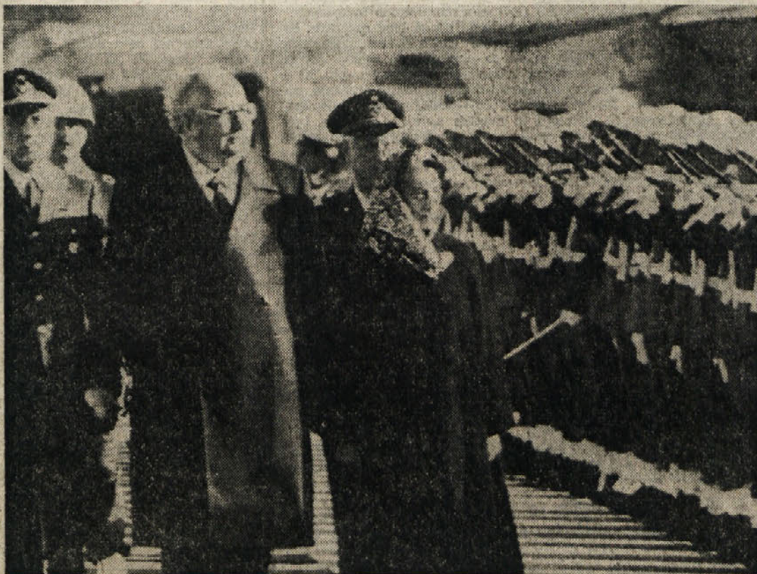
Predsednica indijske vlade Indira Gandhi ob prihodu v Rim

Prvi uradni pogovor s Spadolinijem in Colombom - Gandhijeva sprejel tudi papež