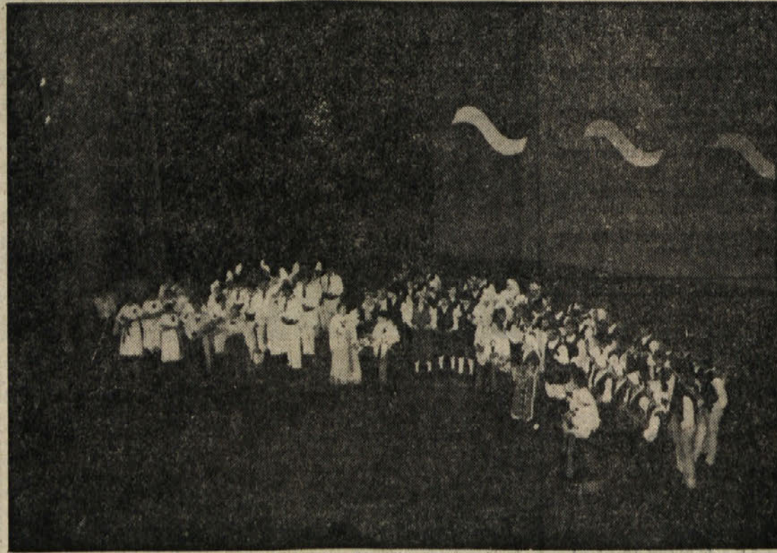
Skupinska slika vseh nastopajočih