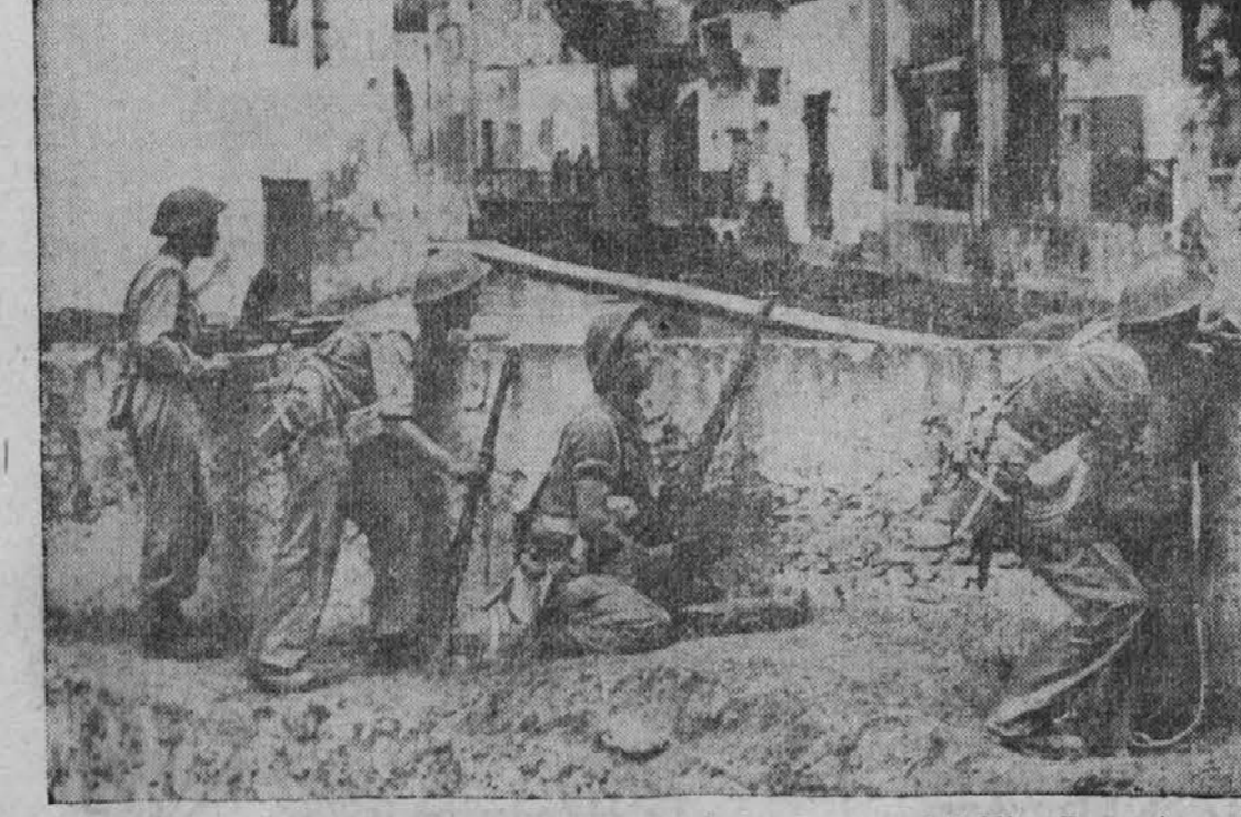
Britski vojaki se previdno pomikajo naprej ob reki v Seafati blizu Pompejev v Italiji, kjer je v raznih poslopih še vedno skrutih precej nemških vojakov, ki se trdovratno upirajo napredujočim angleškim četam.