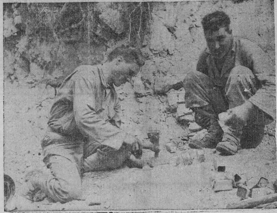
To ni nobeno igrackanje. — Izgleda kot bi se tu dva vojaka igrala, ampak to so precej nevarne igracke, razbijat namreč dinamit v manjše koščke, katere bodo rabili pri gradnji cest v krajih, kjer so jih Nemci razdejali, da tako ovirajo napredovanje zaveznikov.

DELO DOBIJO Moške in ženske splošna tovarniška dela se potrebuje za 6 dni v tednu 48 ur dela na teden Plača za ZAČETEK Moški 77½c na uro Ženske 62½c na uro Morate imeti izkazilo državljanstva. Nobena starost ni omejena, ako ste fizično sposobni opravljati delo, ki ga nudimo. Zglasite se na Employment Office 1256 W. 74. St. National Carbon Co., Inc. (264) OSKRBNICE Foln čas 5:10 popoldne do 1:40 jutraj. Šest noči v tednu. V MESTU— 750 Huron Rd. ali 700 Prospect Ave. Plača $31.20 na teden. DELNI ČAS— 1424 Argonne Rd., South Euclid, O. Tri ure na dan, 6 dni na teden. Plača $9.90 na teden. DELNI ČAS— 1588 Wayne Rd., Rocky River. Tri ure na dan, 6 dni v tednu. Plača $9.90 na teden. Ako ste zdaj zaposleni pri vojnem delu, se ne prihlasite. Employment Office odprt od 8 jutraj do 5 popoldne vsak dan, razen v nedeljo. Zahteva se dokaz o državljanstvu. The Ohio Bell Telephone Co 700 Prospect Ave., Soba 901 (262) ZA VSA DELA V RESTAVRACIJI Predznanje ni potrebno. Preiščite to priliko. Zglasite se pri Fred Schillforth CLEVELAND PNEUMATIC AEROL, INC. 20001 Euclid Ave. (260) Delo dobi Ženska, ki bi skrbela bolnika; dobra plača. Za informacije pokličite POTomac 7834. (x)