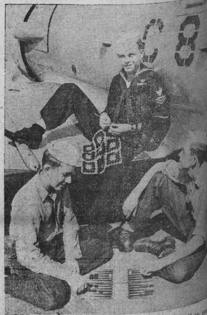
Vsak po svoje si krajsa čas. — Na sliki vidimo . . . narje, ki si vsak po svoje krajsa čas. Eden izmed . . . jev ima v delu lepo venenino, katero bo postal svoji . . . gi za božično darilo.