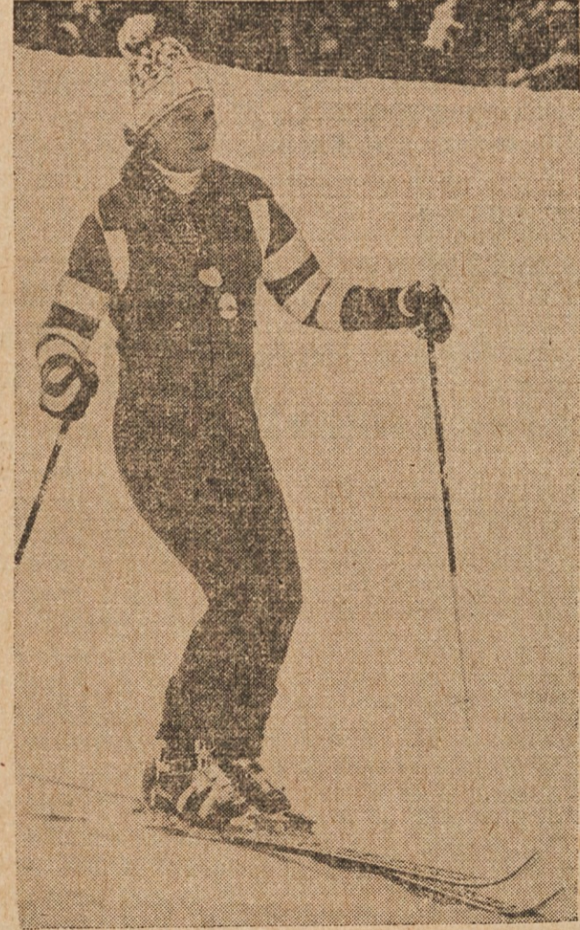
SMUČARSKÉ POČITNICE — Susan Ford na smučeh tekom počitnic v Vail, Colo. Predsednikova hčerka je počitnice skrajšala in se podala s starši na volivno kampanjo v New Hampshire.