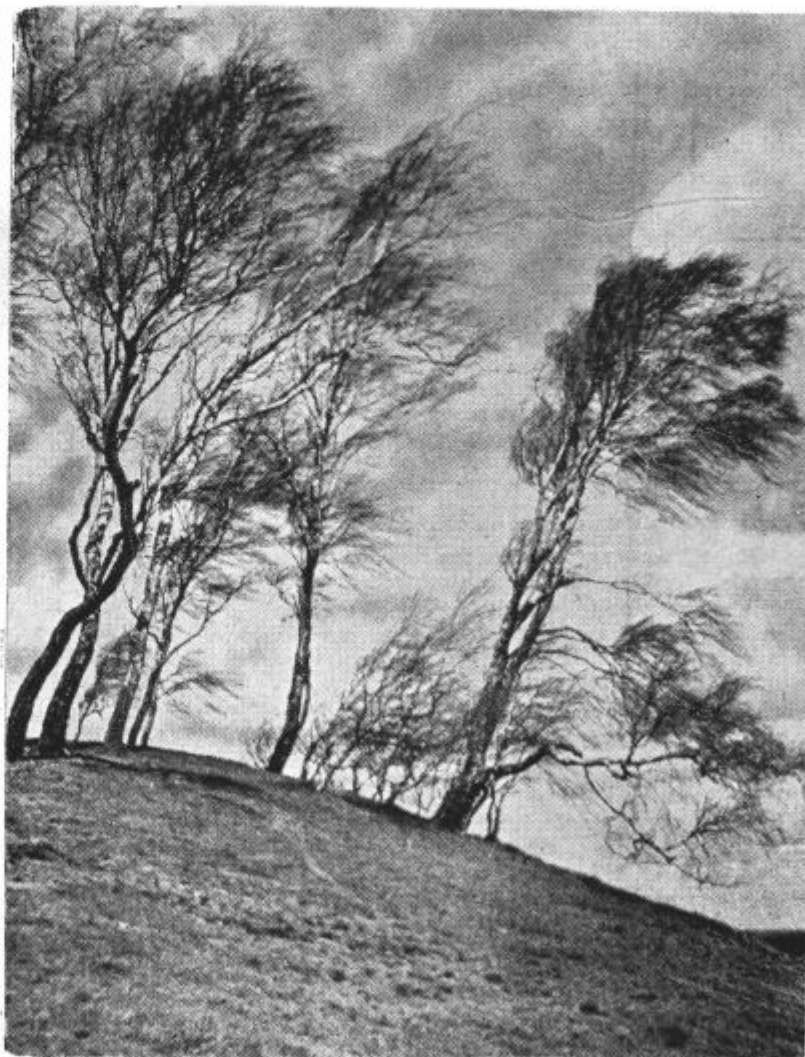
Motiv z brezami

TEDNIK ZA RADIOFONIJO GLASILO SLOVENSКИH POSLUŠALCEV