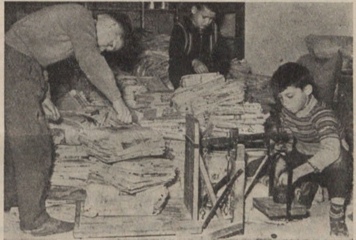
Tehtanje nabranega papirja je šlo pionirjem hitro od rok

ali vozili papir, smo se poslužili še zadnjega sredstva in sicer konja. Nekaj nas je šlo z vozom po cementne vreče. Te vreče smo nabrali in pripeljali v šolo v močnem dežju. Nabrali smo 822 kg papirja v enem samem popoldnevu. Poželi