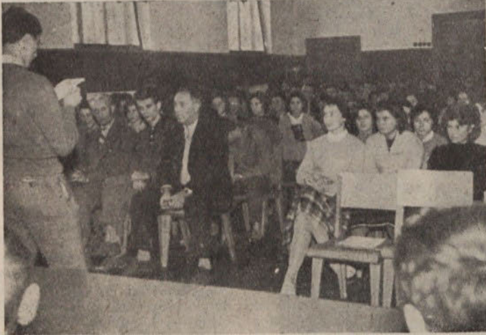
Letošnji sprejem v mladinsko organizacijo

Do sedaj smo imeli že predavanja o Indoneziji, kjer so nam naši črni tovariši v angleščini govorili o problemih svoje dežele. Mimo tega smo ob tej priliki spoznali tudi kako nujno je, da se učiš tega in tudi drugih tujih jezikov.