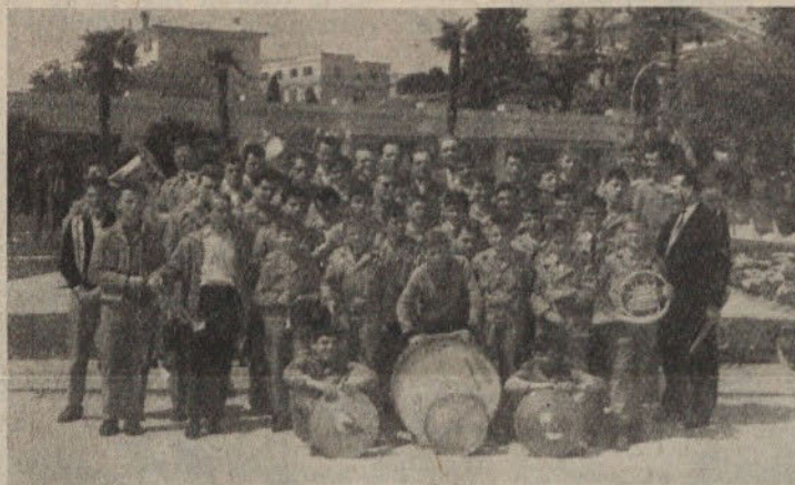
Izlet na Slovensko obalo je bil za člane mladinske godbe nepozabno doživetje

Poslovil sem se. Za menoj pa so odmevali zvoki koračnice Na juriš! — vaja se je nadaljevala s pesmijo, ki obeta, da bo godba z vztrajnim delom uspela v svojih željah, načrtih in namenih.