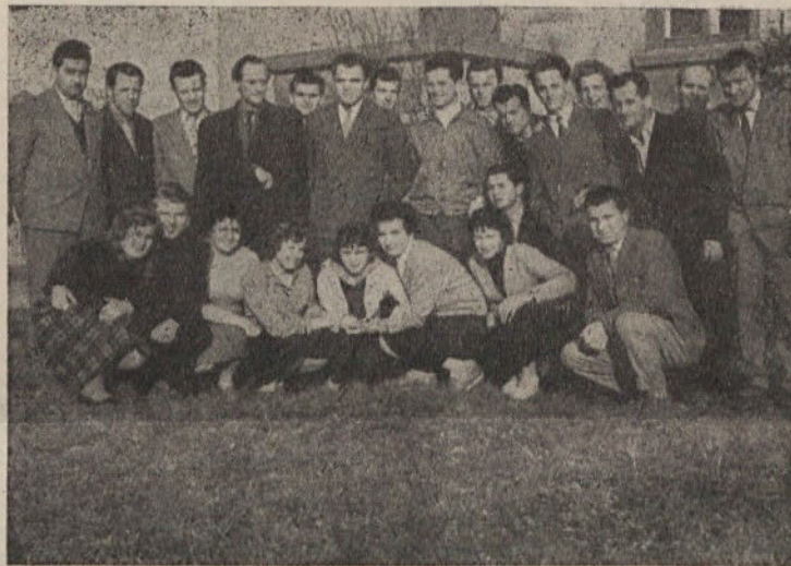
Lanskoletni udeleženci večerne politične šole

Za uspehe, ki jih je imela šola do sedaj, gre zasluga predvsem predavateljem, ki so poleg svoje redne službe vedno našli še toliko časa, da so s kvalitetnimi predavanji in izkušenimi pedagoškimi metodami omogočili slušateljem, da so si v kratkem času pridobili zanesljivo znanje. Nadalje gre zasluga tudi