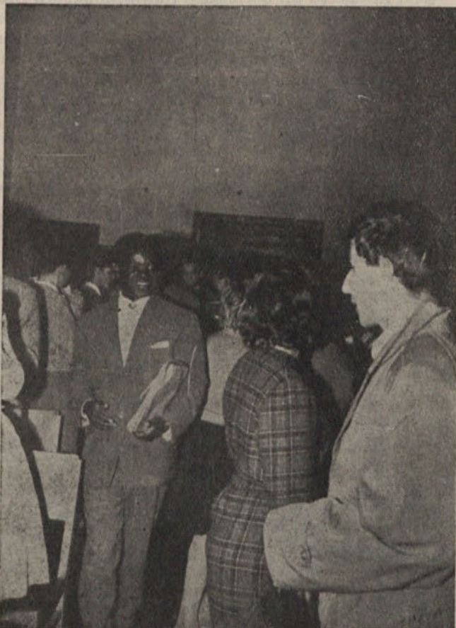
Posnetek s predavanj Mladinskega kluba za OZN