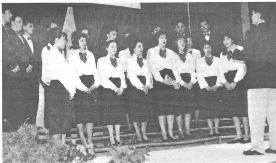
KULTURNI VEČER NA DOBROVI

Če bi radi slišali stare slovenske pesmi tudi vi, povabite Vasovalce. Radi vam jih bodo zapeli.