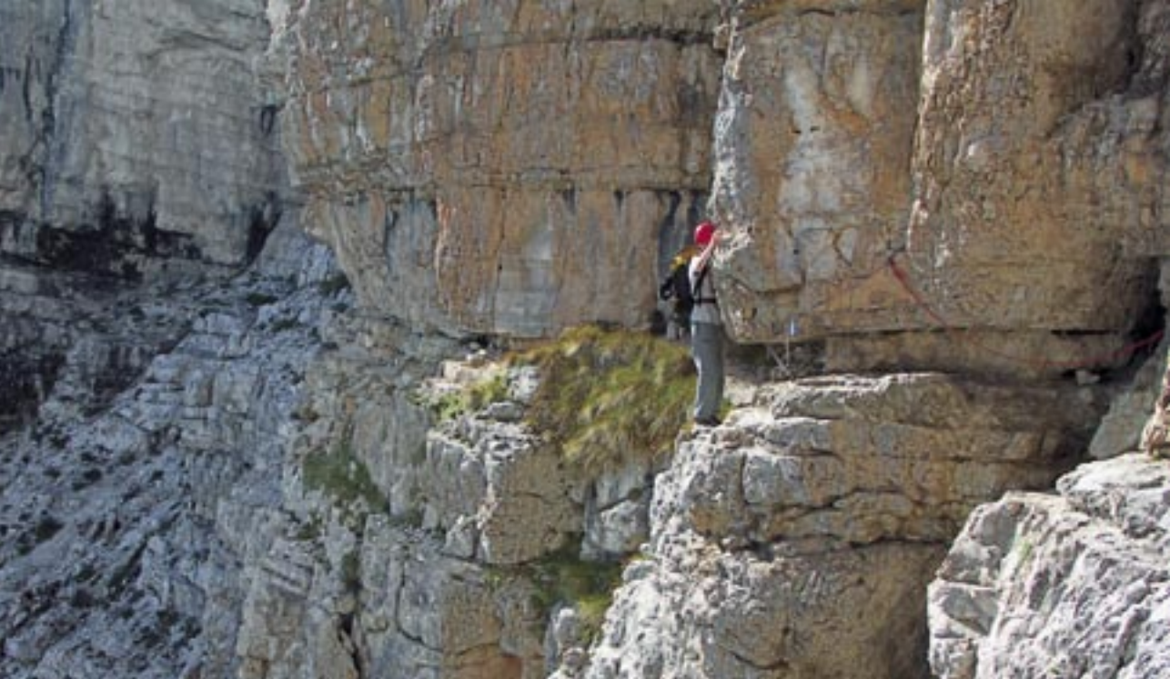
Ozka in izpostavljena Ballova polica

saj je bil Pelmo prva izmed dotlej »nedostopnih« gora, na katero je stopila človeška noga. Ballu je v velikem slogu sledil Avstrijec Paul Grohmann, ki se je med drugim prvi povzpel na Antelao, Marmolado, Sorapiss, Sassolungo in Veliko Cino.