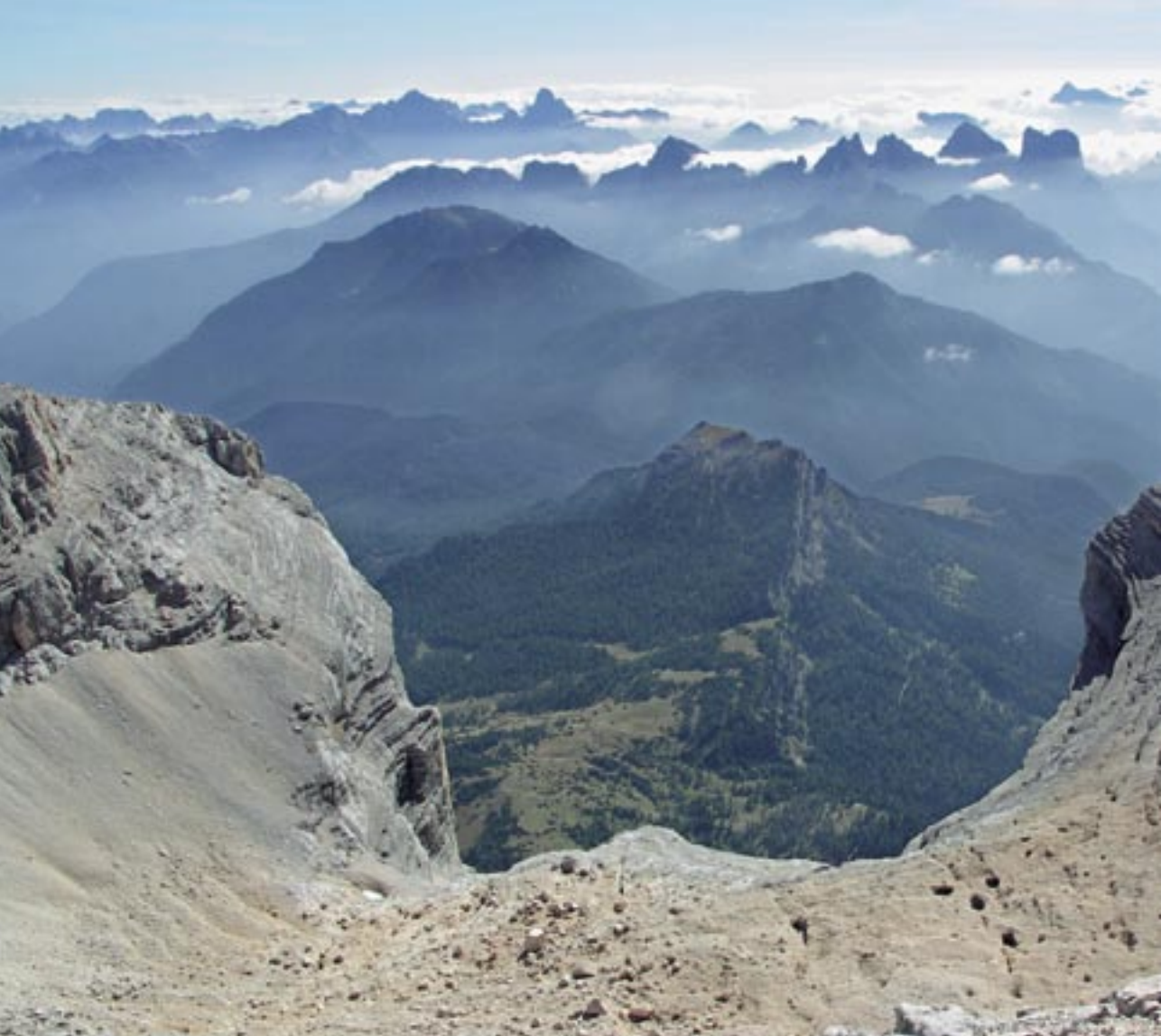
Pogled z vrha v veliko krnico skozi katero poteka vzpon.