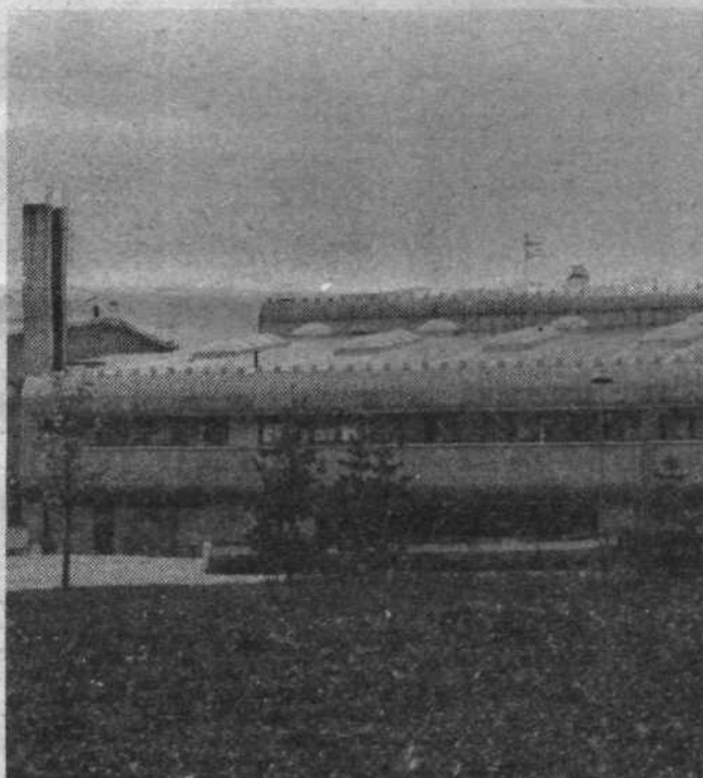
Osnovna šola na Črnučah, zgrajena z drugim samoprispevkom.