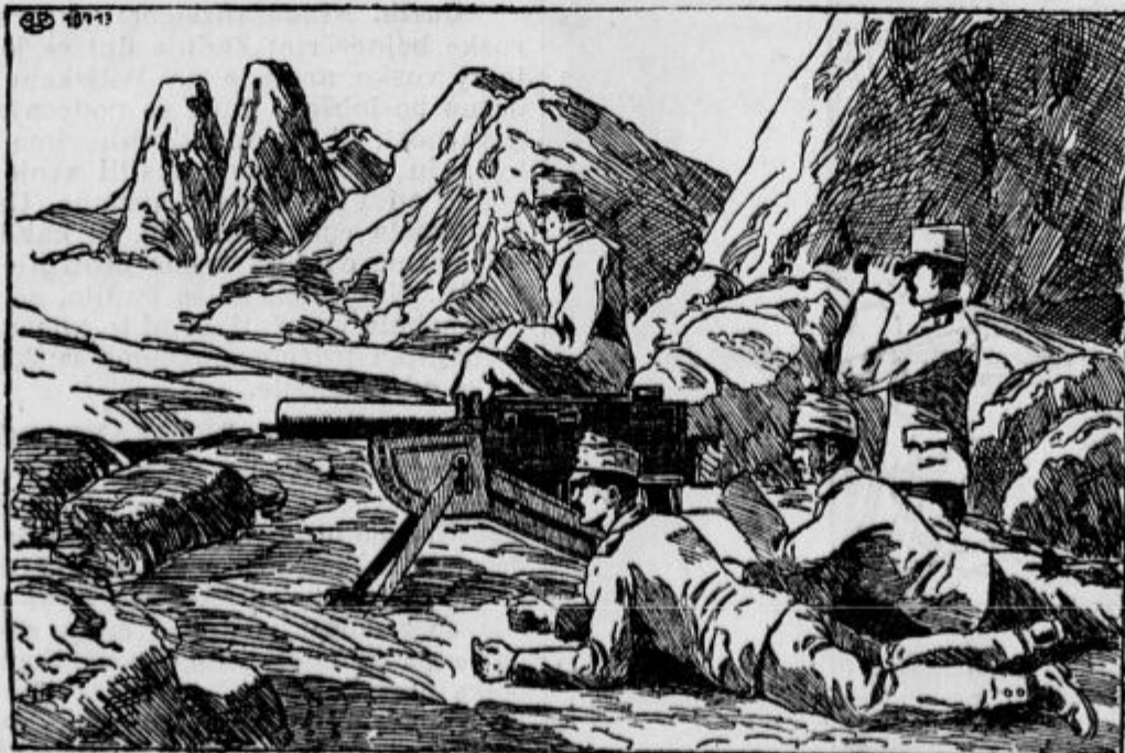
Oddelek avstrijskih strojnih pušk na Krnu.

— Čreslo. Čreslo je doseglo nena- vadno visoke cene. In vendar bi se to la- ko dobilo če bi se t a k o j naročilo vsem gospodariem, da priskrbi vsak kmet ne-