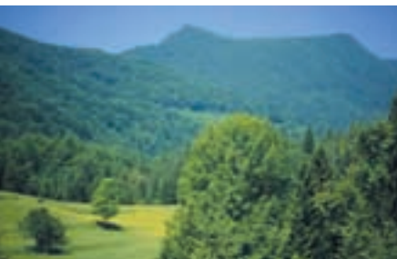
Krempa