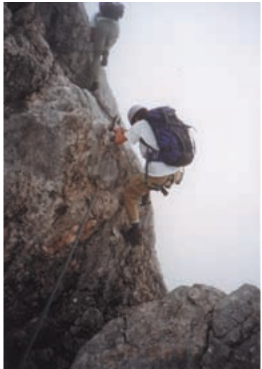
Ob navpičnih jeklenicah čez Johanna

Za nas, hribovce, so veliko zanimivejša južna ostenja osrednje skupine, ki tvorijo markantno skalno pregrado nad turističnim krajem Ramsau. Čeznjo so speljane številne plezalne smeri, gondolska žičnica ter dve zavarovani plezalni poti. Morda je ena od pomanjklivosti Dachsteina ravno preobljudenost, saj mu obiskovalcev vseh vrst ne manjka. V osrednjem delu bomo težko našli kotic, kjer bi se počutili, kot da smo nekje v gorski samoti.