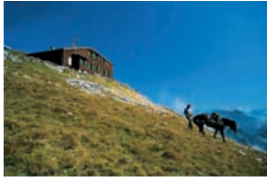
Prešernova kočica na Stolu

V tem trenutku se še ne zaveda, da je napravil eno največjih napak v svojem življenju: desetletnemu otroku je dovolil, da jo ubere po svoje na samotni gori na višini skoraj 2200 metrov. Tudi intuicija ga zapusti, saj v sinovem predlogu ne zasluži kakšne nevarnosti, spregleda pa tudi bližnjo spremembo vremena.