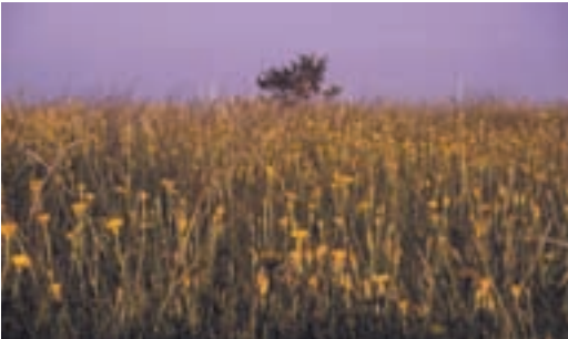
Travniki Čičarije

klost. Po pripovedi domačina je od nekdanjih 150 krav in številnih čred drobnice v hlevih le še troje krav. Mnoga ledinska imena pašnikov in košenic bodo šla v pozabo, saj domačini tam nimajo več kaj opraviti. Pa bi bilo prav, če bi ostala zapisana poleg katastra, tudi v zemljevidih, kajti z imeni ohranja pokrajina neko dodatno, pripovedno in etnično vsebino. Po čičarski planoti so bili pašniki Zaklanci, Za Lipnikom, V Glavnjaku, V Cimberah, Strugi, Pahljači, Na Kavčičah. Kako se izvirnost domačinskega opisnega poimenovanja spreminja, pove primer hriba Kavčič, ki so rekli Kavčiče.