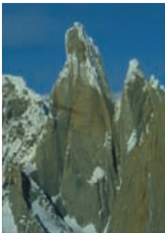
Patagonija: Cerro Torre