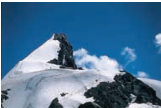
Aklimatizacijski vzpon na Gumachi Peak

Vulkan Elbrus z dvema vrhovoma (Zahodnim – 5642 m – in nižjim Vzhodnim – 5621 m) je skozi vse leto pokrit z debelo snežno odejo. Zaradi svoje višine kroji lastno vreme, tako da so tudi v poletnih mesecih možni hitre spremembe in snežni viharji. Primeren čas za vzpon so julij in avgust ter prvi tedni v septembru. Gora je tehnično gledano morda nezahtevna, seveda pa je za vzpon obvezna uporaba derez in cepina. Zaradi svoje višine je že dokaj velik zalogaj za telo in duha. Odločilnega pomena za uspešen vzpon so predvsem odlična fizična pripravljenost, dober program aklimatizacije ter obilica volje.