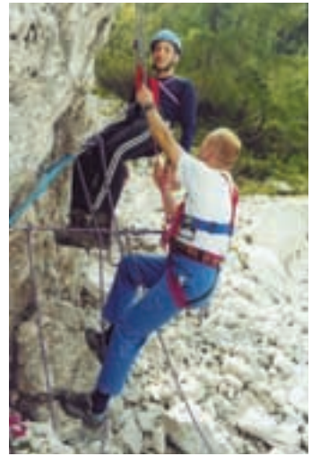
Reševanje padlega soplezalca

mite, dekleta vas ne bodo imele rajši). Alpinist pomeni odgovornost, odgovornost do sebe, tistega, ki pleza z njim, do gore. Pustite času čas, plezajte in si nabirajte izkušnje, kajti važni so kilometri, ne hitrost, zato bom še enkrat uporabil tisto že večkrat slišano frazo: "Dober alpinist je star alpinist, pa živ!"