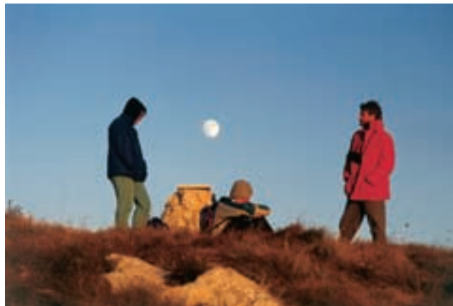
Večer na grebenu Čičarije

Zaradi še kar obsežnih dimenzij preostale poti smo se Kavčiču odpovedali. Z zastavo spredaj in vmes smo se pomikali vzdolž planote k sosednjemu Goliču (890 m). Vrh je zaznamovan z daleč vidnim železnim obeležjem, da se ve, kje si. Tam je tudi skrinjica z vpisno knjigo. Žal pokrov ni dovolj zatesnjen in padavine v burji zmočijo knjigo. Žgoče sonce nam ni prizanašalo s pripeko. Manj trpežni pohodniki so že spraševali po bližnjici nazaj. Edini popust, ki so ga lahko dobili, je bila opustitev obiska vrha Kojnika četrte ure stran od poti. Željni sence smo pohiteli čez planoto, vso rumeno od cvetočega ranjaka, do pogorelega borovega gozda in naprej k lovskemu zavetišču. Klopi ob njem so kar vabljive, z betonom zaliti zabojujnik pa vse preveč spominja na nesrečni černobilski reaktor. Morda je bil zamišljen kot varno pribežališče, če bo še kdaj plamenel gozdni požar, kot je pred štirimi leti. S škurbine v mogočnem zidu Kraškega roba smo se spustili do zazidske železniške postaje. Pri osvežujočem izviru, zajetem za vaški vodovod, smo vsi presončeni spet prišli k sebi.