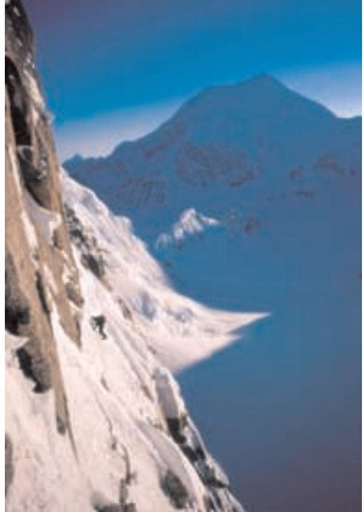
Foraker iz smeri Luna

Po več kot petdesetih urah sta bila spet v bazonem taboru, za njima pa je ostala smer Light Traveller, ki sta jo preplezala zares zelo lahka z minimalno opremo. Daljši zapis o tamkajšnjem plezanju Marka Prezlja bomo objavili v oktoberski številki.