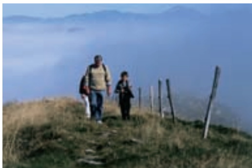
Družina na izletu

Menim, da življenje z naravo pozitivno vpliva na oblikovanje ljudi. Tisti, ki se ukvarjajo s taborništvom, planinstvom ali drugimi športi v naravi in jim ta dejavnost postane življenjska vrednota, si v napornem življenjskem ritmu sodobnega sveta lažje ohranjajo duševno zdravje in telesno kondicijo. Lažje se izogibajo potrošniški miselnosti in razumejo nujnost varstva okolja. Večja je tudi verjetnost, da si prijatelje ali celo življenjske partnerje izberejo iz istega kroga ljudi.