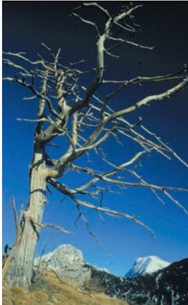
Viharnik na Ogradih

zvojne možnosti za sonaravno, okolju prijazno rabo prostora. Pri sestavi novega koncepta varstva in upravljanja narodnega parka je treba upoštevati domačo zakonodajo kakor tudi mednarodne dogovore in trende, ki jih narekuje priključevanje Evropski skupnosti. Zato je cilj bodočega urejanja Triglavskega narodnega parka varstvo in urejanje skladno z upravljavskimi kategorijami IUCN, sprejetimi konvencijami in strokovnimi priporočili. V narodnih parkih evropskega alpskega prostora prevladuje varstvo narave in kulturne krajine v obliki II. in V. upravljavske kategorije IUCN. Glede na naravovarstveno vrednotenje in dejansko rabo v prostoru se varovanje v teh dveh stopnjah prostorsko prepleta, v osrednjih delih narodnih parkov pa mora prevladovati II. upravljavska kategorija IUCN.