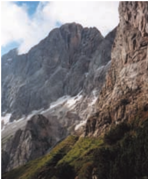
392 Južna stena Dachsteina

Hoher Dachstein, skoraj tritisočak (2995 m), je najvišja vzpetina prostranega pogorja, ki leži v Avstriji severno od Nizkih Tur. Zgrajeno je iz apnenca, tako da so gore podobne našim. Vendar pa so postavljene "zrcalno", saj imajo prepadnejše južne stene, severna pobočja pa so položnejša. Pod najvišjimi vrhovi se razprostira celo ledenik, kamor žičnica pripelje številne obiskovalce občudovat sneg in led tudi v vročih poletnih mesecih. Kraški značaj potrjuje pogled z osrednjih vrhov proti severovzhodu na neverjetno prostrano planoto, visoko med 1800 in 2000 metri. Naša Komna je pravi vrtilček v primerjavi s temi obširnimi "njivami" neprehodnega ruševja in vrtač. Po zemljevidu sodeč naj bi bilo to območje rezervirano za vojaške vaje. Ubogi vojaki, ki jih naženejo v to zeleno divjino!