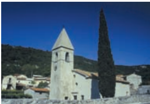
388 Zazid

Nekoliko zaraščen, na debelo zasenčen kolovoz nas je zlagoma dvigal h košenicam Na strugu, na prvo širšo stopnjo nad Kraškim robom. Nekdaj so kmetje iz Zazida in Rakitovca tod kosili seno. Zdaj jih le še malo živi od skope zemlje. Mladi se odseljujejo ali se vozijo od doma delat v Sežano, v Koper, tudi v Trst, ostareli pa s težavo ohranjajo še tisto malo polja in travnikov v ravninah doline. Pokrajina se tako sama vrača naravi, naselja se praznijo, posamezni domovi samevajo, stavbe lezejo vase, v razvaline. Leta 1961 je bilo v Zazidu še 197 vaščanov, danes, po 40 letih jih je še 152. Ekstenzivno preživetje z živinorejo na podlagi paše in sena s čičarske planote je že prete-