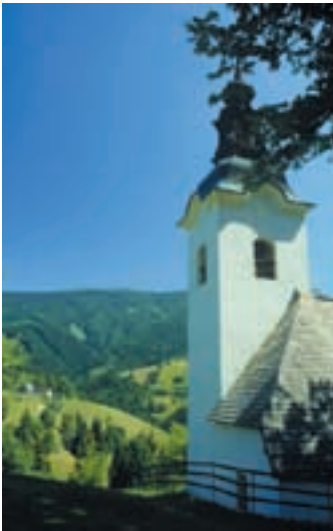
Sv. Ana v Koprivni