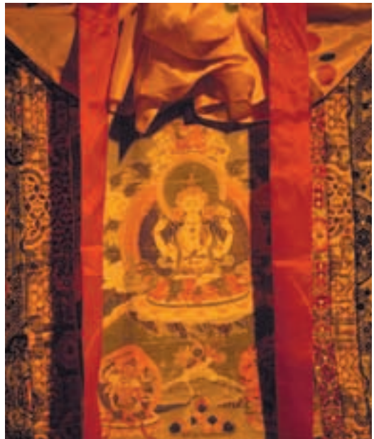
Prizor z razstave

domačinov – Tibetancev, Šerp in drugih -, o katerih zelo redko sploh kaj slišimo, čeprav se marsikateri alpinistični podvig, o katerem potem na Zahodu na dolgo in široko poročajo mediji, zgodi tako rekoč preko njihovih hrbtov. Neštetokrat pomagajo alpinistom v težavah in med vzponi garajo do meja človeških zmognosti. Tretjič pa – solidarnost v gorah moramo razumeti širše. Mi, zahodni alpinisti, hodimo v gore za zabavo. Šerpe, Tibetanci in drugi domačini v Himalaji pa gredo v gore zato, ker s tem preživljajo svoje družine. Nemalokrat pri tem izgubijo življenje. Želeli smo na nek način izraziti solidarnost do teh ljudi. Dalaj Lama je duhovni vodja in simbolični predstavnik Tibetancev in drugih budističnih himalajskih ljudstev in soglasno smo sklenili, da bomo letošnjo nagrado izročili nje-mu."