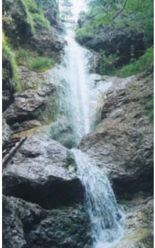
Repov slap

Od vznožja je pogled na Repov slap, kot ga imenujejo domačini, res veličasten.