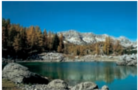
Pri Dvojnem jezeru

Odseku za varstvo prirode in prirodnih znamenitosti in Slovenskemu planinskemu društvu se je leta 1924 posrečilo – žal samo pogojno za dobo 20 let -, da je bila Dolina Triglavskih jezer razglašena za Alpski varstveni park in s tem zaščiten. Park je obsegal okrog 1400 hektarov. Oba pobudnika sta z upravljavcem, direkcijo gozdov v Ljubljani, sklenila zakupno pogodbo.