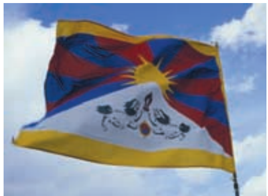
Tibetanska zastava v Dolomitih

“Srečanje s tem človekom, ki je za tibetanske budiste živa mitologija, je bilo svojevrstno doživetje. Presene-