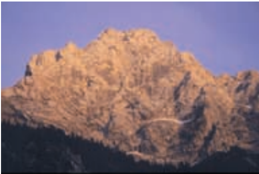
Večerni obraz Ojstrice

Ko sem razmišljal, katero smer bi izbral kot prvo za našo novo rubriko, v kateri bomo vsak mesec predstavili po eno smer v stenah naših gora, sem bil kar nekako v dilemi. Ene so pretežke, ene so nepopularne, spet druge kar preveč "obrabljene", nekaterih je "sam šoder" ... In vse bolj mi je na misel prihajala severna stena Ojstrice (2350 m) nad Logarsko dolino. Prav zares markantna stena, v kateri pa lahko več ali manj srečujete samo Štajerce oziroma alpiniste iz severovzhodnega dela Slovenije, ostali le redko zaidejo v ta konec. To je podobno kot pri smučanju, ko se Ljubljanci drenjajo na Krvavcu ali v Kranjski Gori (če slučajno ima sneg), za Pohorje pa so le bežno slišali. O smučanju na Pohorju pa ... Kar pridite in prijetno boste presenečeni! Na Pohorje in v Logarsko!