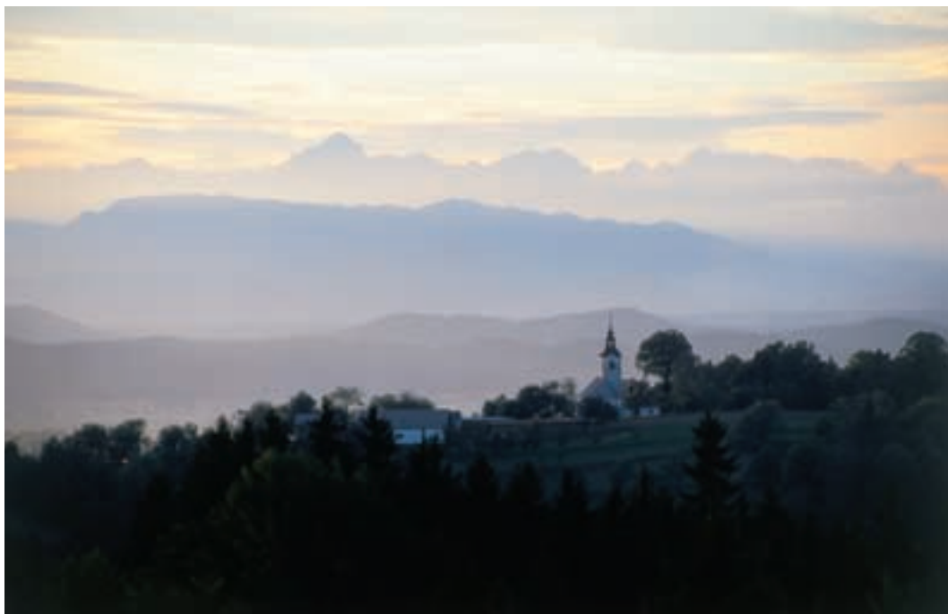
Griči, hribi, gore ...