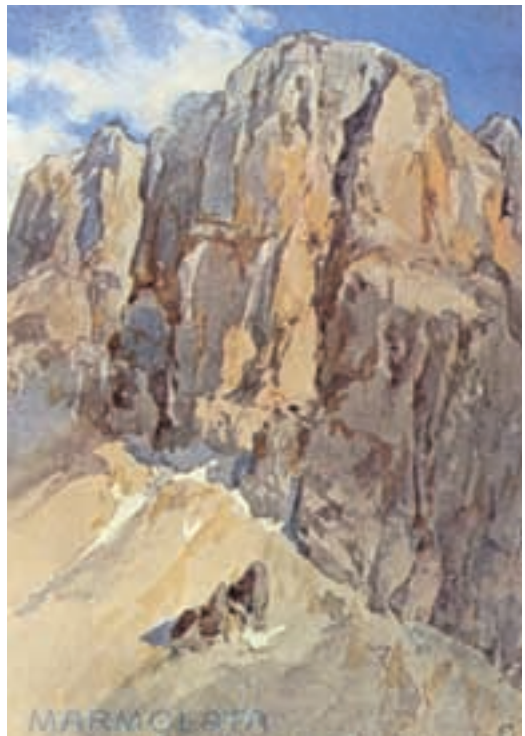
Spominska razglednica ob 100-letnici prvega vzpona po južni steni Marmolade