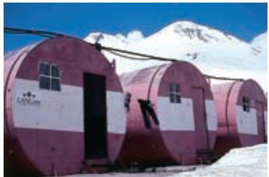
Pločevinasti "Garabashi Bočki", v ozadju oba vrhova Elbrusa

Po šestih dneh zanimivih vzponov na višinah med 3300 in 3900 metri, kjer sta nas pozdravljali bogata flora in favna, smo se odpravili v kraj Azau tik pod vznožje veličastnega Elbrusa. Najzanimivejši aklimatizacijski vzpon je bil na Gumachi Peak (3900 m), od koder se odpirajo nepopisno lepi pogledi na dolini Adylsu in Adyrsu ter Elbrus. Iz Azava vozi stara nihalka na višino 3500 metrov, kjer se nahaja postaja Mir. In tukaj se prične vzpon na Elbrus.