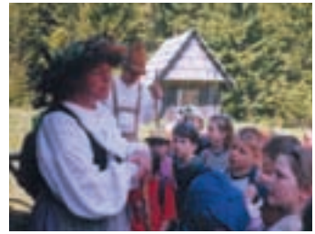
Nasveti tete Pehte

Najdaljši je bil pohod v Kekčevo deželo. Med potjo ob reki Pišnici do jezera Jasna in naprej v dolino Krnice so otroci občudovali reko in vrhove gora visoko nad dolino. Ustavili smo se, prisluhnili šumom vode in žuborenju, ki je prihajalo iz struge, kjer se je vsa čista valila čez kamenje. Občutili smo tudi njen hlad, saj smo si v njej umivali roke. Čista in lepa je reka Pišnica. V Krnici nas je vodnik pospremil v praviljni svet Kekčeve dežele sredi neokrnjene narave Triglavskega narodnega parka. Vznemirjenje je raslo. Otroci so pozabili na utrujenost. Nič jih ni moglo ustaviti. Že misel, da bodo srečali Kekca in teto Pehto, jih je gnala naprej. Po gozdni poti smo se bližali koči in veselo prepevali Kekčevo pesem. Od daleč smo slišali Kekčevo vriskanje in petje, kar poleteli smo proti njemu. Kekec nas je veselo pozdravil in povabil h koči. Na pragu nas je pričakala teta Pehta in pozorno smo ji prisluhnili, ko nam je predstavila zdravilne rastline, iz katerih pripravljajo kapljice in pomaga vsakomur, ki