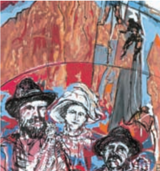
Slika naveze, ki je pred 100 leti prva preplezala južno steno Marmolade (spominska razglednica)

Ta zanimiva dama se je torej zazrla v južno steno Marmolade in si zamislila smer, ki po 800 metrih plezanja, dandanes ocenjenega z zgornjo četrto stopnjo, vodi naravnost na najvišji vrh Marmolade, na Punto Penio.