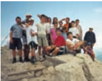
Na Krnu

Sledil je dvodnevni planinski izlet na Krn in h Krnskemu jezeru, kjer smo prenočevali. Naslednji dan smo se razdelili v dve skupini. Ena je krenila po poti čez Prehodce do avstrijskega spomenika iz 1. svetovne vojne na Malih peskih. Med potjo smo občudovali, koliko truda, znoja, znanja in trme je bilo potrebno, da so na vrh gore pritorovali vso vojaško mašinerijo za bojevanje. Ostanke orožja ter drugi deli še ležijo ob poti, ki nas je nato vodila mimo Jezera v Lužnici in Krnskega sedla do planine Kuhinja in nazaj v tabor. Po dvodnevni turi se prileže dan počitka, ki je kot nalašč za zabavne in športne igre, taboriada, ocenjevanje šotorov, inštrukcije vrhne tehnike, plezanje na skali in mnogo drugih zabavnih stvari. V četrtek je sledil ogled kobariške zgodovinske poti in slapa Kozjak. Popoldne pa smo imeli čofotalni dan v reki Nadiži. V petek smo odšli na planinski izlet do planine Zapikraj, si ogledali sirarno na planini