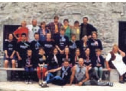
Skupinski posnetek na Korošici

nasitne želodce. Po zajtrku je sledilo ocenjevanje postelj, katere so otroci po dveh dneh pridno pospravljali, saj jih je kazenski tek tega hitro naučil, in nato orientacija na Lučkega Dedca, do katerega vodi le brezpotje, zato so otrokom še kako prav prišli kompas in karta ter seveda znanje, ki so si ga nabrali v preteklih dneh.