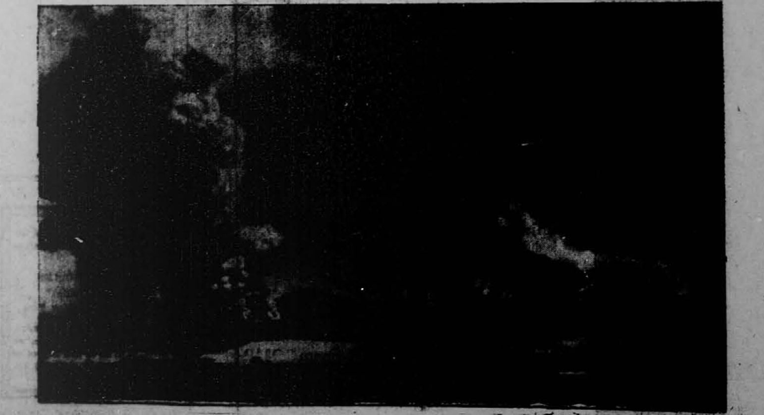
Konec meseca junija je začel na otoku Bismarck, severno od Nove Gvineje, bruhati veliki ognjenik. Mesto Rabaul je popolnoma porušeno. Več sto ljudi je izgubilo življenje. Ameriška trgovska ladja "Golden Bear" je rešila 750 oseb, večinoma žensk in otrok, ter jih prepeljala v Kokopo, 15 milj severno od Rabaula.