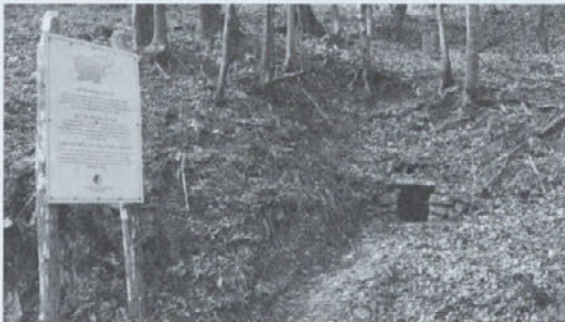
LOVSKA DRUŽINA Žetale

LD veliko teh lovsko - gozdarskih poti vsako leto očisti in jih tako drži še pri življenju in prav lepo jih je uporabljati, saj je pogled z njih čisto drugačen kot pa iz avtomobila. Zato Vam jih toplo priporočamo, pa še divjad bomo manj vznemirjali in še zagledali bomo lahko kakšno.