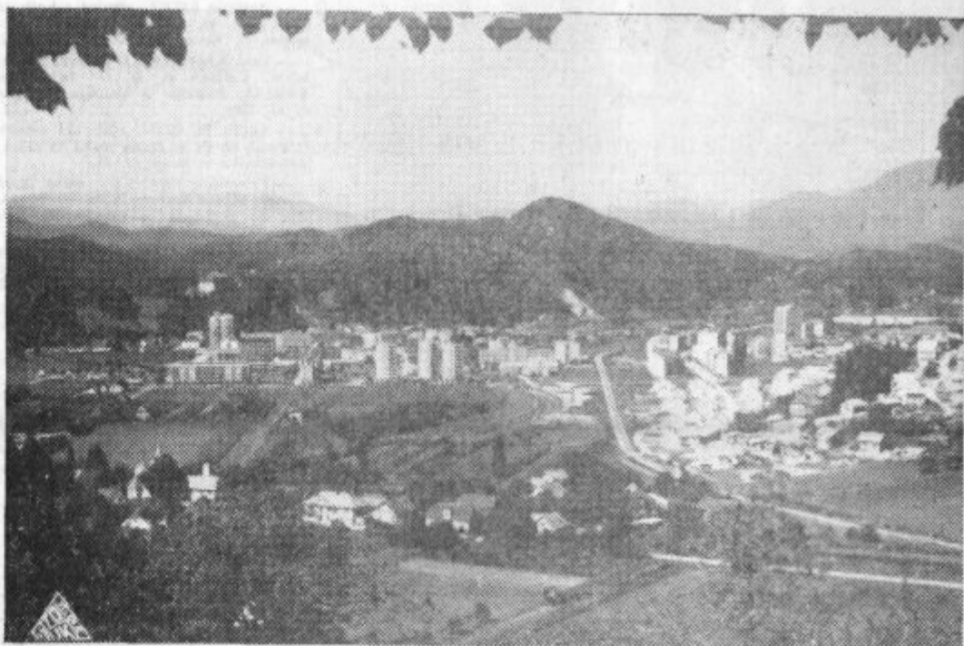
Panorama Saleške doline z Velenjem v ospredju

X. Y. je tako visoko dvignil svojo kolektivno zavest, da sploh ni več imel lastne sodbe.