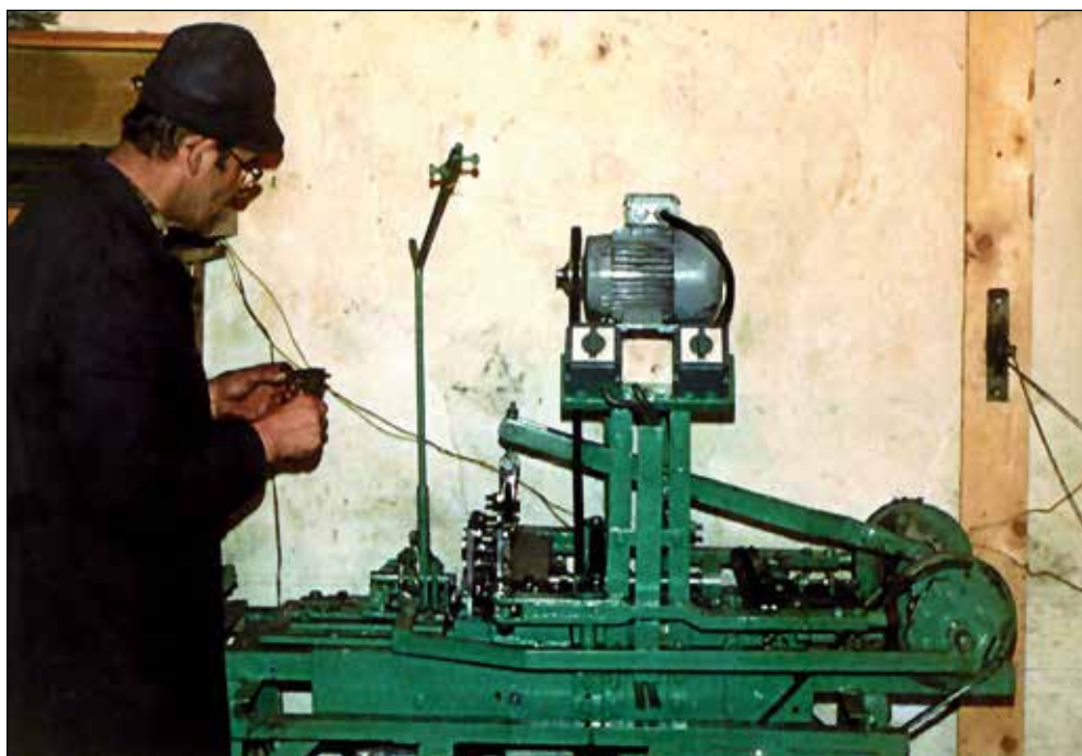
V delavnici v Sorici je skonstruiral več strojev.