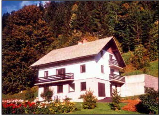
Hiša v Sorici.