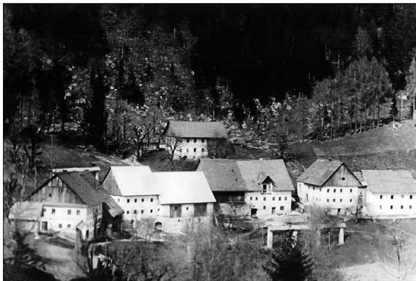
Zgornje Danje leta 1930.

Če imaš kaj početi, je življenje prekratko, tako kot je bilo prekratko Petrovo življenje. Živel je v nepravem času, kljub častitljivim 85 letom je prezgodaj zapustil ta svet, ker je imel še veliko "pogruntavčin", še veliko njegovih zamisli mu je ostalo neuresničenih.