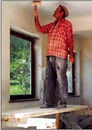
Delo v hiši v Sorici.