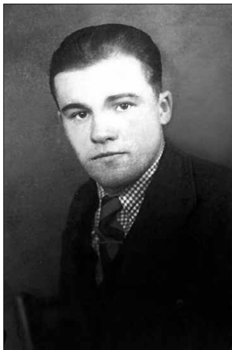
Petrovih 23 let.