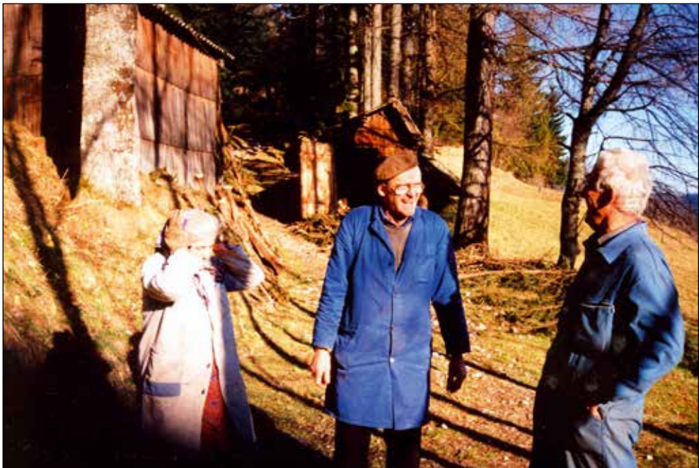
Med sosedi v Zgornjih Danjah.