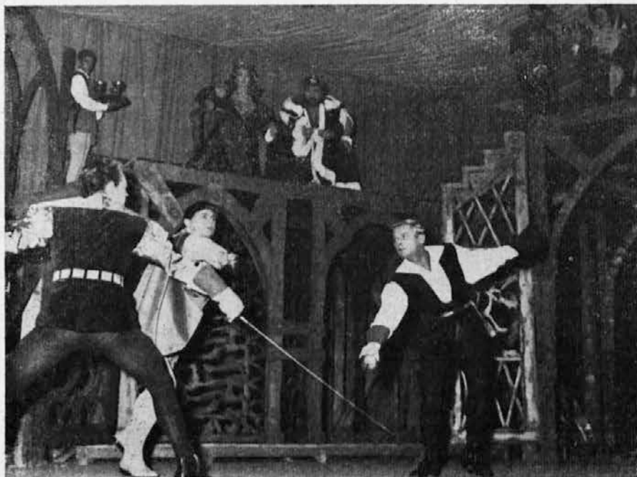
Zadnji prizor Shakespearjevega »Hamleta« v izzvedbi SG v Trstu