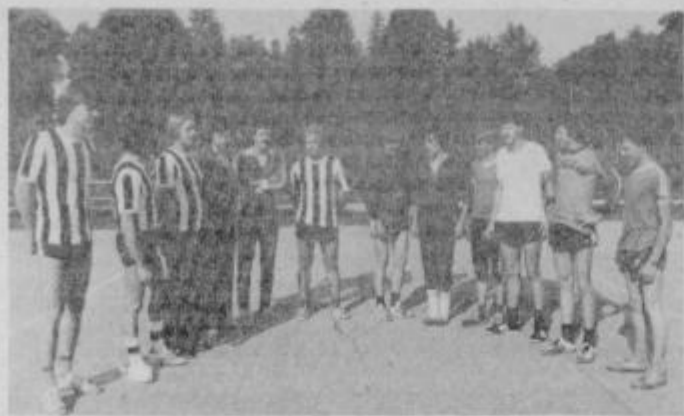
Začetki so bili negotovi, pozneje pa je negotovost zamenjal upravičeni optimizem v ekipi RK IMPOL.