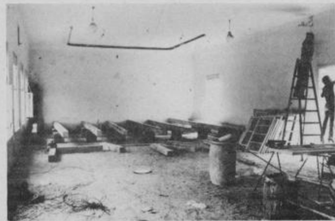
Potek obnovitvenih del v dvorani doma krajanov.