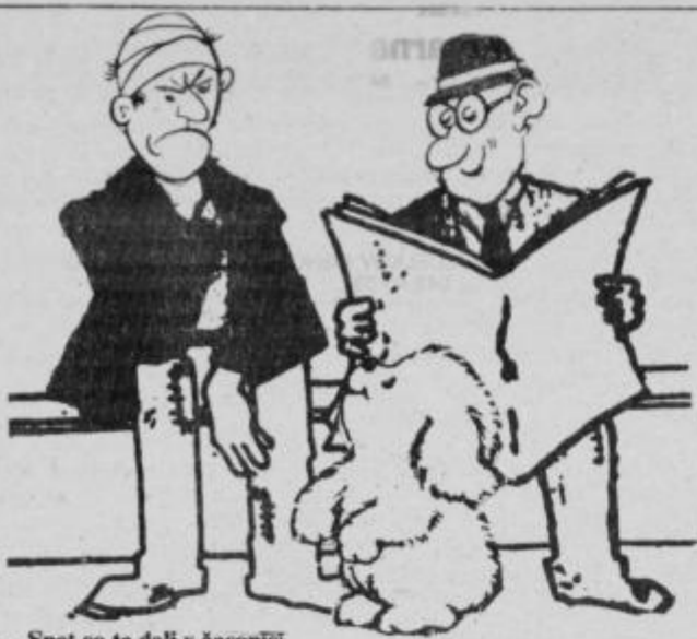
— Spet so te dali v časopis! — Res, zaradi česa? — Nepridiprav oplenil stanovanje, ko je družina bila na vikendu . . .