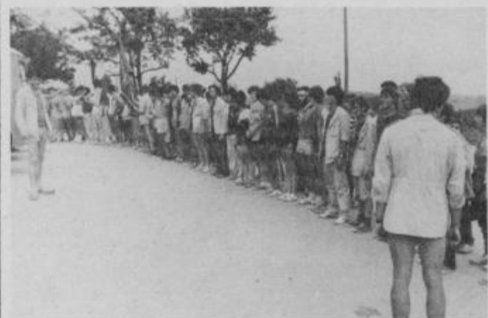
Po končanem delu zbor na trasi v občini Lenart.