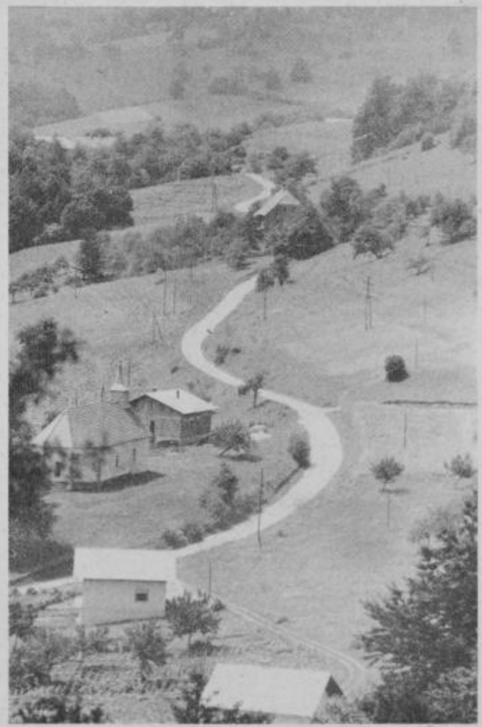
Cesta od Žetal do meje KS Rogatec v dolžini 3,2 km, ki je doslej bila delo slabše vzdrževanosti v ptujski občini, bo s pomočjo tehničnih enot JLA modernizirana.