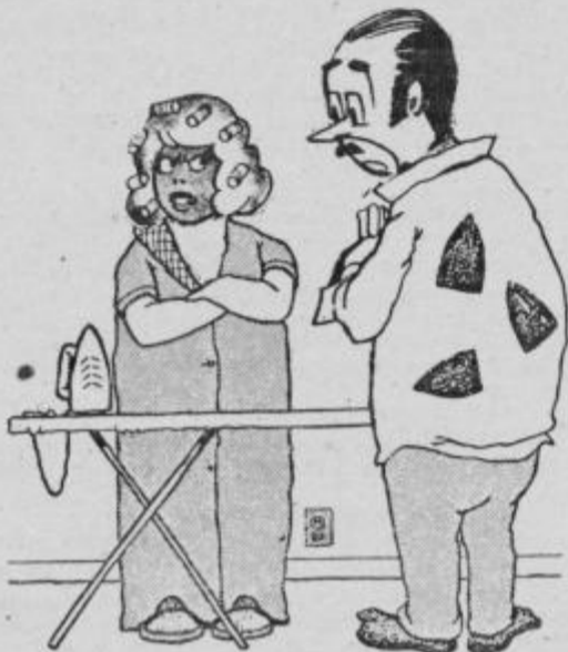
Ne bom ti pojasnjevala zakaj, svetujem ti le, da na izletu ne slačiš suknje.