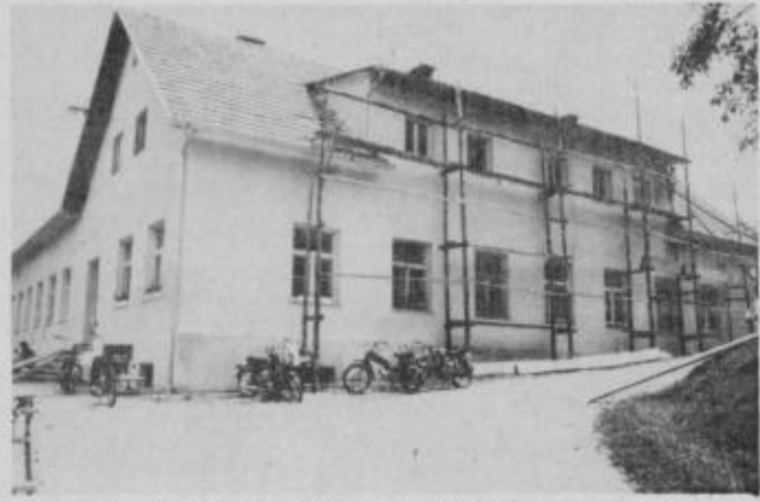
Obnovljena zunanost doma krajanov v Žetalah.

že meseca maja, ko so Gozdno gospodarstvo Maribor TOZD Gozdarstvo Ptuj zaprosili za les, namenjen odski konstrukciji v dvorani. V začetku junija pa so se že lotili obnove nekaterih delov razpadajočega se ostrešja in kritine ter postavili vetrobrane, ki bo v bodoče preprečevali odnašanje strešne opeke in odkrivanja stavbe. Takoj zatem so se lotili fasade in jo doslej že v celoti obnovili.