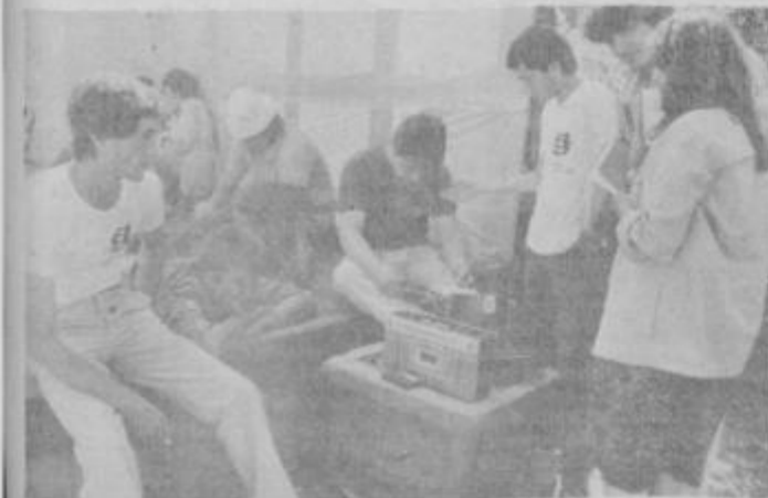
Del prostega časa brigadirji porabijo za poslušanje radija.