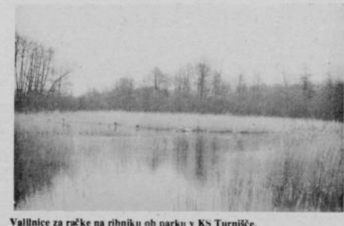
Vallnice za račke na ribniku ob parku v KS Turnišče.

Nekoč je urejal ta park KK Ptuj oziroma delavci z DE Turnišče.