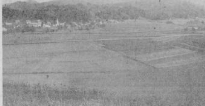
Lepo urejena polja v Dravinjski dolini (v ozadju Makole) vzbujajo zaupanje v uspešnost sanacijskega programa kombinata.