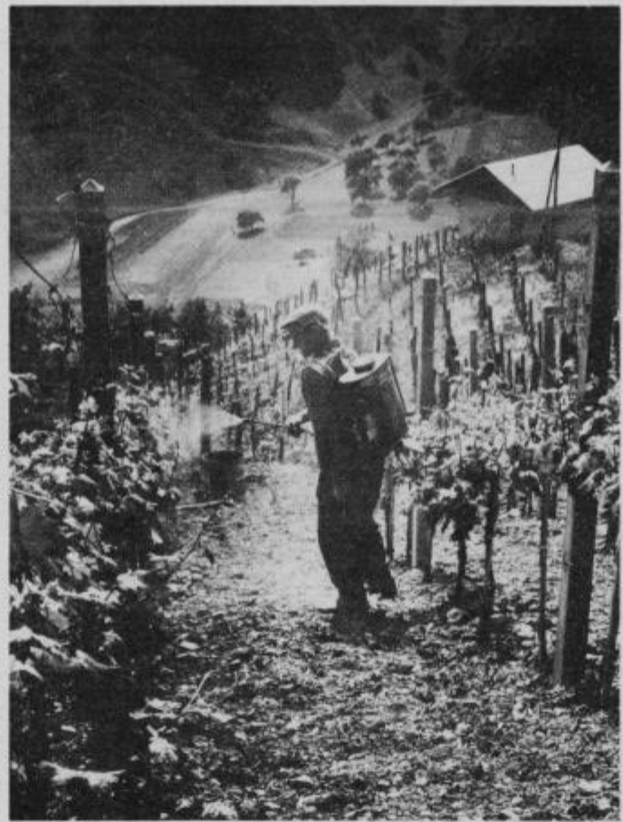
Vinogradnikom v Halozah koristno služi tudi klasična nahrbtna škropilnica na ročni pogon.

Pretežni del območja Haloze je prizadela toča in povzročila v vinogradih, na poljih in sadovnjakih od 10 do 90 odstotkov škode. Poškodovano vinsko trto in druge intenzivne nasade je treba skrbno škropiti po navodilih kmetijskih strokovnjakov. Več o tem preberite na 5. strani.