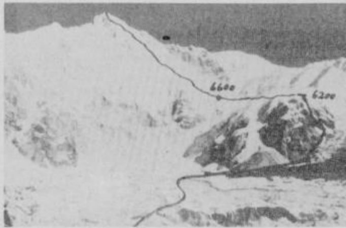
Južna in jugovzhodna stena ČO OJA (8201 m) z vrisano avstrijsko smerjo v jugovzhodni steni, ki pa je niso dokončali

Medtem ko za kondicijske priprave skrbi predvsem o individualnih plezanjih v zahtevnejše vrhove naših gora in tudi nekaterih tujih (francoskih) pa imajo več težav z zagotavljanjem finančnih sredstev. Te si bodo v veliki večini zagotovili sami. Že doslej so v ta