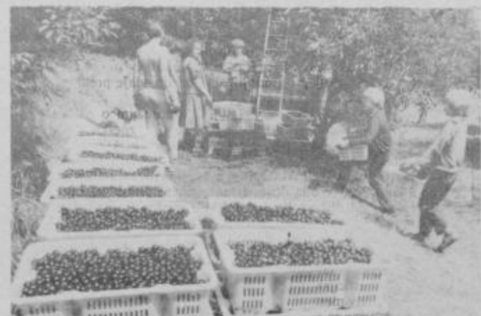
Obrane višnje sproti skrbno tehtajo in odvažajo.