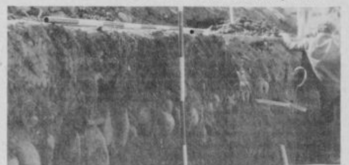
Pričetek izkopa dnaže ob južni steni žitnice ptujskega gradu 1982. V južnem profilu so 30—50 cm pod površino vidni ostanki tlakovane poti pod napuščem. Foto: Marjeta Ciglenečki, fototeka kulturnozgodovinskega oddelka št. 1454, št. neg. 958.

Turnirski prostor danes proti severu v smeri žitnice rahlo pada, včasih pa je bil ta padec še izrazitejši, kar nam povedo ostanki poti, tlakovane z oblicami, ki so se pri izkopu pokažali v profilu ca 30—50 cm pod današnjo površino. To je nivo do koder segajo odprtine vertikalnih kletnih zračnikov ob južni steni, ki pa so bile kasneje zasute