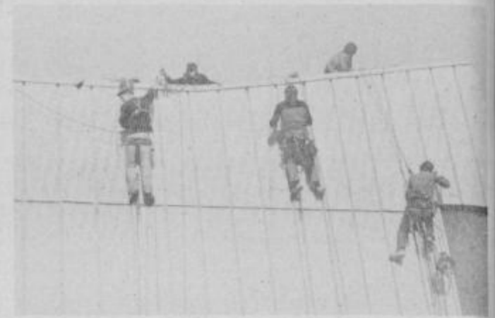
Tako pripeti z vrvmi so kar več sto ur opravljali obnovo fasad stanovanjskih blokov v soseski S-23 v Mariboru, da so si zaslužili denar za pot

Že od začetka priprav, to je pred dobrim letom, ko so sklenili organizirati odpravo na Himalajo, aktivnosti v tej smeri ne prenehajo. Najprej so prek Planinske zveze Slovenije zaprosili Nepalsko vlado, da jim odobri vzpon na ČO OJU (CHO OYO) po južni steni, ki os-