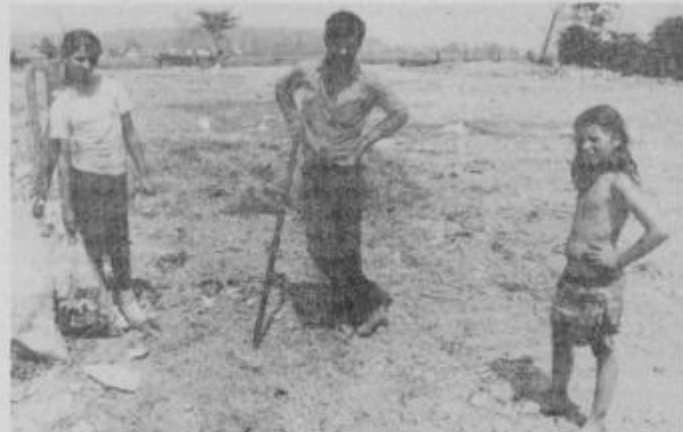
. . . in med iskanjem odpadnih kovin v rogozniški gramoznici.