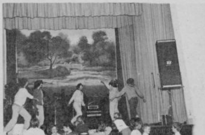
Ob zaključku šolskega leta 1983/84 so učenci slovenske dopolnilne šole v Frankfurtu zaigrali igrico SOVICA OKA.