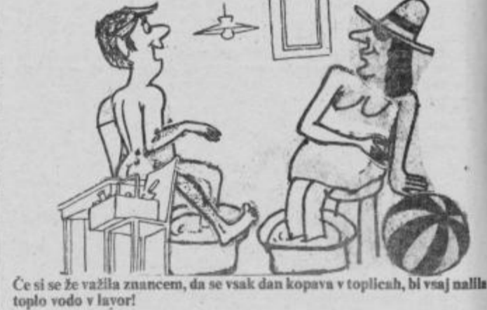
Če si se že važiha znancem, da se vsak dan kopava v toplinah, bi vsaj našla toplo vodo v lator!