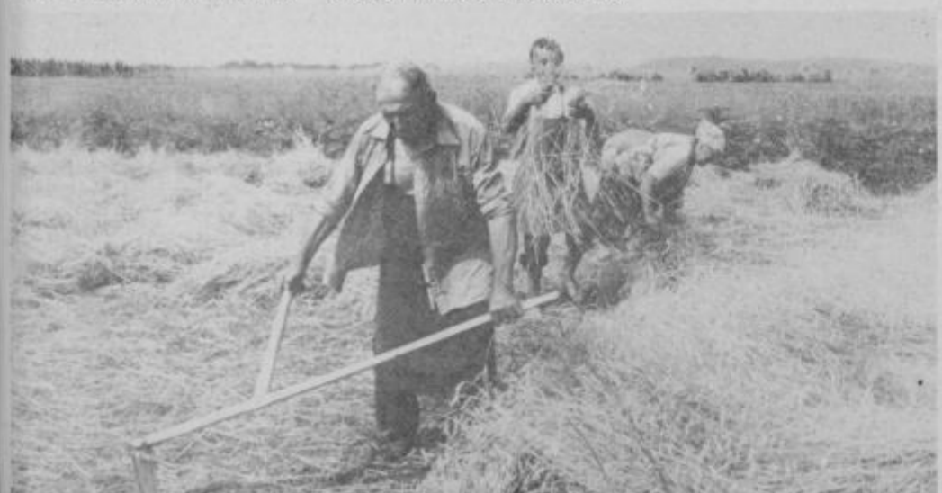
Kmetovalec s Ptujkega polja pa rž žanje s koso, da se slama ne poškoduje, saj jo bo po omlačvi zaškopal in prodal. Ržena slama je namreč zelo iskana in je včasih vredna več kot zrnje.

delo opravijo s kosilnicami, celo z navadno koso, le v hribovitih predelih še tu in tam s klasičnim srpom.