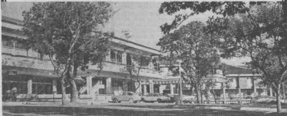
Na gornji sliki hotel »Maestoso« v Lipici Slika DESNO: Vožnja s kočljo do majhne in zelo lepe podzemne jame Vilenice je pravi užitek.

Lipica pa je tudi prizorišče najrazličnejših prireditev... Pogoste so slikarske razstave, modne revije, plesi, srečanja, zborovanja... Ko se odločate in premišljujete, kam bi šli na izlet, na vikend ali na počitnice, pomislite tudi na Lipico in presodite. Zahtevajte prospekte, cenike in informacije pri »Kras Sežana« ali neposredno od hotela »Maestoso« telefon 067/73-009.