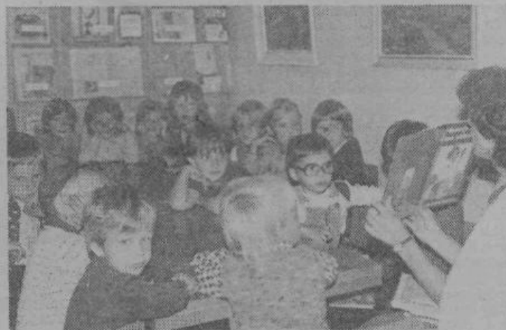
Vsako drugo sredo se povprečno 20 redovnih malčkov zatre v tovariško knjižničarko, ki jim pove zanimivo pravljico. Ta ura, ki je namenjena samo njim, kar prehitro mine. Otroci bi radi še poslušali, risali, peli in reševali uganke, saj je svet domišljije tako čudovit.

Tovrstno obliko dela z našimi najmlajšimi je Splošnoizobraževalna knjižnica Grosuplje uvedla v svoj redni program že meseca marca letošnjega leta. V polletnih mesecih smo pravilne ure začeli ukiniti, saj so bili otroci večinoma s starši na dopustu. Ker so bile ure pravilje zelo dobro obiskane in sprejete z odobravanjem, smo jih v mesecu septembru ponovno uvedli.