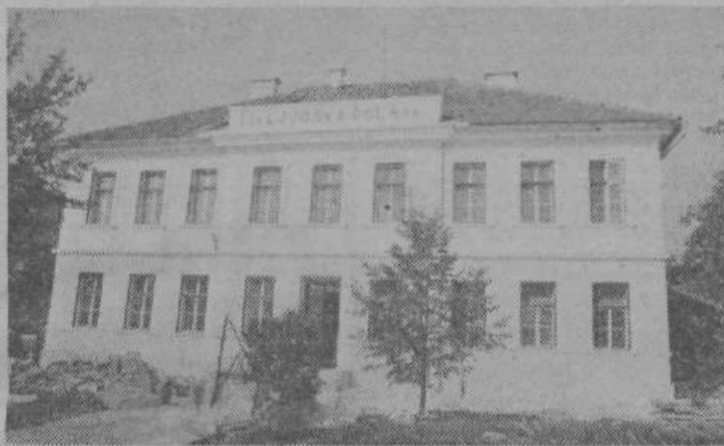
STIČNA — Otvoritev prenovljenih prostorov bivše OŠ, v katerih se bo odvijala vzgojno varstvena dejavnost za predšolske otroke ter delo organov krajevne samouprave, družbenopolitičnih organizacij in društev, bo 28. oktobra 1983. Vzgojno varstvena dejavnost bo vključevala dnevno varstvo v enem oddelku ter program celoletne priprave na šolo v dveh oddelkih. Delo se bo pričelo 2. novembra 1983.