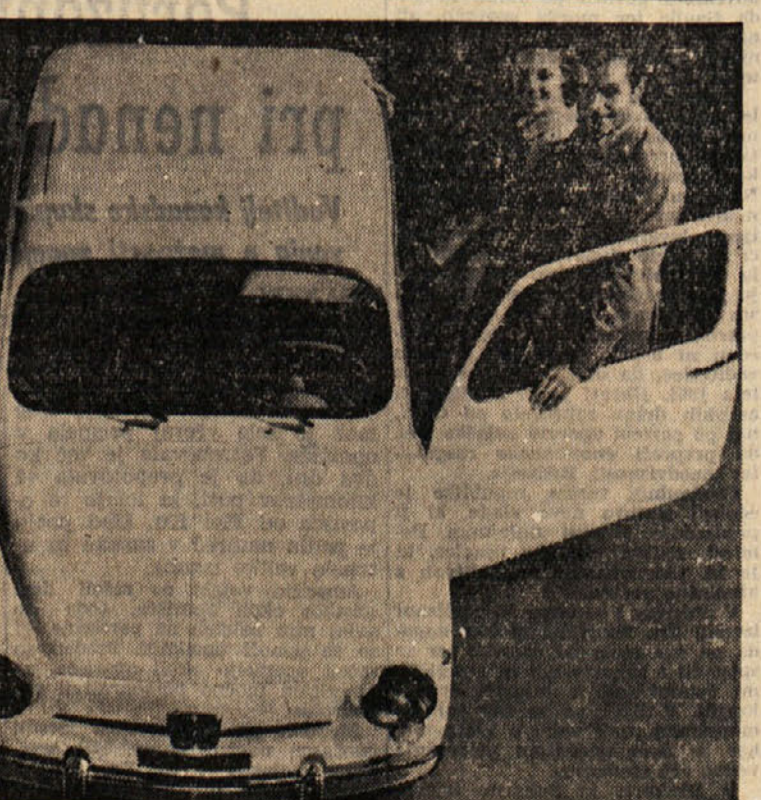
Turinska tovarna avtomobilov je zelo popularno «600» še nekoliko popravila... Med novostmi na olistani «600» so žarometi, ki so nekoliko večji od prejšnjih...

Vatikanski »L'Espresso» odgovarja... Dal si je zašiti usta