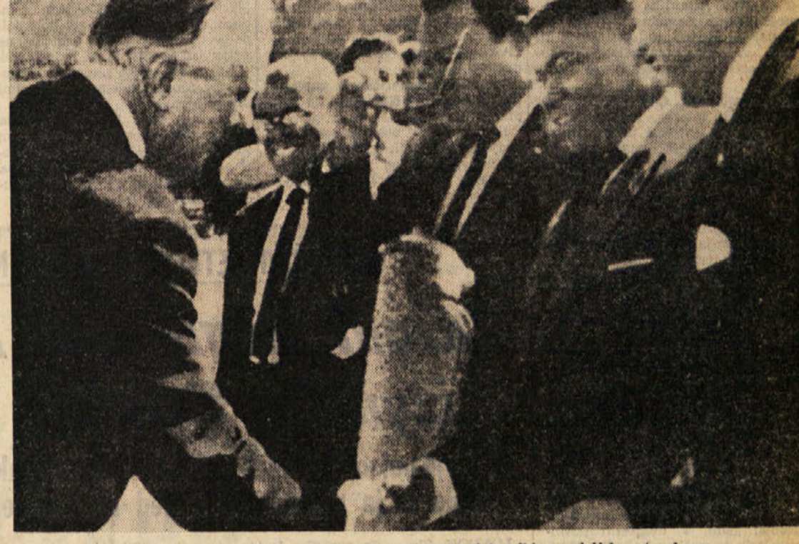
Wilson se je v Salisburyju sestel tudi s predstavniki opozicijske stranke

Včeraj je Wilson sprejel dva afriška voditelja - Skupno se je posvetoval z 71 osebnostmi Democracije Africanov - Predložena resolucija o Rodeziji v odboru za skrbništvo v OZN