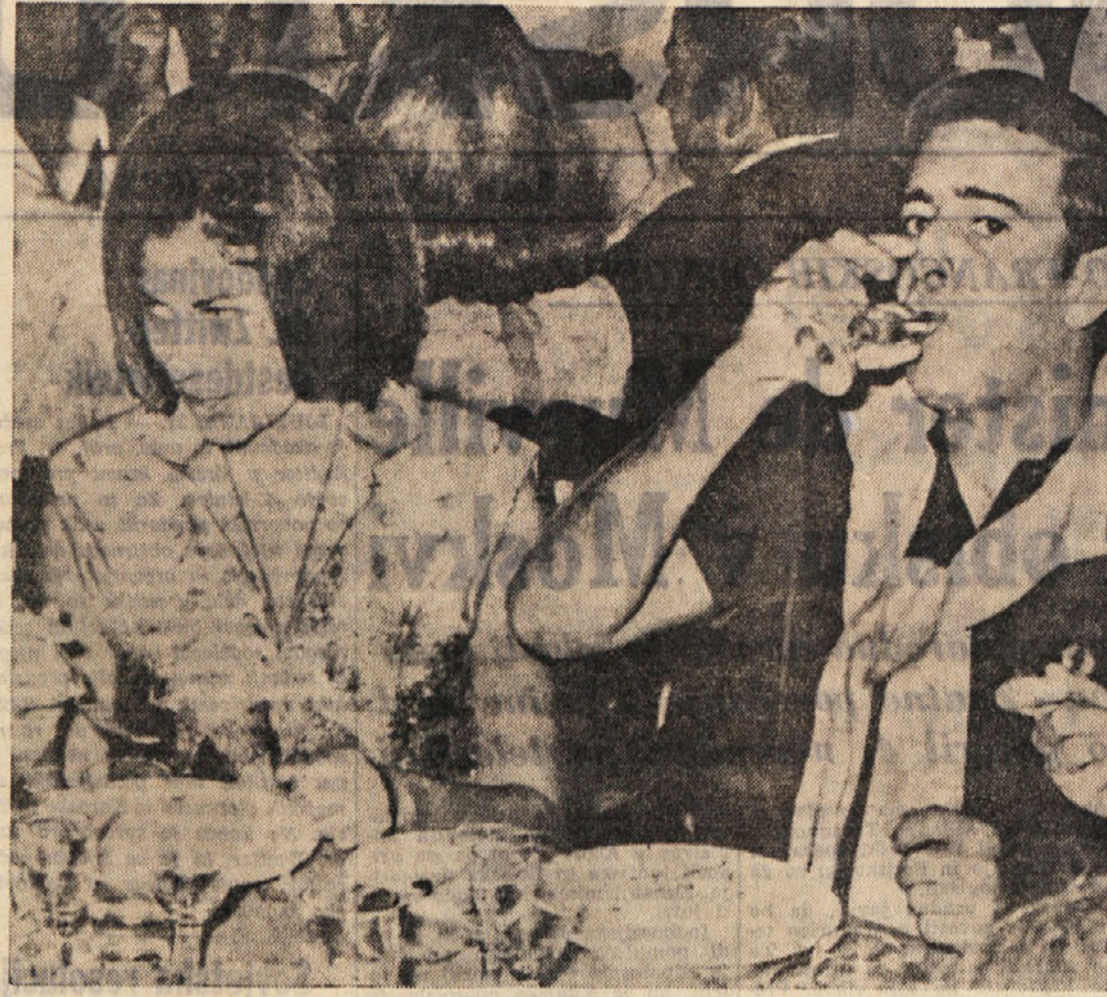
Bivša iranska cesarica Soraya, o kateri krožijo najrazličnejše govorice...