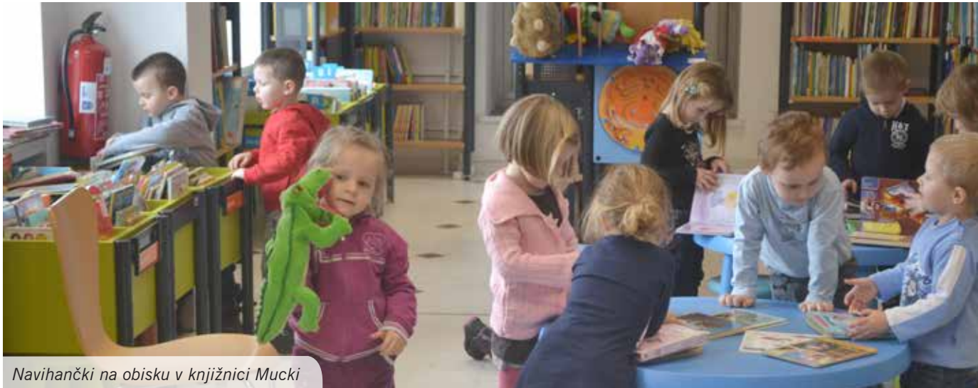
Navihančki na obisku v knjižnici Mucki

Mesec februar smo začeli s tednom kulture. Otroci so prinašali knjige od doma, skupaj smo jih prebirali in se veselili ob različnih knjižnih junakih. Knjiga otroka pritegne in v njem zbudi željo, da jo vzame in odpre. Vsaka knjiga pripoveduje svojo zgodbo in ima svojega junaka, ki otroka popelje v svet domišljije, ki je njemu blizu.