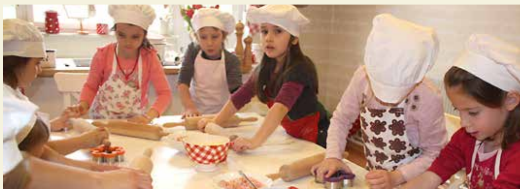
Na delavnicah otrokom na igriv in drugačen način približamo občutek in odnos do hrane. Hkrati se otroci učijo osnovnih procesov v kuhinji in se ob tem zabavajo. Najbolj navdušeni so nad tem, kaj vse zmorejo pripraviti sami.