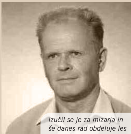
Izučil se je za mizarja in še danes rad obdeluje les

Besedilo: Branko Lipar, Senta Avbelj