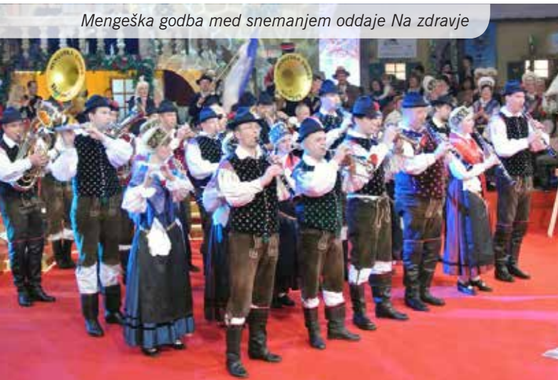
Mengeška godba med snemanjem oddaje Na zdravje

V studiu VPK v Ljubljani je bilo snemanje zelo zanimivo. Godbeniki smo se predstavili s skladbo Mengeška. Saj veste, to je tista: »V Mengšu smo vesel' ljudje, glasbo vsakdo rad ima ...« Ob naših melodijah so se zavrteli tudi naši plesalci iz folklorne skupine. Na tekmovanju za najboljšo razglednico Slovenije nas je predstavljala ansambel z dolgim in zanimivim imenom – Kdo so pa to iz Mengša, s skladbo To smo pa mi, ki je stara že okoli sto let, pripoveduje pa o vseh prebivalcih v občini, Mengšanih, Topolcih, Ločanih in Dobencih. V petek, 22. marca, je bila skladba premierno predstavljena v oddaji. Nato je naslednji petek, 29. marca, tekmovala skupaj s šestimi ansambli za preboj v finale, ki bo na Studencu. S pomočjo vas, glasovalcev, so se uvrstili naprej in se lepo zahvaljujejo za vaše glasove.