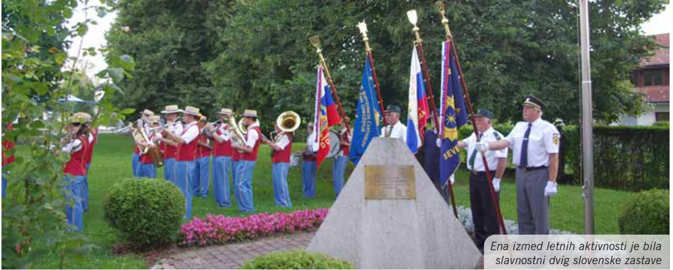
Ena izmed letnih aktivnosti je bila slavnostni dvig slovenske zastave