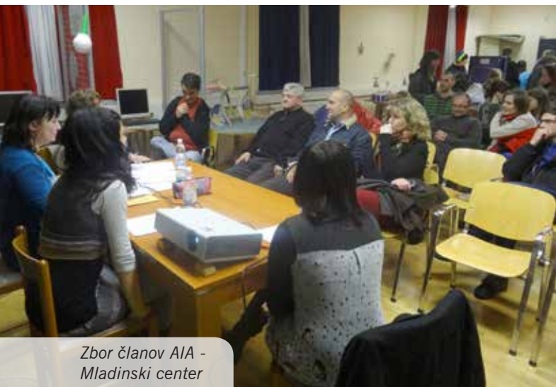
Zbor članov AIA - Mladinski center