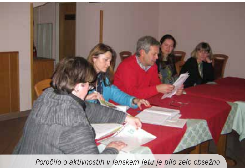
Poročilo o aktivnostih v lanskem letu je bilo zelo obsežno