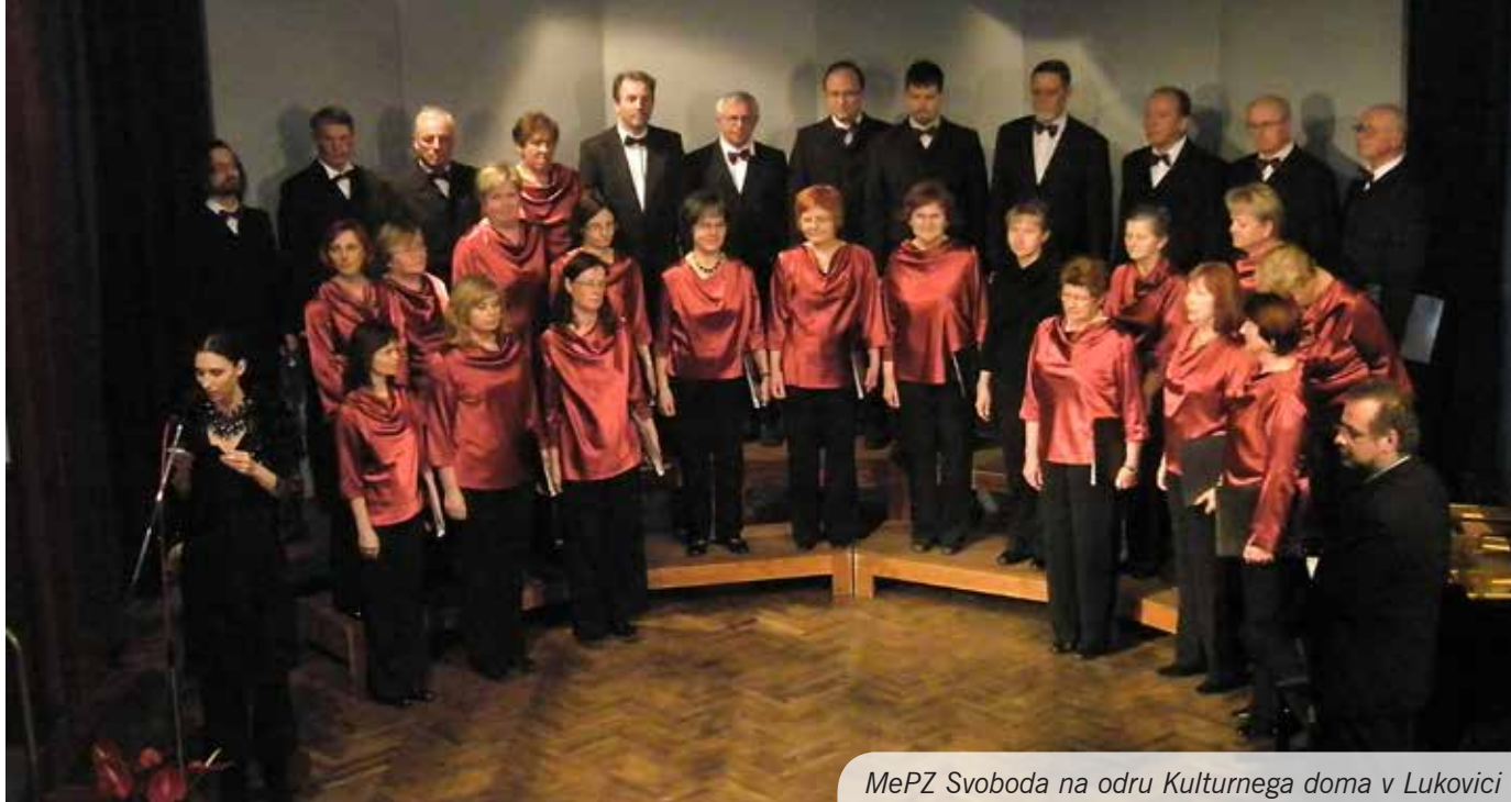
MePZ Svoboda na odru Kulturnega doma v Lukovici