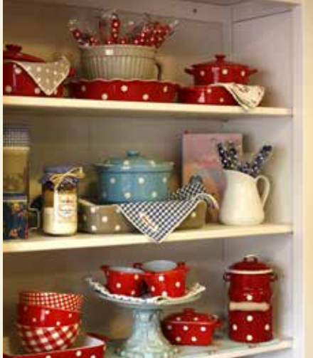
Kuhinjska vitrina s pekači in drobnimi kuhinjskimi pripomočki, ki jih je možno tudi kupiti. Kuhinji dajejo posebno toplino in nostalgično vzdušje.