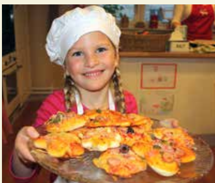
V Lončku prirejajo tematske delavnice – rojstnodnevne zabave, velikonočno, valentinčково peko ...