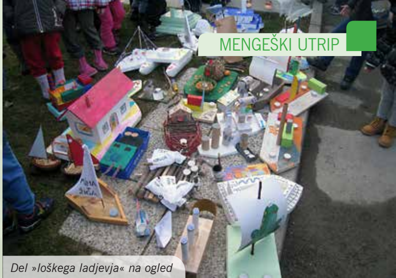
Del »loškega ladjevja« na ogled