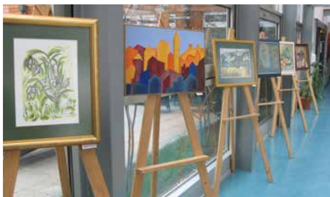
Člani Likovnega društva Mengeš smo se predstavili s svojimi deli