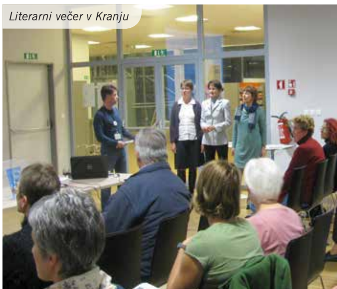
Literarni večer v Kranju

Besedilo in foto: Nevenka Kovač, Regina Bokan