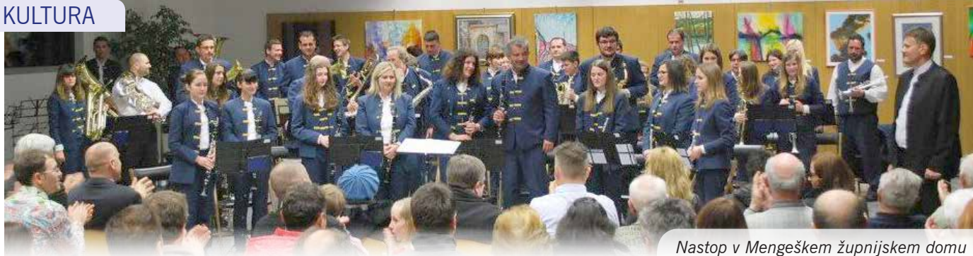
Nastop v Mengeškem župnijskem domu