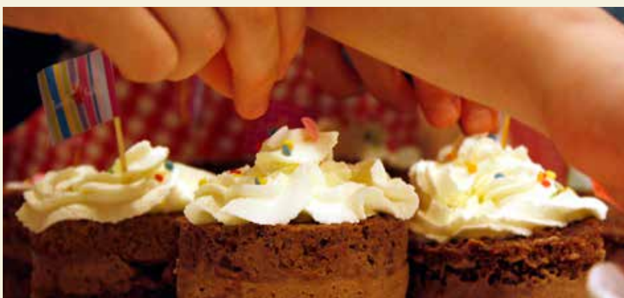
Po vsaki delavnici otroci dobrote skupaj z receptom odnesejo domov