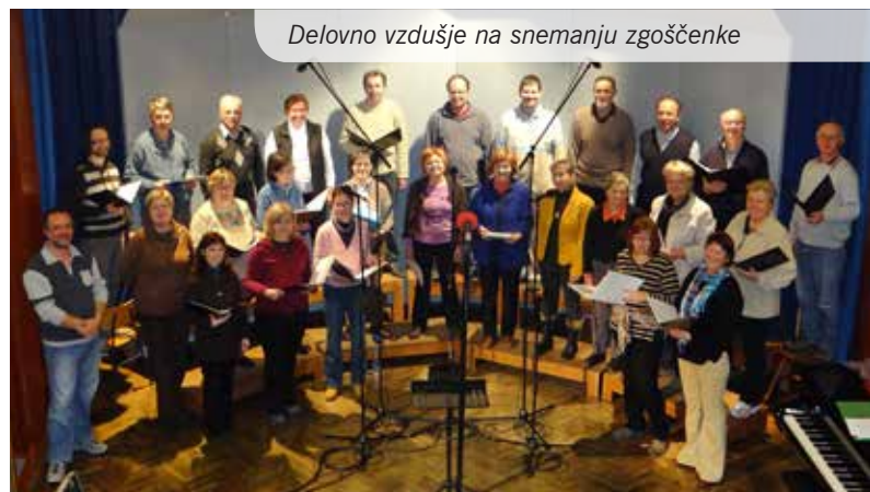
Delovno vzdušje na snemanju zgoščenske