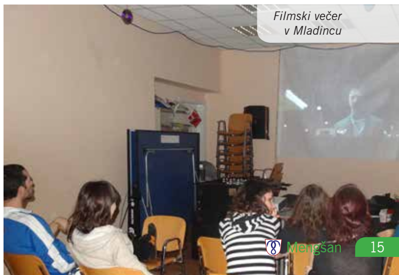
Filmski večer v Mladincu