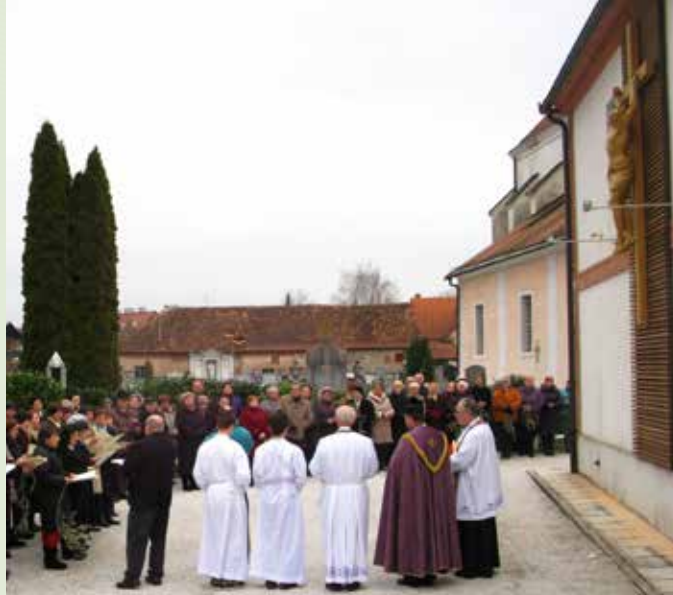
Slovesnost blagoslova so s petjem polepšali pevci cerkvenega mešanega zbora sv. Mihaela in številni župljani