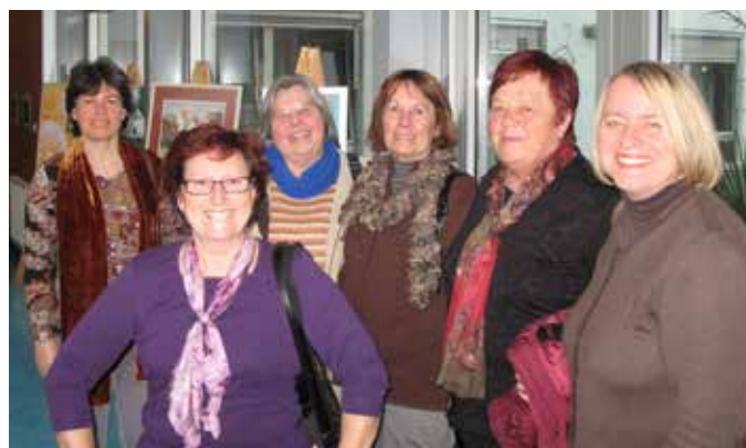
Na otvoritvi društvene razstave LDM v DSO Fužine Ljubljana