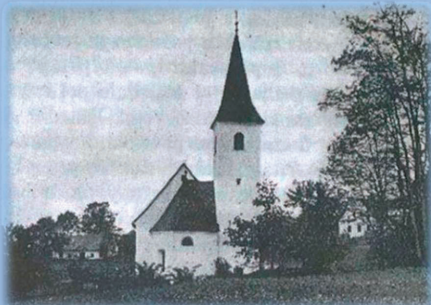
Guzejeva rojstna hiša pri cerkvi v Primožu pri Šentjurju

Rojen v slamnati, borni bajti na obrobju Kozjanskega. Pri krčmarici na Dobrni se je, soldat 87. polka, žandar, večš nemškega jezika, zaposlil. A naletel je na pretrd oreh: ženski ni bilo mar za njegovo delo, zanimal jo je on - moški. Zavrnil jo je. Maščevala se je brez pomisleka in ga obtožila kraje. Bil je obsojen, strpali so ga v keho, od koder je ušel in se po robinhoodovsko zatekel v maščevanje.