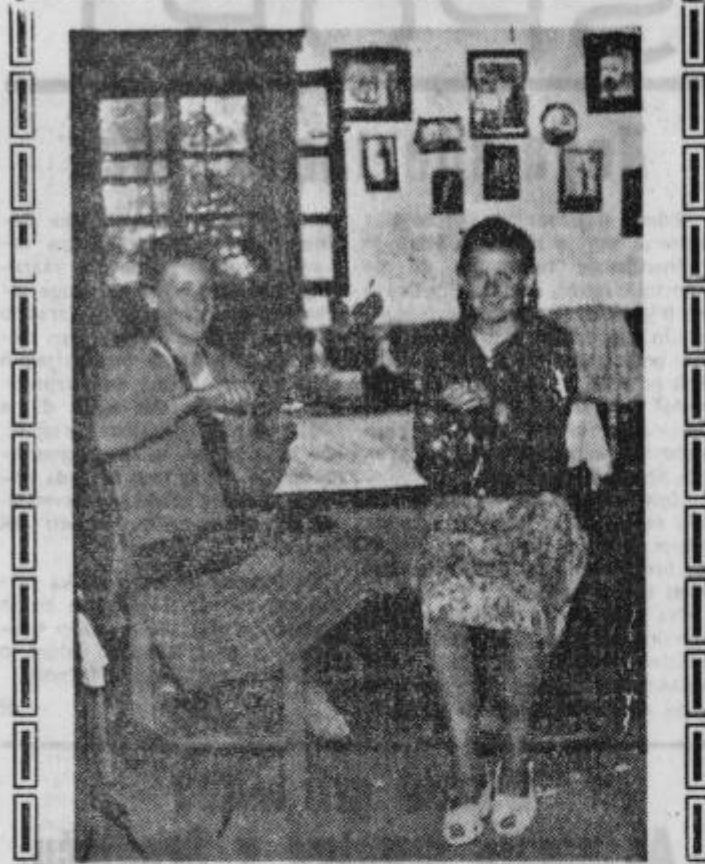
Francka in Mica pri izdelovanju lustr

dokončala osemletko. Ta starodavni slovenjgoriški izdelek, s kinca, bi še bolj zaslovel, če bi se dekleti domislili in izdelovali take miniaturne lustre kot turistične spominčke. Turistični društvi Ptuj in Gomila bi dekletoma lahko tozadevno svetovali. Spodbudna bi bila še beseda etnografa iz ptujskega muzeja, ki je gotovo zasledil v starodavnih zapisih vsaj besedo o opisanih lustrah. O njih vedo precej povedati stari ljudje iz Slovenskih goric, ki so posojali take okrase zlasti ob gostijah znancem in prijateljem. Prav gotovo je v Slovenskih goricah več izdelovalcev raznih okrasnih predmetov, za katere se javnost ne ve in jih bo potrebno odkriti ter opisati. Ti izdelki iz domačih surovin niso toliko komercialne kot narodopisne in okrasne vrednosti. J. Bežjak