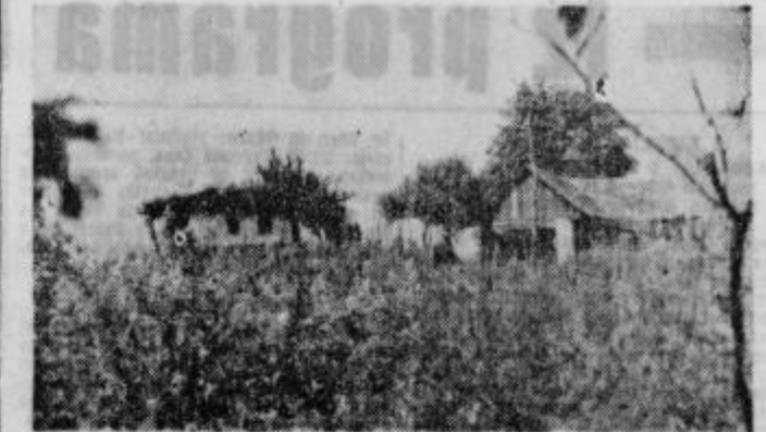
Tako zapuščene hiše je potrebno obnoviti ali pa odstraniti

Kakor štorškino gnezdo je v Dragoviču pri Juršincih nad drugače čedni vinogradi in sadovnjaki stara, zapuščena in razpadajoča hiša, kjer je bil nekoč lep in prijeten domek. Premajhna skrb gospodarja je privedla tako daleč, da se je nekoga poletnega dne veter poigraval