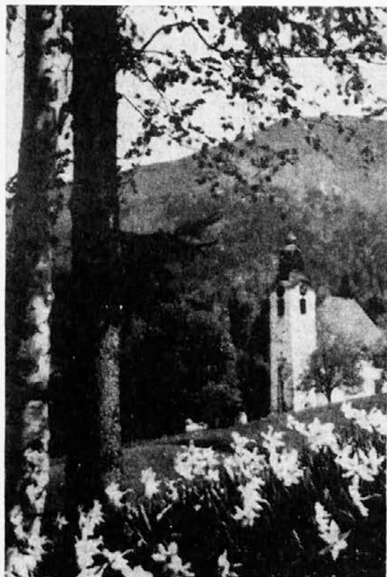
V Slovenijo je prišla velika noč . . .