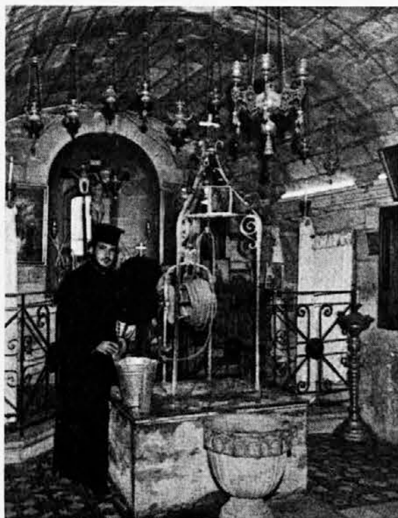
Sihem: Jakobov vodnjak danes

Iz Jeruzalema proti severni Galileji smo se že vozili, saj smo si ogledali Nazaret in kraje okrog Genezareškega jezera, kjer se je Jezus mudil najraje in najpogosteje. Pot vodi skozi pusto Samarijo, kjer se še nismo ustavili. Prav je, da si ogledamo tudi Sihem z Jakobovim vodnjakom, ki nas spomni na Jezusov razgovor s Samarijanko.