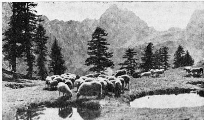
Pomlad v slovskih planinah