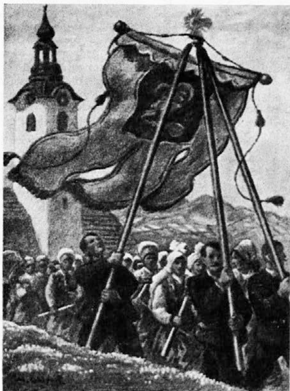
M. Gaspari: Procesija Vstajenja

OBILICO MILOSTI VSTALEGA ZVELIČARJA ŽELITA VSEM SOTRUDNIKOM, DOBROTNIKOM, NAROČNIKOM IN BRALCEM UREDNIŠTVO IN UPRAVA "MISLI"