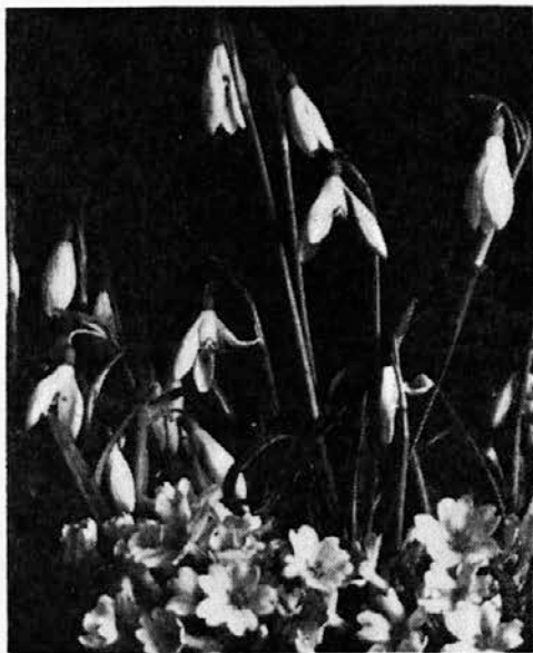
Prvi znanilci slovenske pomladi . . .