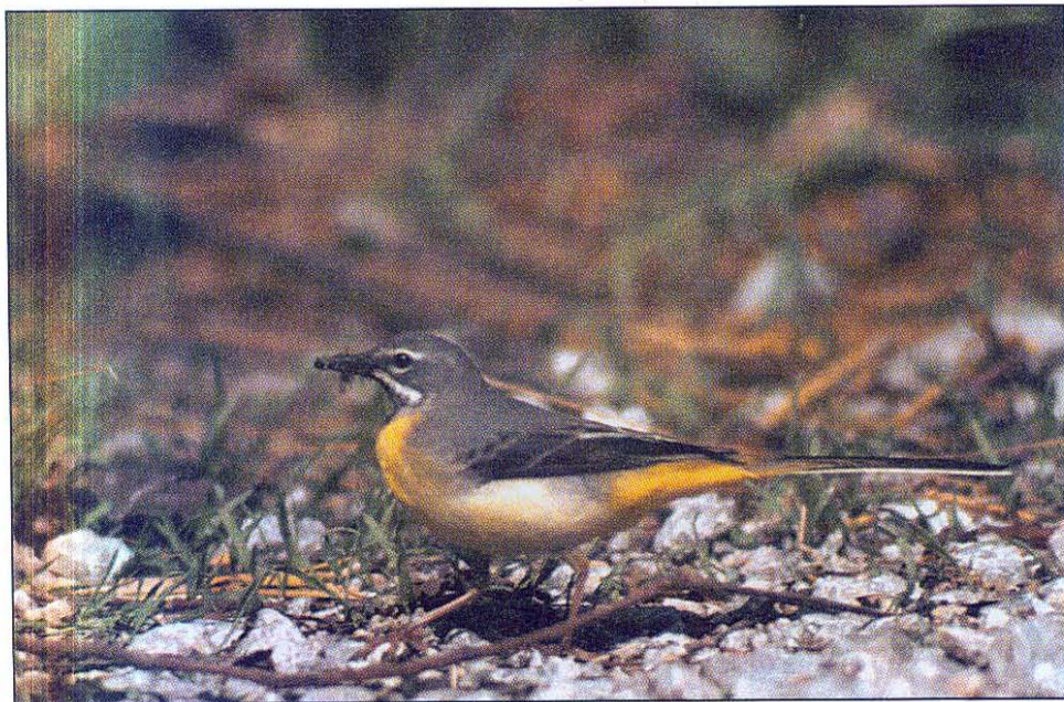
Slika 3: Pod gnezdom se je prikazal samec s polnim kljunom.

Fig. 3: A male below the nest with his bill full of food