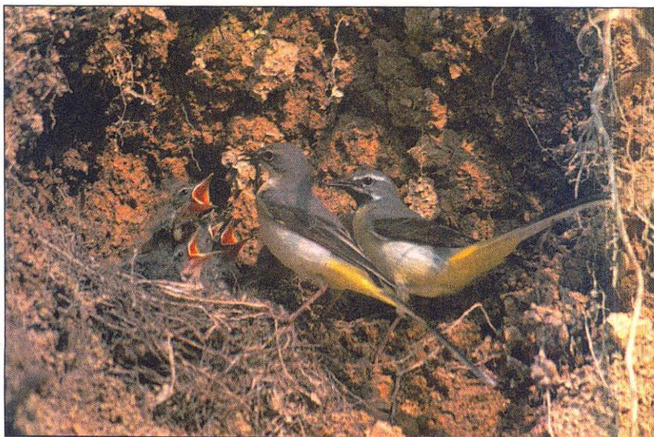
Fig. 2: As soon as she feeds the young, the female watches if any of her offspring is going to empty its bowels.

Slika 2: Samica potem, ko odda hrano, opazuje, ali se bo kateri od mladičev iztrebil.