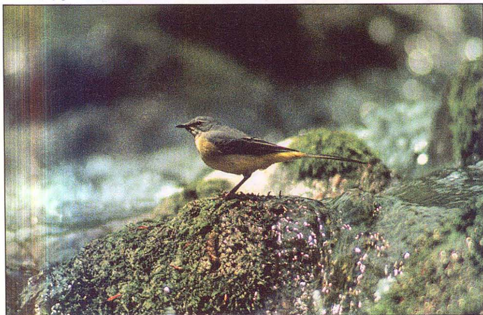
Slika 1: Značilno življenjsko okolje sive pastirice so bistri potoki.

Siva pastirica po postavi spominja na belo pastirico Motacilla alba , le da ima daljši rep, po obarvanosti pa na rumeno Motacilla flava , ki ima rep še krajši.