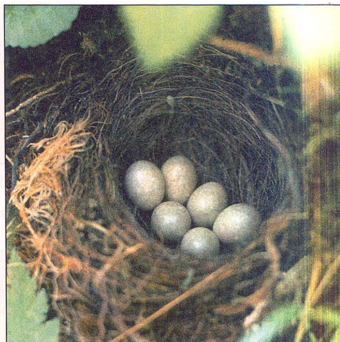
Slika 5: Leglo sive pastirice Fig. 5: Grey Wagtail's clutch

Jajca sive pastirice so rumenkasta oziroma sivo bela z drobnimi rjavimi