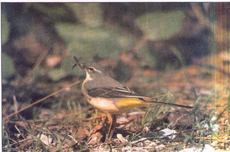
Fig. 4: A female with a billful below the nest

Slika 4: Samica s polnim kljunom pod gnezdrom