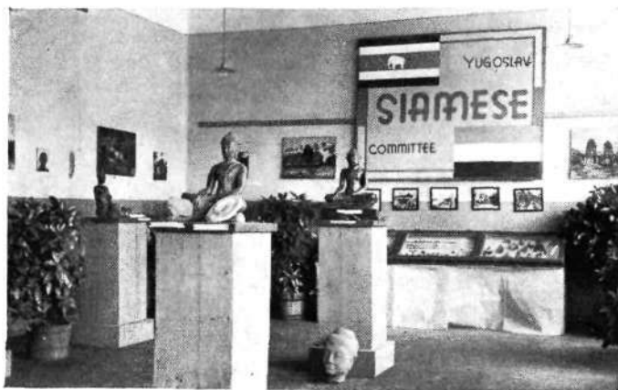
III. Mariborski teden; del siamske razstave

Izrazito tujskoprometnega značaja je bil poset Ljubljane Mariboru (24. junija) in tretji Mariborski teden (4.—15. avg.). Mariborski teden je poleg pratra in zaključne prireditve na Mariborskem otoku vseboval tujskoprometno, obrtno, gozdovniško, skavtsko, ženskih ročnih del, siamsko, vrtnarsko, gostilničarsko in hotelirsko, slikarsko, šolskih ročnih del, akvarijsko in jadralnoletalsko razstavo; osrednji značaj vseh razstav je imela vajeniška in pomočniška razstava, organizirana po Slov. obrtnem društvu. Ob-