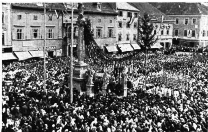
Evharistični kongres v Mariboru med pontifikalno mašo pred magistratom