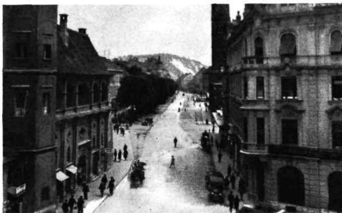
Aleksandrova cesta z bivšim drevoredom divjih kostanjev

Vremensko je bilo letošnje mariborsko poletje relativno hladno in mokro.