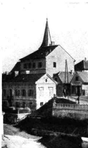
Turkova hiša na današnji Pobrežki cesti