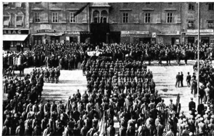
Knezoškoč I. Tomažič blagoslavlja krsto z generalom R. Maistrom pod balkonom magistrata