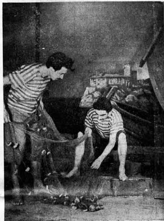
Prizor iz Goldonijevе komedije »Primorske zdrahe«