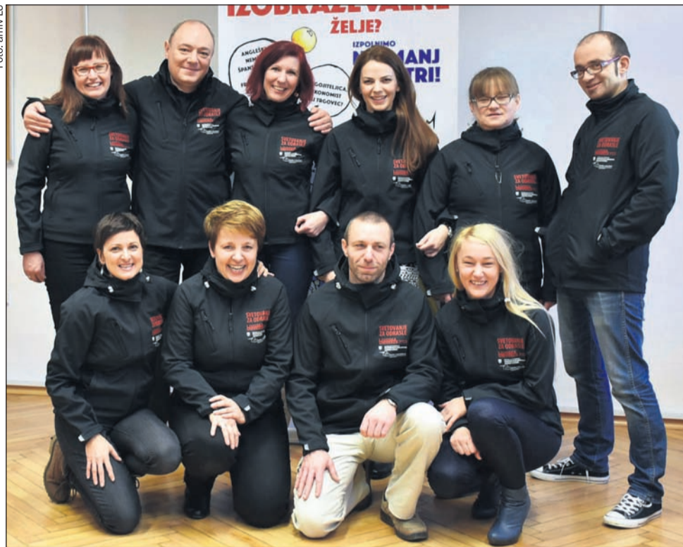
Kolektiv Ljudske univerze Ptuj

Njihovi projekti segajo na področje aktivnega staranja, iskanja novih priložnosti za mlade, govorijo o socialni odgovornosti univerz do lokalnega okolja, iščejo rešitve za novodobne svetovalce v izobraževanju ali se soočajo s ksenofobijo in drugimi predsodki.