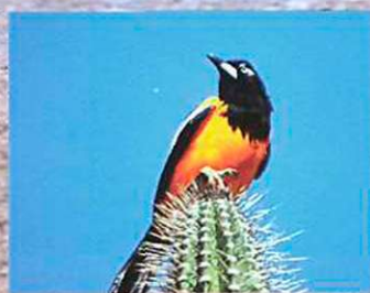
Trupial ( Icterus icterus )