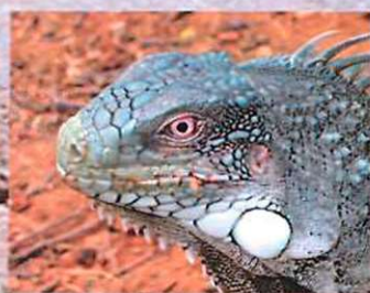
Legvani na Boniaru.

Pravzaprav sem hotel preživeti letošnji dopust med tropskimi ribami – prvič z digitalno kamero v roki. Velika želja: Maldivi, kajpak. Cene agencijskih paketov so bile sicer sprejemljive, vendar se je izkazalo, da so vsa boljša mesta zasedena mesece vnaprej. Za pomoč sem pobrskal po svetovnem spletu. Slovenski podvodni fotografi so me zasuli z odgovori, najbolj prepričljiv pa je bil Mariborčan, ki mi je zagotovil, da se lahko brez obotavljanja odločim za otok Bonaire.