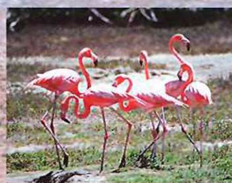
Plamenci ( Phoenicopterus ruber )