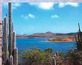
Jezera v notranjosti so slana.