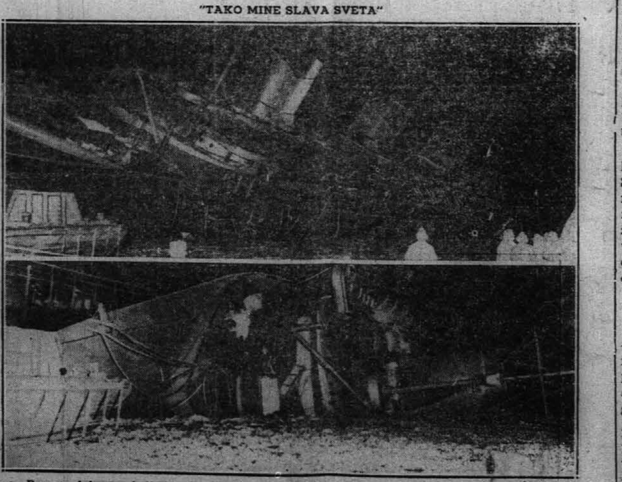
"TAKO MINE SLAVA SVETA" Ponočna luksuzna ladja Normandie, pred komaj par leti nazvana "kraljica morja", leži zdaj v newyorškem pristanišču ponižana do dna. Zadnji teden je izbruhnil na njej požar in tonske vode, ki so jih ognjegasci ob tej priliki spustili na njo, so povzročile, da se je parnik najprej nagnil in potem v polnoma zvrnil. Gornja polovica slike kaže ladjo, ko se nagiba, spodnja, ko leži na svoji strani v blatu.

Tokio, Japonska. — Kakor je objavil tukajšnji radio, je vo- jaško poveljstvo poročalo ce- sarju Hirohito, da se je v Sin- gaporu brezpogojno podalo 60.- 000 britanskih vojakov, in ča- sopsna agencija navaja potek zgodovinskega razgovora zad- njo nedeljo, ki je trajal 49 mi- nut med japonskim poveljni- kom Jamašita in britanskim poveljnikom Percivalom. Razgo- vor je bil sledeči: Jamašita: "Želim, da bodo odgovori kratki in točni. Upo- števal bom le brezpogojno poda- jo." Percival: "Da." J.: "Ali so kaj japonskih vo- jakov ujeli Britanci?" P.: "Ne, niti enega samega ne." J.: "Ne bom vam stavil vpra- šanja, ali se želite podati, ali ne, in, ako se želite, zahtevam, da bo to brezpogojno. Kaj je vaš odgovor, da ali ne?" P.: "Ali mi dovolite časa do jutri?" J.: "Do jutri? Ne morem ča- kati, in potemtakem se razume, da bodo morale japonske sile napasti nočoj." Percival je nato prosil za od- log samo par ur, a tudi to mu je bilo odbito ter je Jamašita zahteval ponovno takojšen od- govor. Ko je bil Percival nekaj trenutkov tiho, je Jamašita de- jal: J.: "Želim slišati odločen odgovor in vztrajam na brezpo- gojni podaji. Kaj pravite?" P.: "Da." Nato je Percival pristal še, da se točno ob 10. zvečer prene- ha streljanje in, da Japonci vko- rakajo v mesto Singapor.