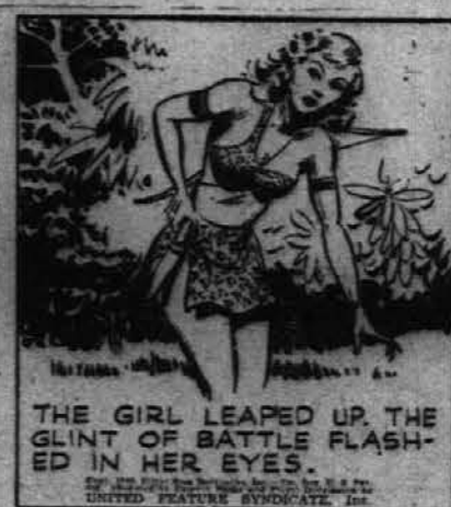
Tarzela je naglo skočila na noge. Bojevalno so se ji zasvetile oči.