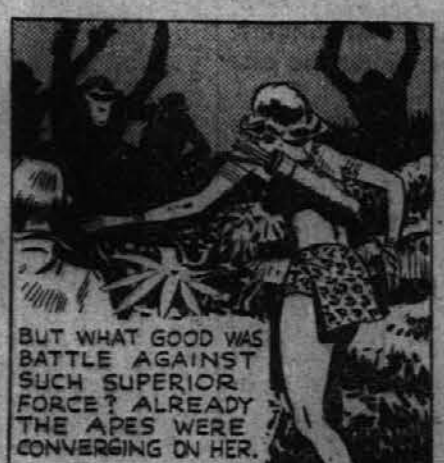
Toda, kakšno korist naj ima od bojevanja proti veliki premoči? Opice so od vseh strani hitele k njej.