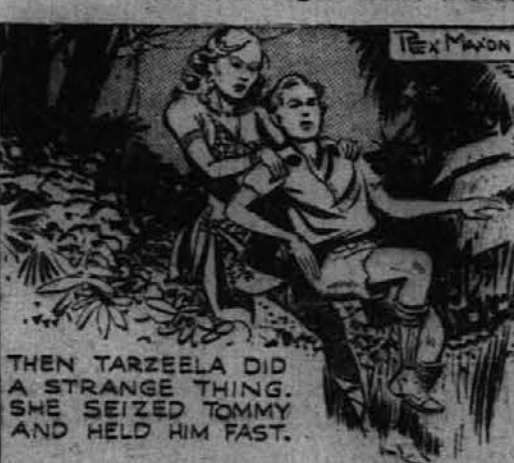
Tedaj je Tarzela napravila nekaj tujega. Prijela je Tommyja in ga krepko držala.