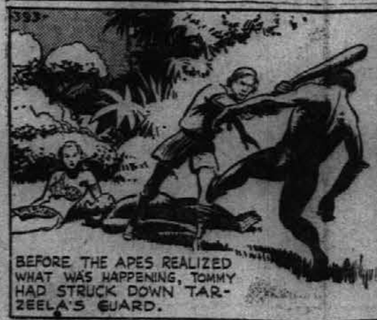
Predno so se opice zavedle kaj se je zgodilo, je bila Tarzelina straža pobita na tla.