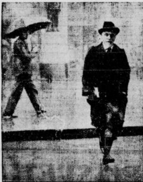
Guverner »Angleške banke«: Montague Norman na vsakdanjem potu v urad. Kakor vidimo, se Norman tudi v dežju ne vozi z avtomobilom na delo, marveč si obleče nepremočljiv plašč in podviha hlače.