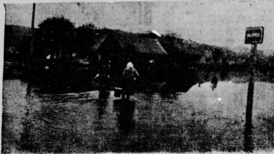
V ljubljanskih predmestjih