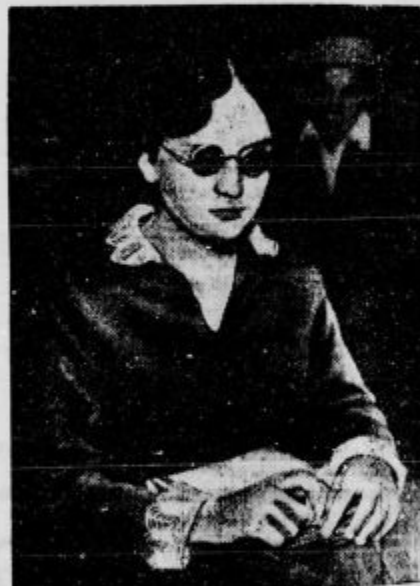
Slepa tipkarica — zmagovalka na tekmah: 14-letna slepa deklica, ki je na pariških tipkarskih tekmah dosegla prvo nagrado. Ni le tipkala najbolj hitro, marveč tudi najbolj točno.