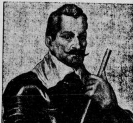
Albrecht Wallenstein znameniti vojskovodja 30 letne vojne, 24. septembra t. l. so praznovali 350 letnico njegovega rojstva