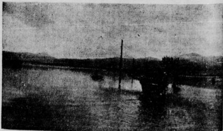
Ljubljansko barje pod vodo

Zdravnik: »Tega ne vem, toda tako bo prebrani denar in lahko plačal moje račune.«