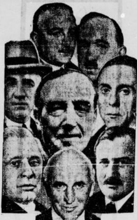
Pred zborovanjem Zveze narodov in razorožitvene konference v Ženevi: Spodaj (od leve na desno): francoski zunanji minister Paul-Boncour, angleški zunanji minister sir John Simon in francoski ministrski predsednik Daladier; na sredi: ameriški pooblaščenec Norman Davis, predsednik razorožitvene konference Henderson, nemški minister za propagando dr. Goebbels; zgoraj nemški zunanji minister dr. Neurath in českoslovaški zunanji minister Beneš.