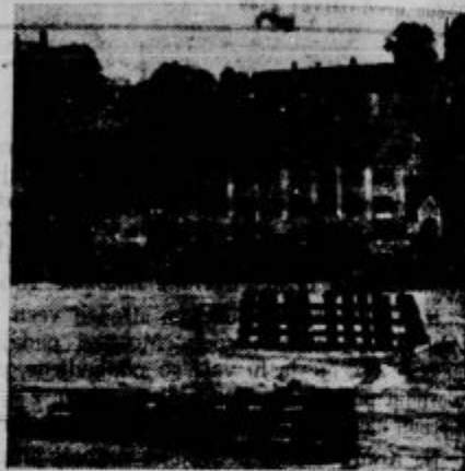
Ostanki mestu v Celju

Jugoslovanski knjigarni v Ljubljani in stane 5 Din brez poštne.