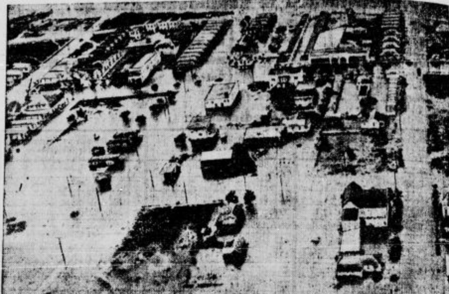
Mesto Corpus Christi v Teksasu — USA —, ki ga je ob strašnem viharju zalila voda. Povodenje je nastala na ta način, da je vihar hrumel po dolini reke Rio Grande navzgor in zajezil vode, ki so se nato razlile po ozemlju. Opustošenja so strašna.