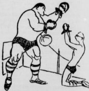
»Mojster, za božjo voljo vas prosim, ali ne bi mogli dajati pouka v boks — pismeno?«

Velik aeroplan je plul nad morskno gladino v bližini Neaplja. Naenkrat nekaj počni, pilot se zvesni ter se obne do potnikov: »Ali je kdo izmed vas že slišal pregovor: »Videti Neapelj, potem umreti!« — »Seveda nam je ta pregovor znane, so odvračili skoro vsi potnik. »Dobro«, pravi pilot, »zdaj smo nad Neapljem, na našem motorju pa nekaj ni v redu. Le dobro si oglejte mesto.«