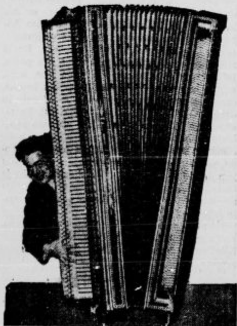
Največja harmonika na svetu: akkordion v nekem pariškem cirkusu. Harmonika je visoka 2,5 m in njen zvok je tako močan kakor mogočen orkester.