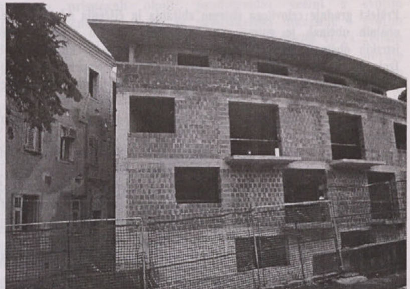
Gradnja ob staren Zdravstvenem domu. Bo upravna enota po novem na tej lokaciji?

- Uredili smo tako, da stranka praktično vse uredi pri nas. Vse stroške plača na blagajni, ki smo jo uvedli, imamo plačevanje s