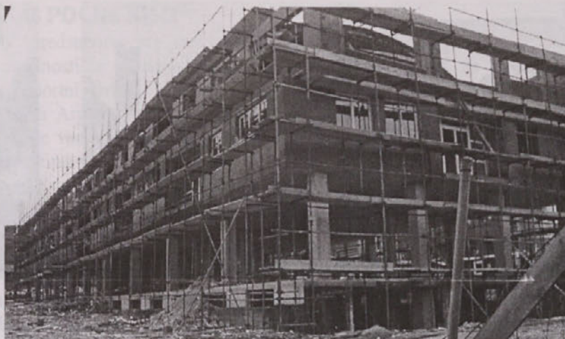
Poslovna stavba v obrtni coni Livade . Bo po novem Upravna enota morda tukaj?