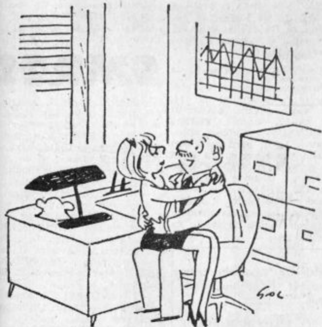
— Če bi slučajno vstopila moja žena, se delaj, kot da sem te pravkar odpustil!

leške doline. Ob tej priložnosti bodo pripravili tudi krajši program, in sicer bodo nastopili pripadniki JLA z recitacijami, folklorno skupino in zabavno glasbenim ansambлом, mladi Velenjčani pa bodo pripravili recitacije in skeč.