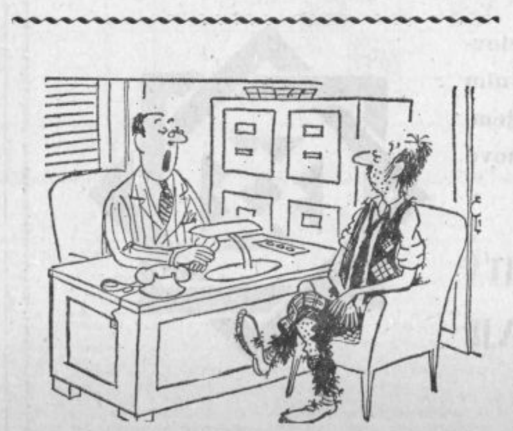
— Ne vidim razloga, zakaj bi vam povišali plačo?