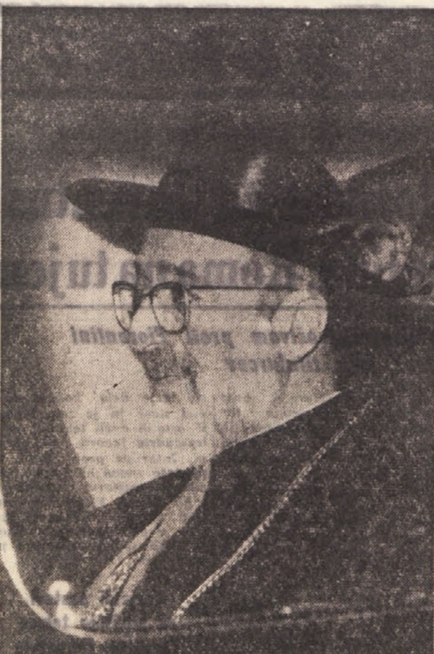
Kardinal Agadjanjan za katerega mnogi menijo, da je med najresnejšimi kandidati za papeški prestol, ki je po smrti Pija XII. ostal prazen. Le nekaj dni pred papežev smrtjo je ob odhodu sedel v avtomobil. Agadjanjan je armenskega porekla. Sicer pa je več kandidatov in le bel dim bo najjavil novega papeža