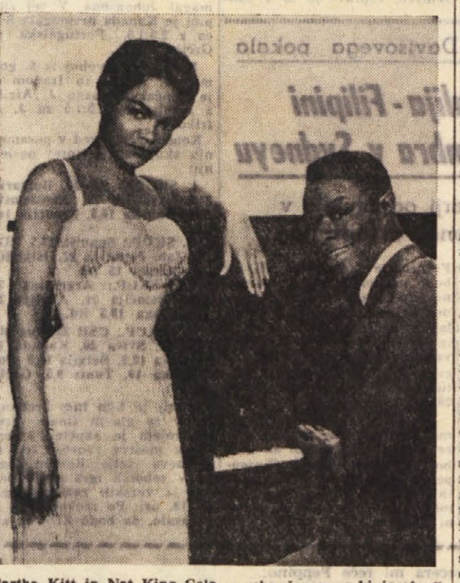
Eartha Kitt in Nat King Cole — oba črnca — ki igra v filmu «St. Luis Blues». Sicer je to film, v katerem igrajo skoraj sami črnca. Kako se skladata umetnost in plemenska diskriminacija, ve le Faubus

A tudi po zmagi nad fašizmom se Santinovo zadržanje do slovenske duhovščine ni spremenilo. Poleg tega smo se pritožbe slovenske tržaško-koprske škofije, ki so bile poslane skofu Santinu 8. septembra 1948, v točki 3. teh pritožb rečeno: «Muitum offensi sunt sacerdotibus Slavi, audientes et pium, praesertim postremis annis, et recentis temporibus activum. Item aegre ferunt, quod Episcopus, praesertim, coetu quodam secreto consecretorum operaque utitur copiosiorum, non omnibus operibus maiorem, dum sacerdotibus et probatis vitae saecularibus in gravibus ecclesiae in vix quidem convalescentibus».