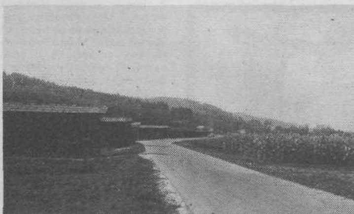
Pogled s poti iz Bizovika proti Ljubljani. Miren in privlačen kotiček za kolesarje in pešce, da o lepoti krajine s kozolci sploh ne govorimo.