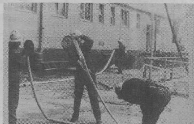
Vodne cevi morajo biti vedno ustrezno zložene

Opozoriti pa velja, da so bile tudi tokrat tovarniške transportne poti preveč zatrpane in večja gasilska vozila bi ob resničnem požaru ne bi prišla do tja, kamor bi morala priti. V. J.