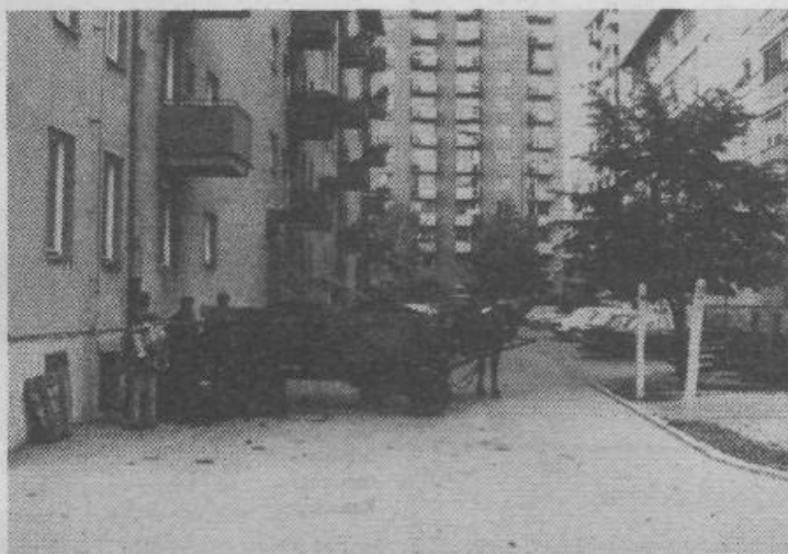
V blok ob Pokopališču so pripeljali dolgo pričakovani premog. Star pregovor pravi, da premog trikrat greje: prvič ko ga plačaš, drugič, ko ga spravljáš v drvarnico in tretjič, ko zakuriš peč.