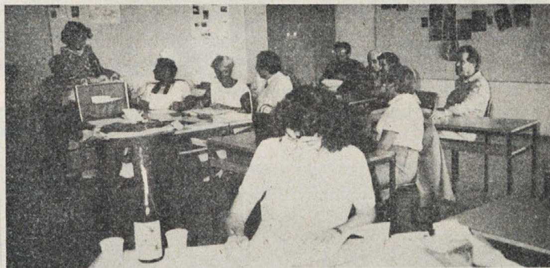
Po končani maturi je bila še zadnja seja izpitne komisije. Razred je tudi »zrelostni izpit« opravil 100-odstotno. Na to se pa že lahko pije!