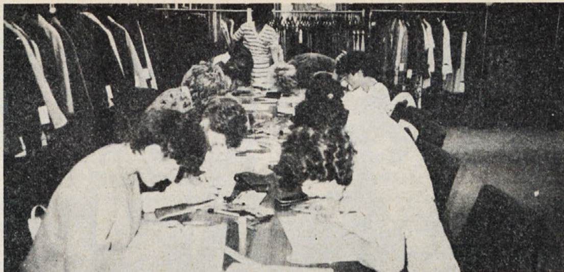
Krojno risanje na koncu 4. letnika je bila ena zadnjih nalog pred matura. Tako resno, kot so se lotili tega izpita, so slušatelji delali prav pri vseh predmetih in zato je bil ves strah pred matura odveč.