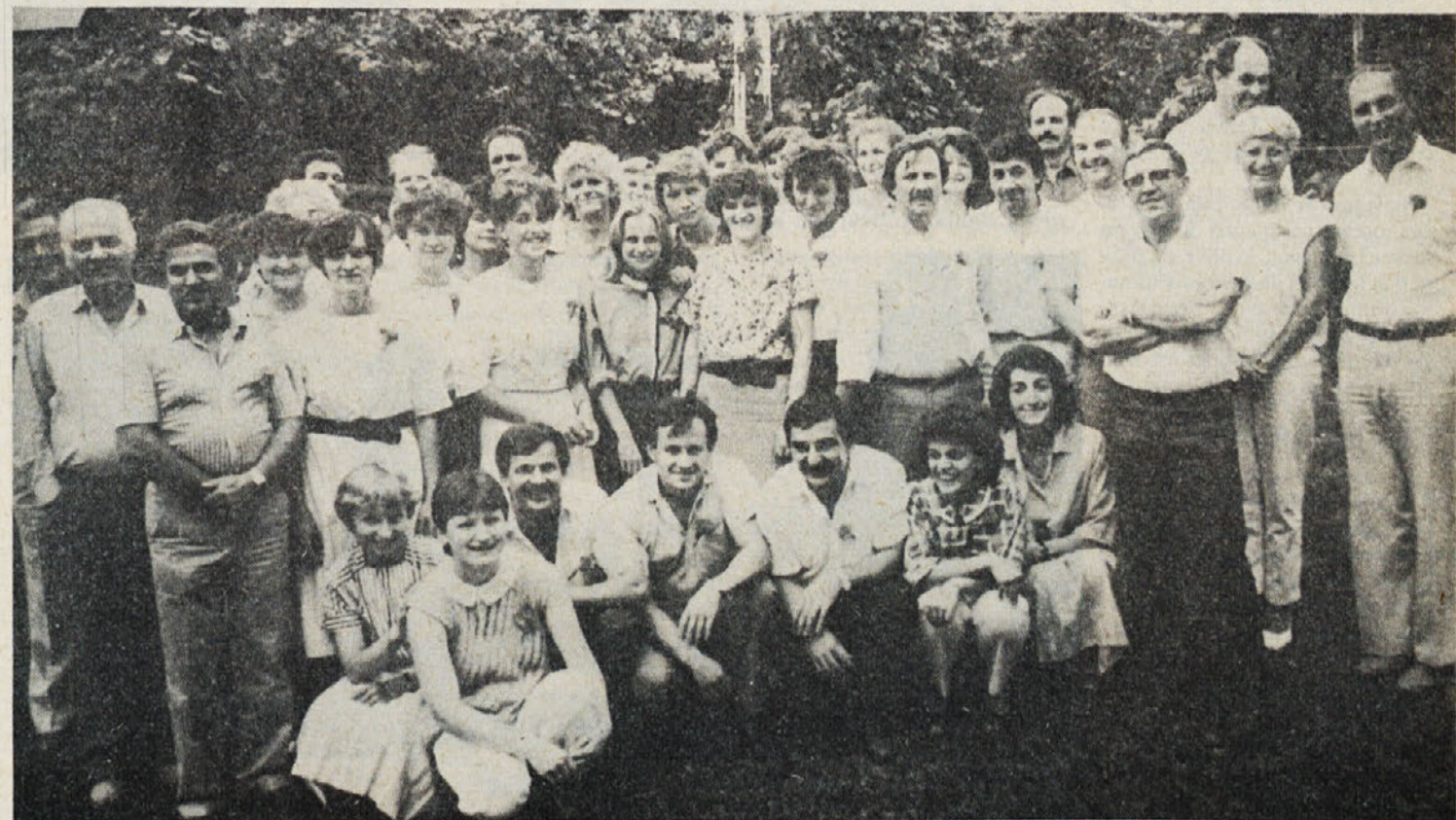
Po uradnem delu ob podelitvi diplom še skupen posnetek slušateljev, predavateljev in predstavnikov obeh delovnih organizacij, Novoteksa in Laboda.

Zadnje dni v avgustu so opravljali matura delavci Laboda in Novoteksa, ki so se pred dobrima dvema letoma odločili za šolanje ob delu. Šolanje je organizirala kadrovska služba, izvajalec pa je bila mariborska srednja tekstilna šola. Ker je imela večina slušateljev pred tem narejeno dvo-ali triletno šolo, so najprej opravili diferencialne izpite, četrti letnik pa je potekal redno. Šolanje ni bilo lahko, saj je zajemalo številne strokovne predmete in predmete, kot so matematika, samoupravljanje, tuj jezik in slovenščina, predmeti torej, ki so precej razširili obzorje slušateljem.