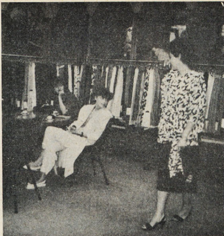
Tik pred zaključevanjem pa še zadnji ogled kolekcije bluz in kril.

— ob 50 odst. angažiranju proizvodnih kapacitet v izvoz nam nerealen tečaj dinarja povzroča precejšen izpad dohodka;