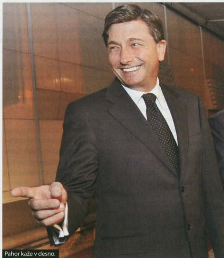
Pahor kaže v desno.

Kar bo do njih šele privedlo, je generacijski premik v politični nomenklaturi oziroma gesta v registru tega, kar se je pri nas zgodilo konec osemdesetih let. Torej, nekakšno družbeno vrenje, ki uspe odpreti povsem nov politični prostor. Potrebno je priznati, da smo bili takšne geste Slovenci večinoma sposobni šele ob izdatnem zunanje-političnem krošju oziroma takrat, ko so se tudi mednarodne politične razmere do konca zaostriale. A glede na trenutno stanje sveta, očitno tudi na to ne bo potrebno predolgo čakati.