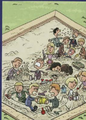
Naslovnica in ilustracija pri peticiji: Zoran Smiljanič

Katedra je sofinancirana s strani Študentskega sveta Univerze v Mariboru in Ministrstva za Kulturo RS.